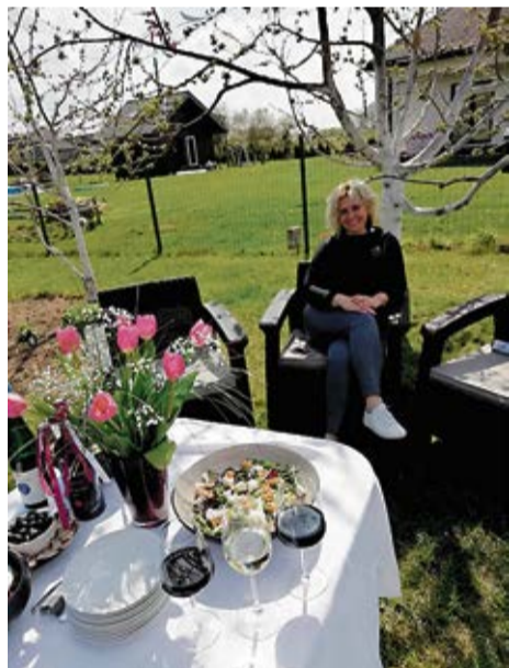
Baltais galdauts brīvā dabā. Svētki Vitas Vēveres ģimenē.