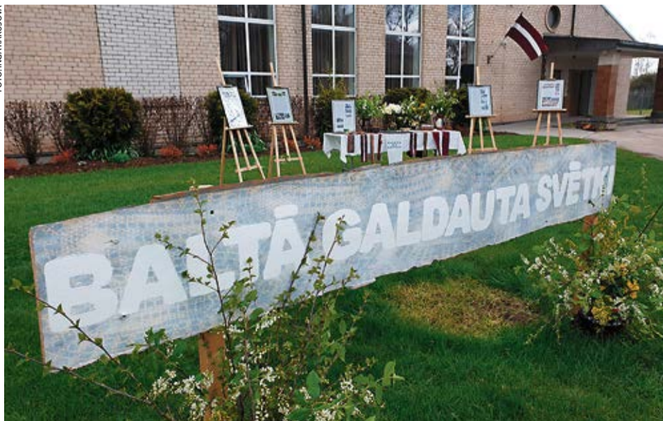
4.maija svētku izstāde pie Vecumnieku tautas nama