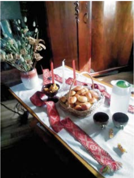
Misas iedzīvotājas Vijas Ozolas tautiski klātais un rotātais svētku galds.