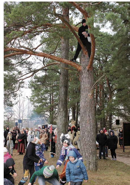
«Meteņa mīziens» - prieki lieliem un maziem. Konfektēm krietno no koka, ūdens šaltis pār galvu ir nieks vien.

Jau tradicionāli pirmspusdienā folkloras kopas devās uz novada lauku sētām, kur, maskās tērpušies, vadīja Meteņdienas rituālu, lai šajā gadā kuplo druvas, lai labi aug lopi, lai auglība, veselība un labklājība ienāk katrā mājā un skar ikvienu.