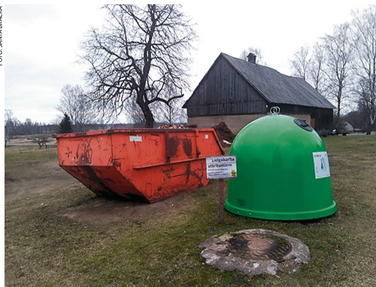
Lielgabarīta konteiners, kas atrodas pie Bārbeles pagasta pārvaldes, nav domāts būvgružiem un sadzīves atkritumiem.

Tā kā Vecumnieku novadā notiek atkritumu šķirošana, sava vieta ir arī elektroprecēm. Tās nedrīkst atstāt pie lielgabarīta konteinerā. Katrs iedzīvotājs var sazināties ar SIA «Eco Baltia vide» un lūgt konkrētajā adresē izvest nolietoto sadzīves tehniku. Ja būs iedzīvotāju pieprasījums, sazinoties ar pašvaldību, iespējams lūgt rīkot akciju par nolietotās sadzīves tehnikas savākšanu - līdzīgi kā tas notika 2019.gada pavasarī. Tuvojoties pavasarim, vairāk manāmi arī nokrišņi, kas šķidrina pagasta ceļus. Esam saprotoši, jo laika apstākļus ietekmēt nav iespējams, bet sekojot līdzi prognozēm, ir iespējams iespēju robežās plānot smagāku kravu vešanu pa pašvaldības ceļiem.