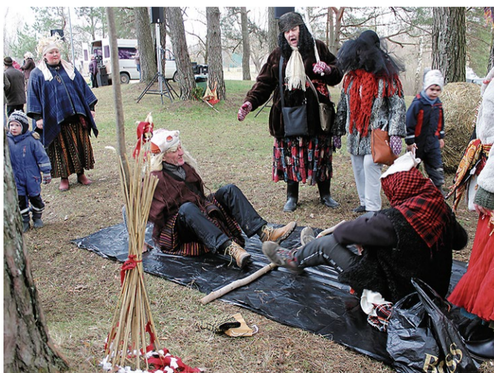
Liela piekrišana bija «viru ciņām» Jaunā ezera krastā.