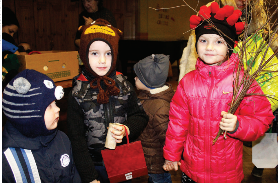
Lidzi bija jāņem arī žagari – slinkākajiem saimniekiem, bet maskotajā gājienā visi devās, lai nestu svētību, nevis – lai nobiedētu.

Halovīna simbols ir izgrebts ķirbis ar gaismiņu tajā, kas iedegta spokaini liesmo. Arī Misas tautas namā interesentus gaidīja sveicīšu gaismiņas pie tautas nama, kā arī mazs simbols – ķirbītis. Atnācējus sagaidīja folkloras kopa «Tīrums» – sagatavojuši dažādus mūzikas instrumentus, gatavi pastāstīt gan bērniem, gan vecākiem par tradīcijām, kā arī kopīgi izkustēties un izdziedāties, apciemot Misas iedzīvotājus jeb māju saimniekus. Folkloras kopas dalībnieces stāstīja, ka