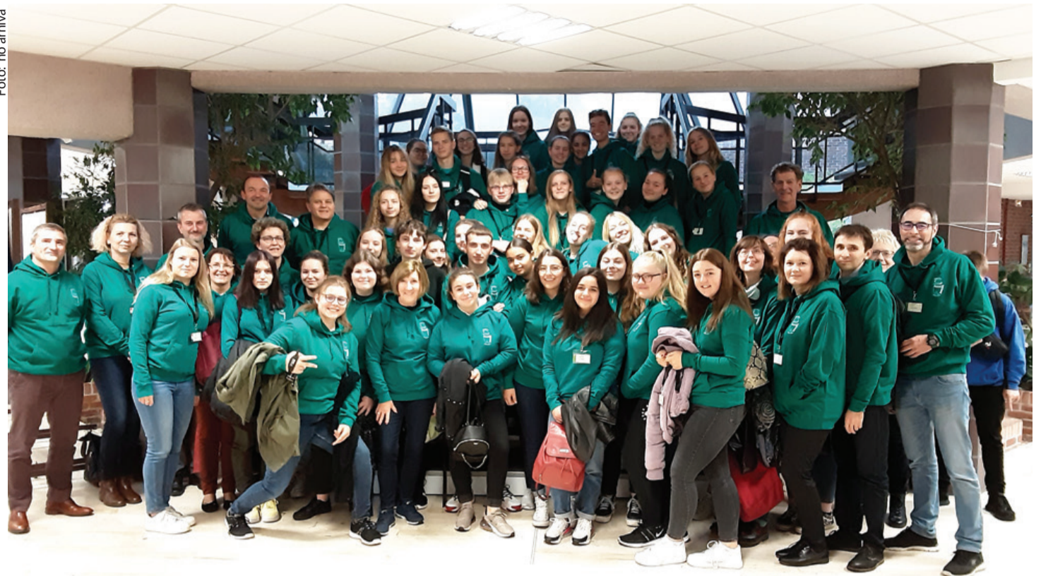
Projekta piecu valstu komanda franču partnerskolā Lycée de l'Europe.