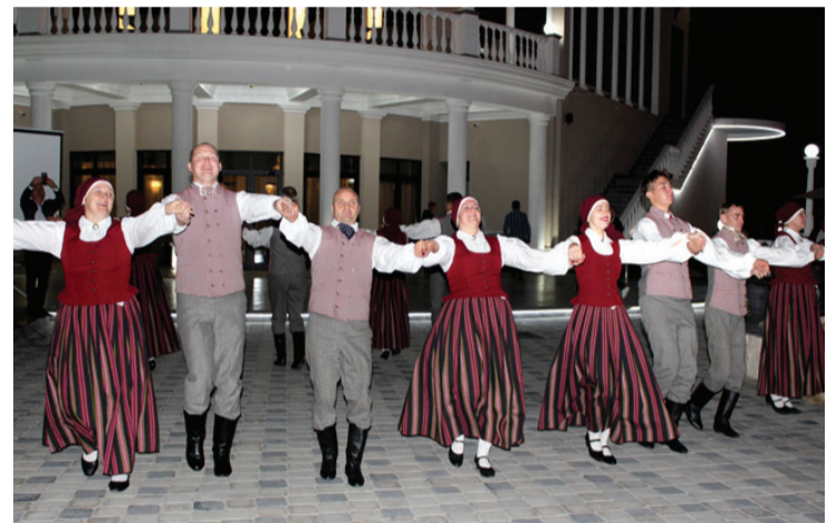
VPDK «Vēveri» iepazīstināja vietējos Kutaisi iedzīvotājus ar latviešu tautas dejām.