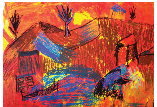
Sarkanais saulriets – Līva Ieviņa, III vieta.