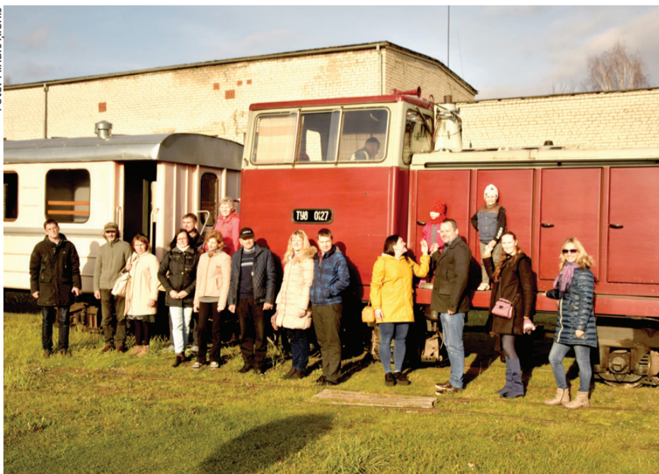
Novada uzņēmēji pie vēsturiskā Misas kūdras bānīša, kas varētu kļūt par tūrisma produktu.