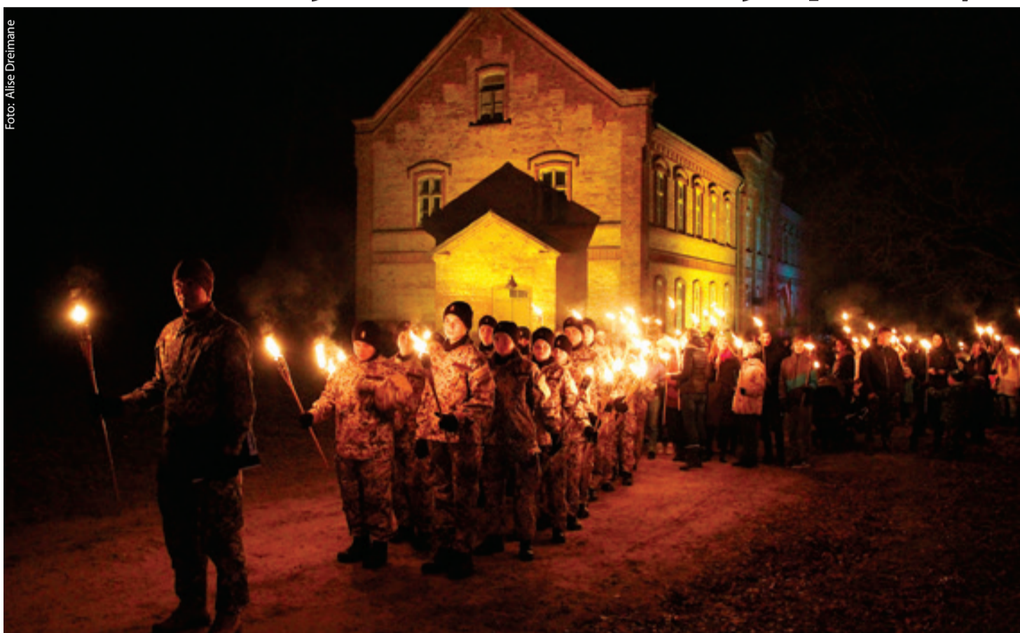
Pie Vecumnieku pagasta muzeja sākās gājieni, kur lielajā ugunskurā visi aizdedza lāpas un steidza ieņemt vietu starp daudzajiem ļaudīm.