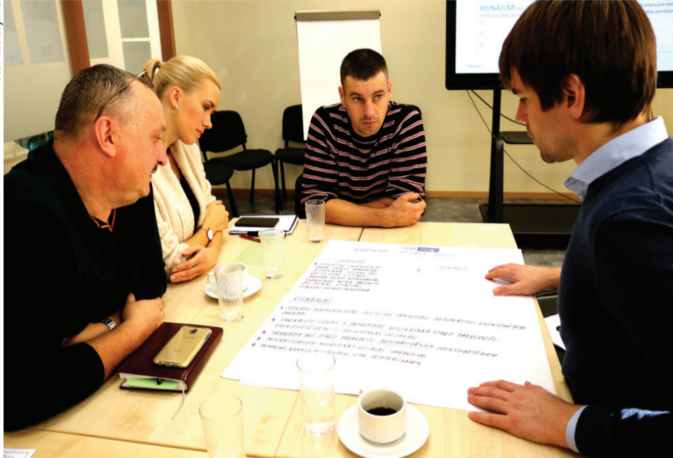
Diskusijā par ugunsdrošības jautājumiem tika noteikti sadarbības trūkumi, kā arī lietas, kas jāsiglabā turpmāk.

Zemgales Plānošanas reģionā 24. un 31. oktobrī norisinājās Interreg V-A Latvijas – Lietuvas pārrobežu sadarbības programmas 2014. – 2020. projekta «Vietējo sabiedrisko drošības pakalpojumu efektivitātes un pieejamības uzlabošana Latvijas un Lietuvas pierobežā» (Safe Borderlands) (LLI-302) iesaistīto pušu apaļā galda diskusijas.