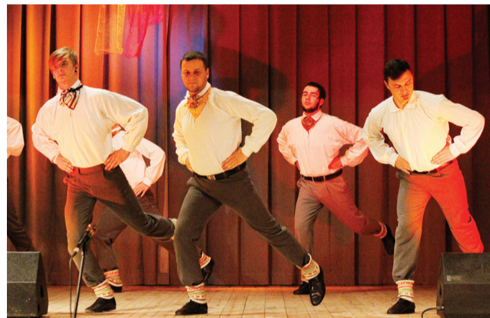
Visskaļākās skatītāju ovācijas izpelnījās Skaistkalnes brašie dejojāji.