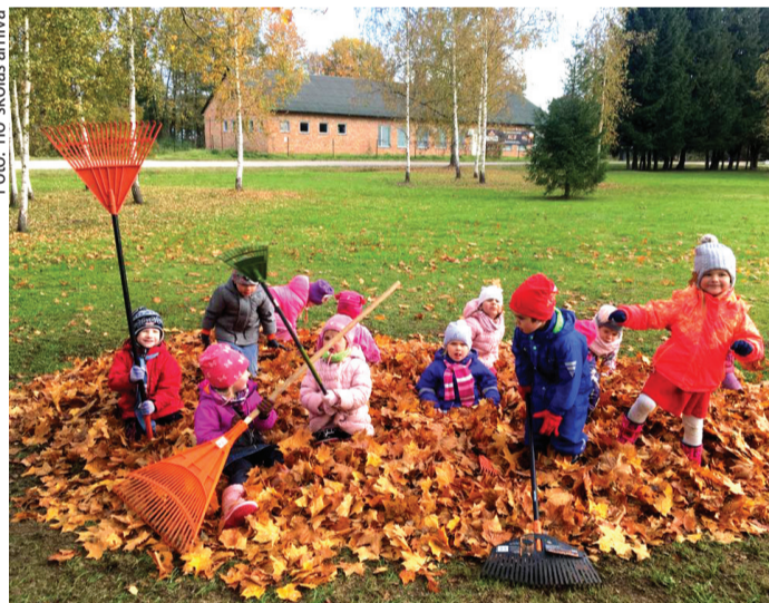
Bērni ar labprāt zprīcējās pašu sagrābtajā lapu kaudzē.

Vecumnieku vidusskolas pirmsskolas iestāde labo darbu nedēļu papildināja gan ar kultūras popularizēšanu, gan ar teritorijas sakopšanu, proti, lapu grābšanas talkām.