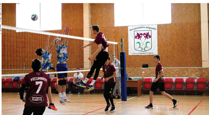
Volejbolisti nospēlēja pārliecinoši un labi, iekļūstot Latvijas Volejbola Federācijas kausa finālā.