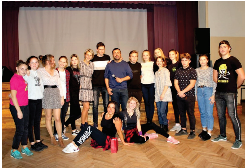
Jaunieši kopīgi izdziedājušies un uzzinājuši daudz jauna par Roberto un kopīgi izkustējušies ar Madaru.

Bija ļoti interesanti klausīties Roberto stāstos par savu dzīvi un gadu laikā uzkrāto pieredzi. Tagad pasākuma apmeklētāji zina daudz jaunu un interesantu faktu par to, kā Roberto nokļuva Latvijā, kā arī par to, kā viņš te iedzīvojas. Roberto stāstīja, ka bija izvēle – starp Igauniju, Lietuvu un Latviju. Sākumā viņš atbrauca mācīt itāļu valodu skolās, bet pēc tam sāka piedalīties dažādos sabiedriskos pasākumos, vēlāk – sāka tos vadīt.