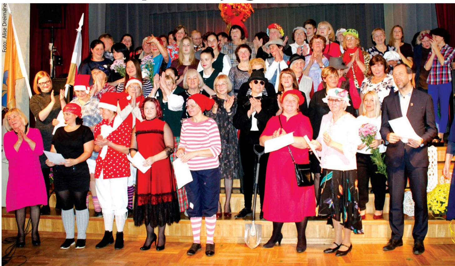
Novada kultūras dārgakmeņi pulcējas kopīgā sezonas atklāšanas pasākumā Skaistkalnē.

«Pasaule mana brīžiem ir kā kurmja ala: Roc dziļāk, tiec tālāk, Jo dziļāk, jo labāk. Tikai roc un neskaties, Lai nav tā, ka smilšu krāsas sabīsties. Un pasaule mana brīžiem ir kā koša sala. Tā ir zilo ūdeņu skavā Neskartā zemes malā. Tā ir gaiša un laba, Tā ir cerību daļa, Bet tās piepildījums – Tā ir mana vara.»