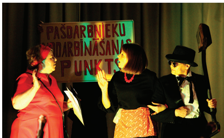
Bārbeles amatierkolektīvos gaidīts ikviens jaunais dalībnieks – pat Kurmis.