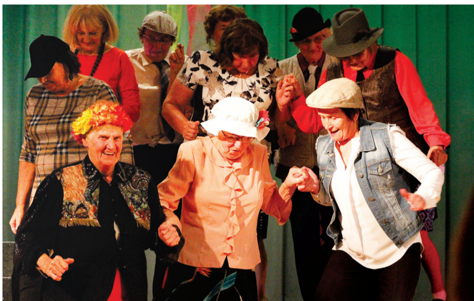
Vecumnieku tautas nama pārstāves bija sagatavojušas veselu deju popūriju.

Ar eksotisku priekšnesumu pārsteidza Kurmenes pašdarbnieki.