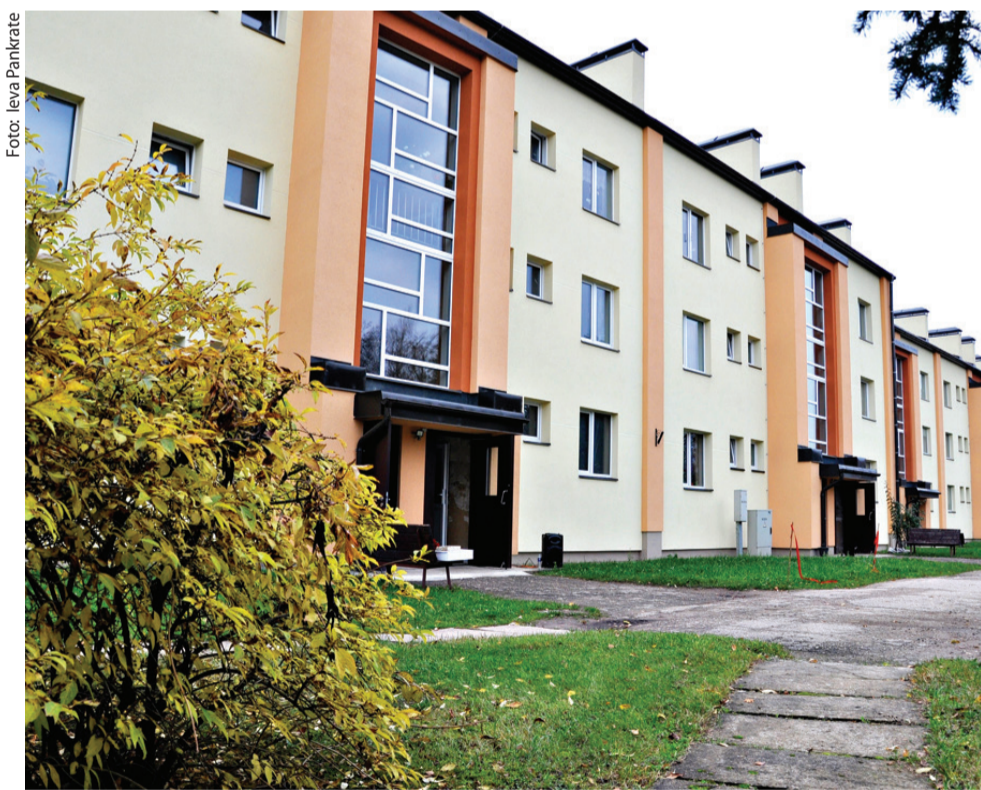
Vecumnieku Rīgas ielas 31 nama iedzīvotāji nu var lepri raudzīties savas jaunās, skaistās mājas virzienā.

Pašvaldības finansējumu daudzdzīvokļu mājas energoefektivitātes pasākumu veikšanai var piešķirt, ja: daudzdzīvokļu mājas kopīpašumā esošās daļas pārvaldīšanai ir izveidota dzīvokļu īpašnieku biedrība (sabiedrība), Civillikumā