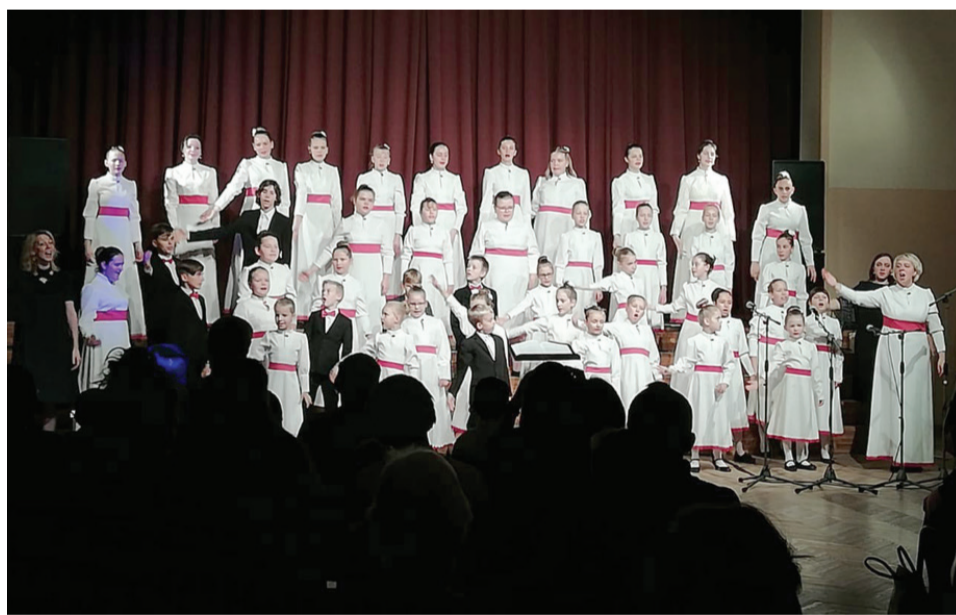
Koncerta skatītāji, kā ierasts, baudīja sirsnīgos un skanīgos koristu priekšnesumus.

19. oktobrī Vecumnieku tautas namā notika sieviešu kora «Via Stella» un Vecumnieku Mūzikas un mākslas skolas bērnu kora «Via Stelliņa» koncerts «Ceļā uz Dziesmusvētkiem».