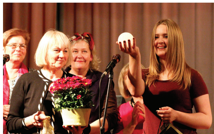
Vallieši katram kultūras darba organizatoram dāvināja simbolisko gaismas nesēju.