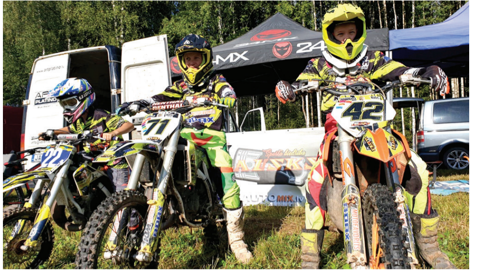
Junie motosportisti veiksmīgi aizvadījuši debijas sezonu.

Vecumnieku novada uzņēmumam SIA «Volente». Ja arī Tev ir interese par motosportu un vēlme pievienoties šiem pušiem, būsi laipni gaidīti Sporta biedrības «Lausks» kolektīvā. Mums līdzi var sekot trases malā vai arī kluba tīmekļvietnē – lausks.mozello.lv