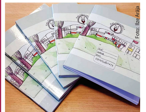
Misas vidusskolas dienasgrāmatas vāka autors ir Markus Miklašēvičs.