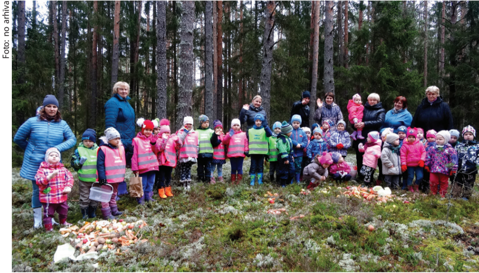
PII «Cielaviņa» bērni kopā ar pedagogiem devās izzināt mežu, vākt dabas materiālu, kā arī atstāt gardumus meža iemītniekiem.

Mežā visi kopā sameklējam vietu, kura būtu vispiemērotākā cienasta izkārtšanai. Bērni ar prieku paši salika savus līdzpaņemtos augļus, dārzeņus. Kad darbs tika izdarīts, bērni ar skolotājiem devās salasīt dabas materiālus, ko vest uz bērnudārzu. Cik tas bija aizraujoši! Ko tik mežā nevar atrast – sūnas, ķērpjus, koka mizas, sēnes, dažādus zarus, lapas un ko tik vēl! Varēja mēģināt ar rokām kokus, nogaršot brūklenes, izpētīt aļņu, stirnu, zaķu pēdas, ieelpot brīnišķīgo meža gaisu, izskrieties pa meža ceļiņ!