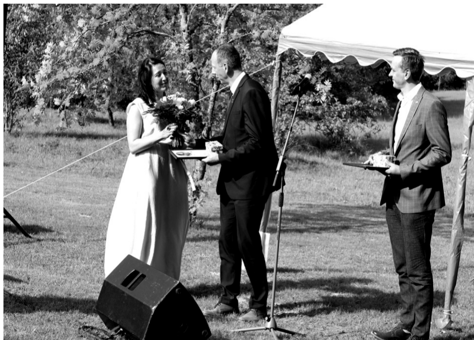
Apbalvojuma pasniegšana Latvijas Nacionālā teātra darbiniekiem un māksliniekiem ir neatņemama svētku sastāvdaļa.

«Man gribas cerēt, ka šis nav pēdējais gads un, ka šeit mēs brauksim vēl un vēl,» runas noslē-