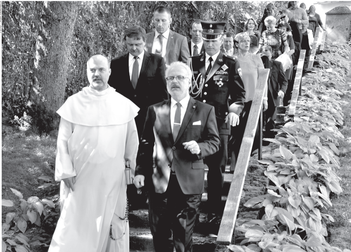
Valsts prezidents iepazīst Skaistkalni mērojot ceļu ar kājām no Skaistkalnes baznīcas uz tautas namu.

Baltijas ceļa 30. gadadienā, 23. augustā, Valsts prezidents Egils Levits reģionālajā darba vizītē viesojās Skaistkalnē.