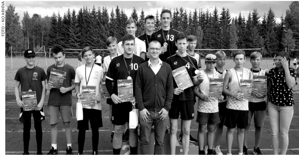
Vecumnieku novada pirmā komanda U15 grupā zēniem, kuri izcīnīja sudraba medaļas.

Vecumnieku sporta skolas paši mazākie volejbolisti Vecumnieku 2 komanda U11 grupā, būdami divus gadus jaunāki par pretiniekiem, izcīnīja