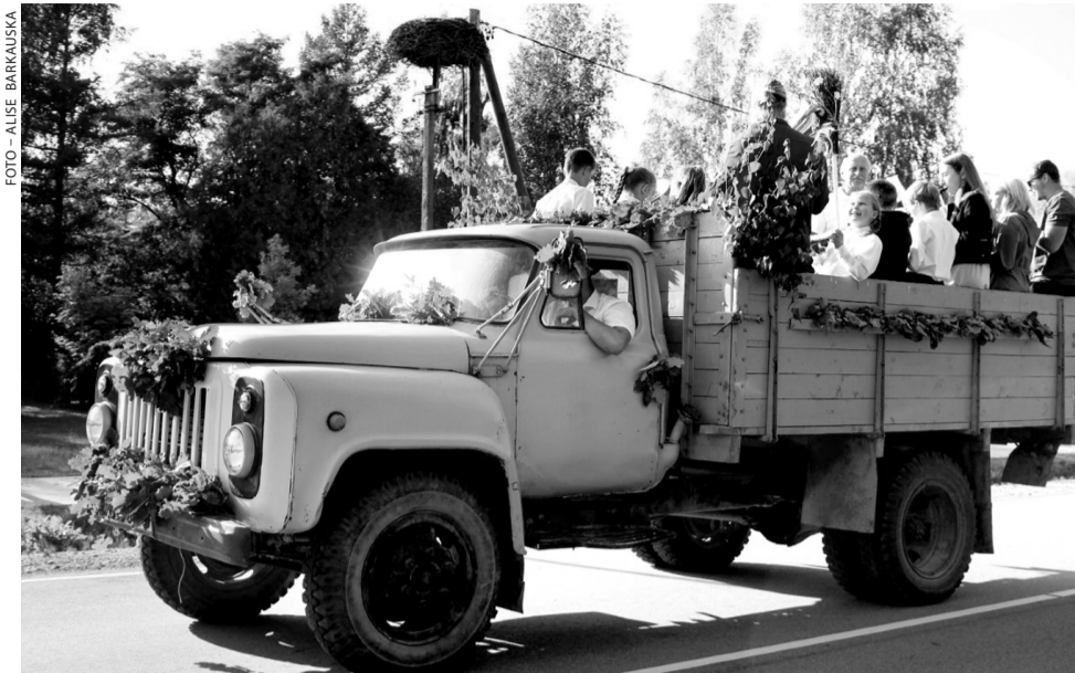
Skaistkalnes pūtēju orķestris parūpējās par gājiena muzikālo pusi.