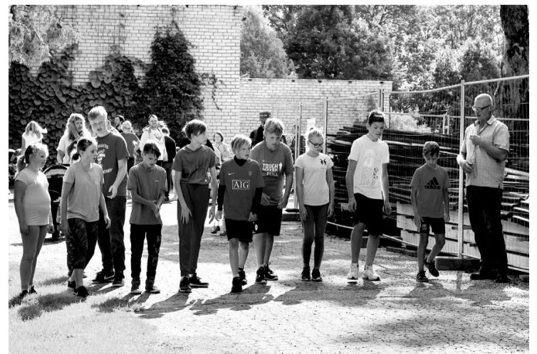
Tradicionālā skrējiena dalībnieki gaida starta signālu.