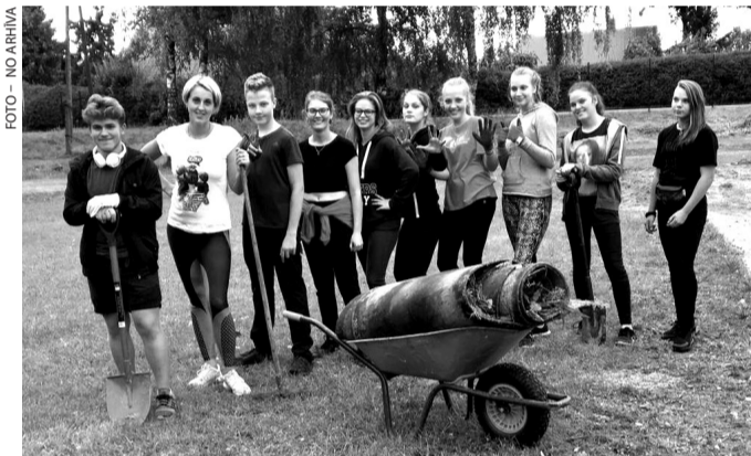
Jaunatnes lietu speciāliste, kopā ar jauniešiem veicot labiekārtošanas darbus.