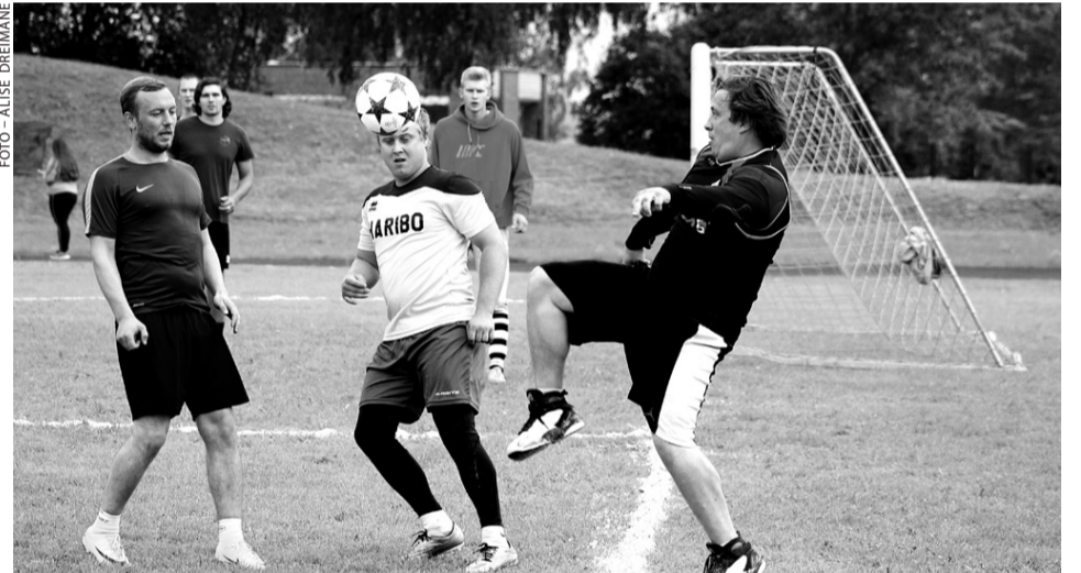
Valles sporta sētkos futbola spēles noslēdzās vien vēlā pēcpusdienā.