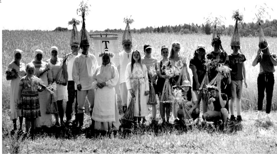
Folkloras kopa «Tīrums» kopā ar Brīvprātīgā darba nometnes dalībniekiem.