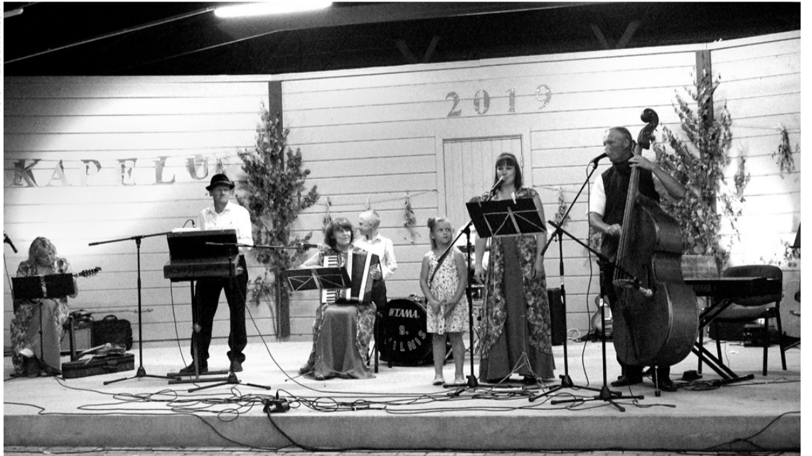
Ciemiņus Bārbelē viesmīlīgi sagaidīja Bārbeles kapela «Savējie», kuri arī noslēdza kapelu saietu.

tavojuši repertuāru, kurā ietilpa arī lietuviešu dziesma, par ko ļoti priecīga bija kapela no Lietuvas.