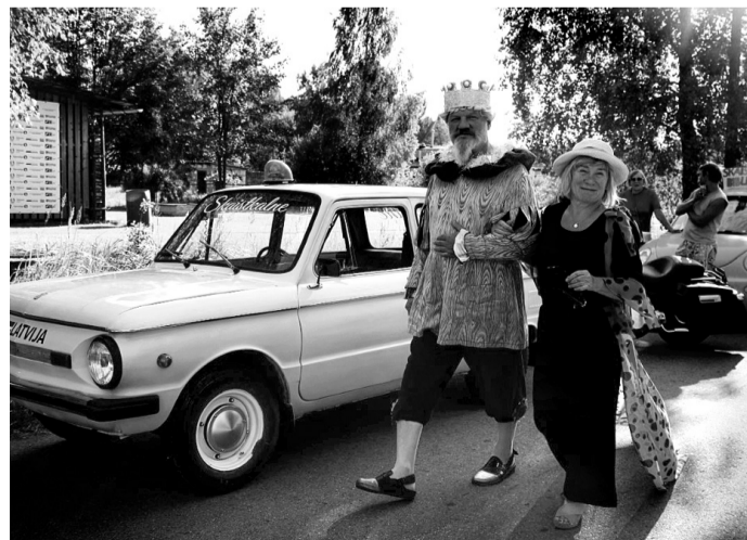
Gājiena dalībnieki bija īpaši pacentušies un gājiens izdevās ļoti krāšņs.