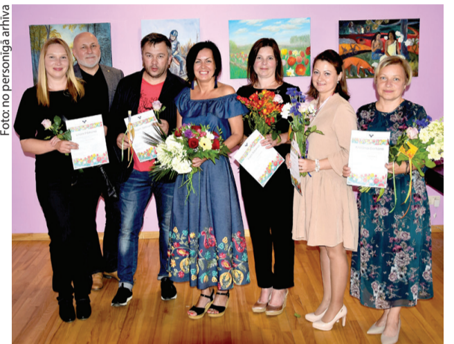
Izstādes darbu autori gandarīti par paveikto.