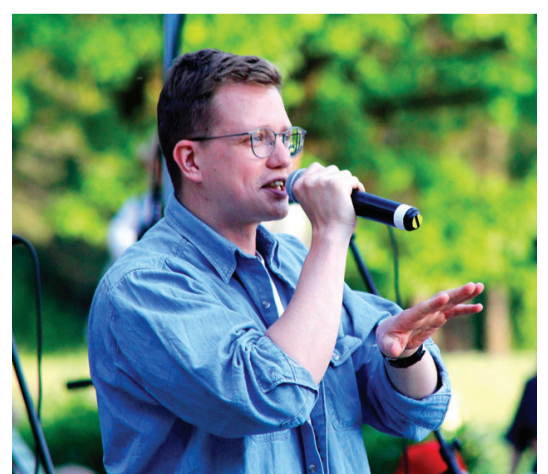
Edavārdi reps piešķīra svētkiem mūsdienīgu pieskaņu.