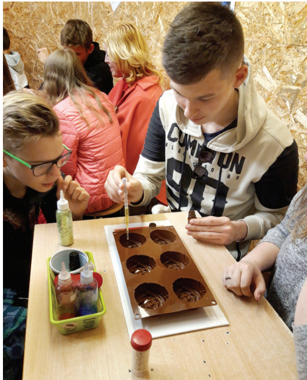
9. klases zēni Baldones observatorijā aizrautīgi darina savas «kosmiskās ziepītes».

stacijā Luna 27, kur plānots ievietot šo taimeris, ir ļoti svārstīga temperatūra.