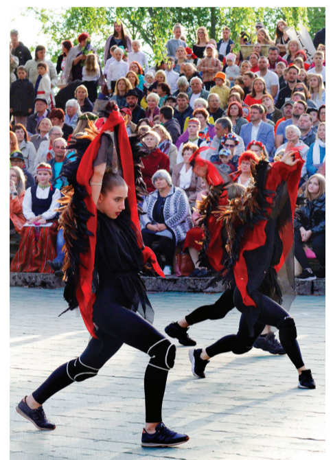
Deju studija «ZForce» no Rīgas pārsteidza ar aizrautīgām dejām.

ĻOTI BŪTISKI, KA ŠĀDI SVĒTKI TIEK ORGANIZĒTI. DALĪBNIKU SVĒTKOS IEPRIECINA SAVU DVĒSELI.