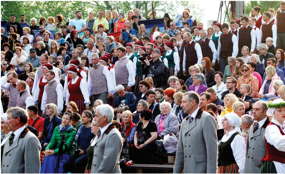
Koncerta dalībnieki no malū malām sanāca uz kopīgiem priekšnesumiem.

Jūnijs Vecumnieku novadā sākās ar lieliem – dziesmām un dejām piepildītiem – 6. Vecumnieku novada Dziesmu un deju svētkiem.