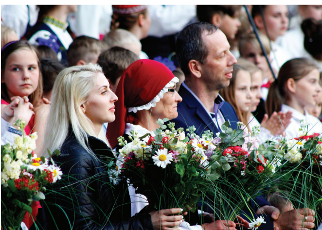
Daļa no svētku radošās komandas.