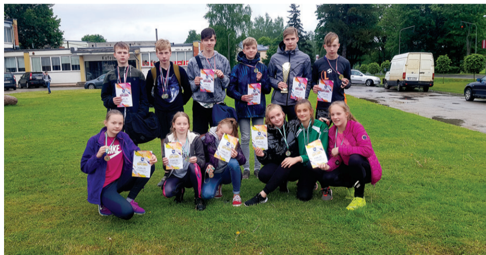
Zemgales reģiona sacensībās vieglatlētikā veiksmīgi startēja Vecumnieku vidusskolas skolēni.

Bauskā 29. maijā norisinājās pēdējās Zemgales reģiona vispārīgslēdzotāju skolu sacensības vieglatlētikā, skolu jaunie vieglatlēti sacentās četrcīņā.