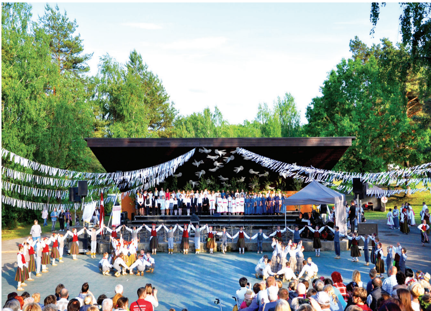
6. Vecumnieku novada Dziesmu un deju svētki apvieno tradicionālo ar mūsdienīgo.

6. Vecumnieku novada Dziesmu un deju svētku producete, Vecumnieku tautas nama vadītāja