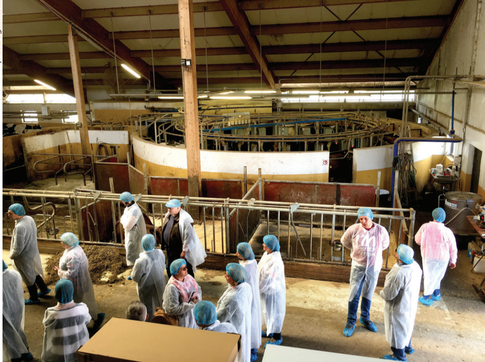
Dažādu paaudžu lauksaimnieki apmaiņas braucienā dalās pieredzē.

Pirmā saimniecība, ko apmeklējām, nodarbojās ar bioloģisko lauksaimniecību un lopkopību. Saimniecībā 160 hektāru platībā tiek audzēti dažādi graudaugi un kartupeļi, kā arī tauriņzieži. Lauku vidējā platība ir 5 – 6 hektāri. Zālāji tiek izmantoti ganībām un skābbarības gatavošanā. Skābbarību gatavo arī no graudaugiem, pupām, zirņiem. To glabā atsevišķās betona tranšejās un, barojot lopus, skābbarības produkti ar atšķirīgu augu sastāvu tiek mikserī samaisīti kopā noteiktās, aprēķinātās proporcijās. Saimnieki mēģina audzēt arī vasaras rapsi, bet ne katru gadu tas izdodas. Rapsis tiek audzēts, lai nodrošinātu lopus ar proteīnu bagātu lopbarību. Paši spiež eļļu un rapša raušus izmanto lopbarībā. Saimniecībā tiek turētas 120 slaucamas govīs un 75 ataudzējamas teles. Govis ganībās pavada 16 stundas un tiek slauktas robotā 2,8 reizes dienā, vidējais izslaukums gadā ir ap 11 000 litri. Ganāmpulkā lielākoties ir Zviedru sarkanraibās un Holšteinas melnraibās govīs, kas piena ražošanai tiek izmantotas 3 – 4 laktācijas. Saimniecībā saimnieko divi brāļi, kuri, mantojot saimniecību ar 70 slaucamām govīm, turpina to attīstīt un modernizēt. Drīzumā paredzēts uz jumtiem ierīkot saules paneļus, lai uzlabotu energoefektivitāti.