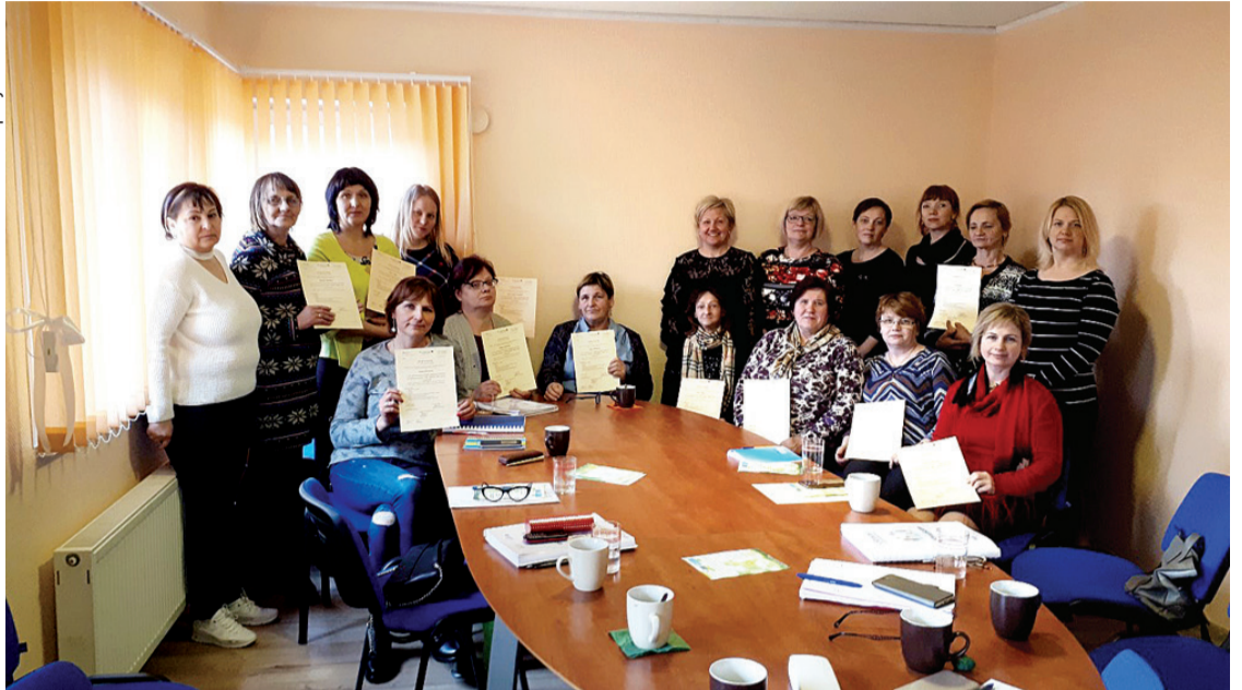
Speciālisti saņēmuši apliecinājumus par profesionālo pilnveidi.

T urpinās Zemgalē dzīvojošo audžuģimeņu, aizbildņu un adoptētāju aptauja par viņu vēlmēm un vajadzībām.