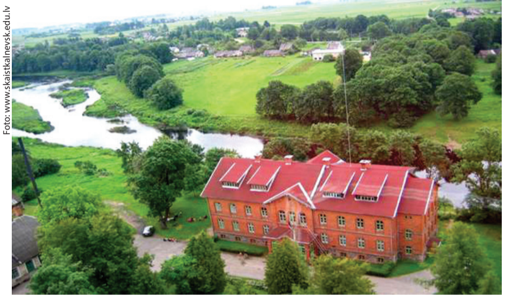
Skaistkalnes vidusskolā skolēniem ir iespēja radoši darboties, realizēt savus talantus un idejas.

Jaunais vidusskolas standarts ir balstīts uz pratībām, kuras ir vairāk nekā tikai zināšanas un prasmes. Tās ietver sevī spēju izpildīt sarežģītus uzdevumus, izmantojot un mobilizējot psiholoģiskos un sociālos resursus, ieskaitot prasmes, attieksmes un vērtības katrā konkrētā kontekstā (OECD, 2018). Jaunā standarta mācības koncentrējas uz to, kas skolēniem ir jāmača darīt, nevis uz to, kas viņiem ir paredzēts mācīties tradicionālo atsevišķu mācību priekšmetu ietvaros. Šāda mācību pieeja ir centrēta uz skolēniem un elastīgi pielāgojama skolēnu, skolotāju un sabiedrības mainīgajām vajadzībām. Tas nozīmē, ka mācību pasākumi un vide ir jāizvēlas tā, lai audzēkņi varētu apgūt un pielietot zināšanas, prasmes un attieksmes situācijās, ar kurām viņi saskaras ikdienā. Mācību saturam jābūt maksimāli tuvinātam reālās dzīves situācijām. Bieži vien cilvēks ir tik ļoti pārņemts ar to, lai visu izdarītu un nesapemtu sodu, neprot apstāties un sev pajautāt – kā es gribu dzīvot? Kā man patīktu vislabāk? Ko es vēlētos? Vai esmu laimīgs? Tikpat svarīgi kā iemācīt savu priekšmetu, katram skolotājam ir svarīgi nodot saviem skolēniem prasmi būt laimīgiem. Lai to izdarītu Skaistkalnes vidusskolas skolotāji apgūst jaunās mācību metodes un ir gatavi sākt strādāt ar jauno standartu.