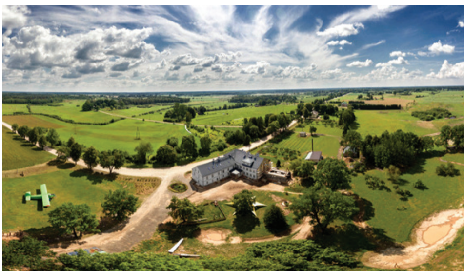
Skats uz skolu no putna lidojuma.

2018. gada septembrī durvis vēra vaļā Bārbeles zēnu pamatskola «Saknes un Spārni», kas ir unikāla, jo piedāvā līdz šim vēl nebijušu mācību procesu Latvijā.