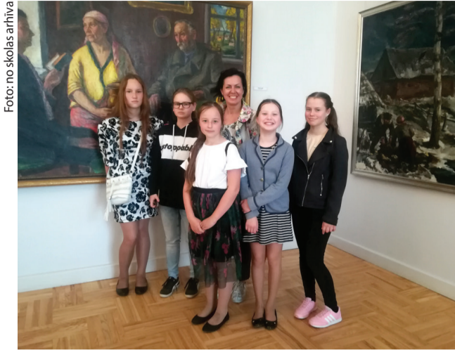
Laureātes un skolotāja apbalvošanas pasākumā Jelgavā.