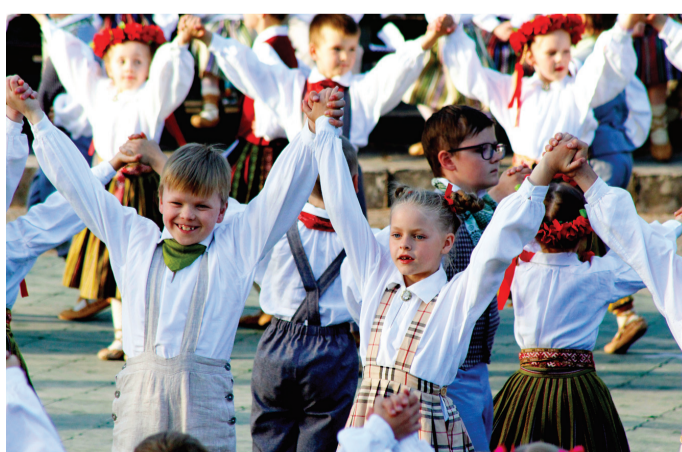
Pirmo reizi novada Dziesmu un deju svētkos piedalījās arī pirmsskolu tautas deju kolektīvi.