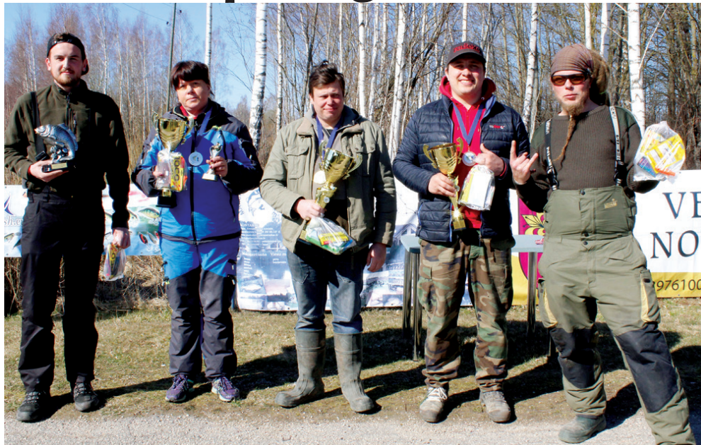
Veiksmīgākie sacensību spinningotāji.