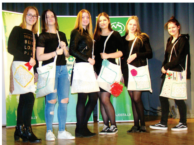
Skaistkalnes vidusskolas 9. klases jaunietes ar pašdarinātajiem iepirkuma maisiņiem.

Nākamais solis mūsu plāna realizēšanai ir iepirkuma plastmasas maisiņu krāšana. Doma pavisam vienkārša – ja nevar un negrib izmantot maisiņu otrreiz iepirkumiem, tad izmantojam rokdarbos. Grie-