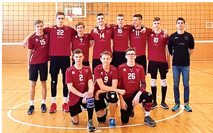
Veiksmīgi aizvadītas Latvijas jaunatnes fināla sacensības U-16 grupā jauniešiem.

Vecumnieku novada Domes sporta skolas volejbola