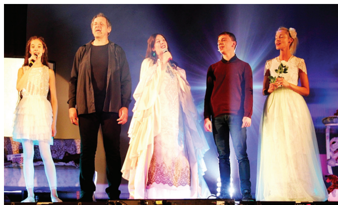
Izrādes galvenie varoņi aizkustināja ikvienu.