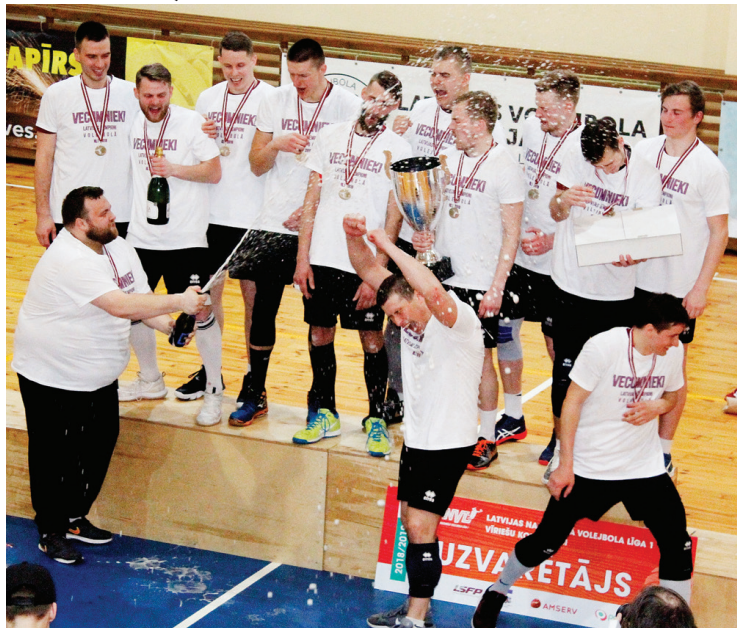
Tradicionālais šampanietis uzvarētājiem.