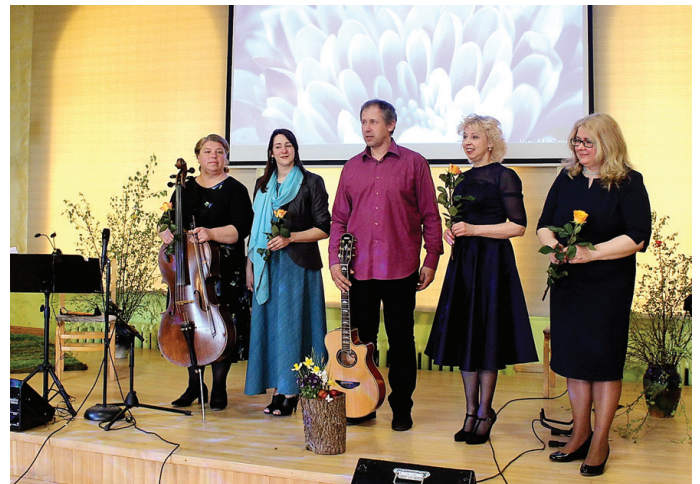
Grupa «Lux Sonus» priecēja ar dziļām dziesmām un lika aizdomāties par drosmi.

Sandra Neliusa, Stelpes kultūras dzīves organizatore