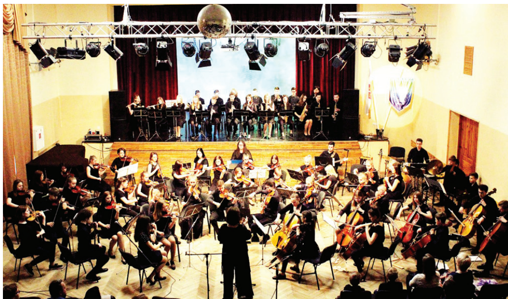
Kuplā pulkā svinēja orķestra 20 gadu jubileju.

Ar skanīgu un svinīgu koncertu Vecumnieku tautas namā 22. aprīlī notika jauniešu simfoniskā orķestra «Draugi» 20 gadu jubilejas koncerts. Šis koncerts bija kā labs Lieldienu brīvdienų noslēgums, kas klausītājiem sagādāja dažādu emociju gammu.