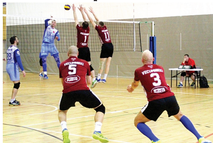
Vecumnieku senioru volejbola komanda, cīnoties par uzvarām.

Nedēļas nogalē Vecumnieku Nacionālās līgas komanda guva vēsturisku panākumu, uzvarot Latvijas čempionātā volejbolā, bet šī pasākuma ēnā savu dalību Latvijas čempionāta pamatturnīrā beidza arī Vecumnieku veterānu komanda.