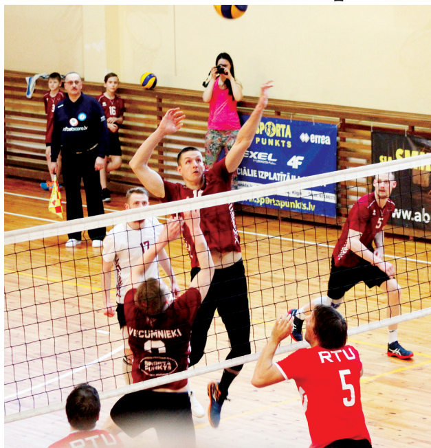
Veiksmīgu uzbrukumu izpilda Vecumnieku volejbolisti.