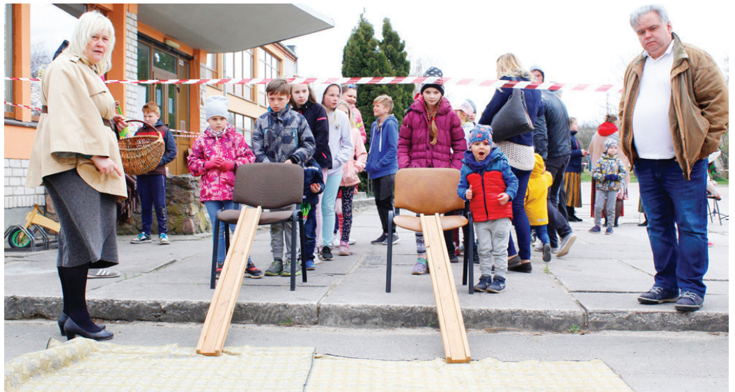
Visgaidītākā aktivitāte Misā bija olu ripināšana.