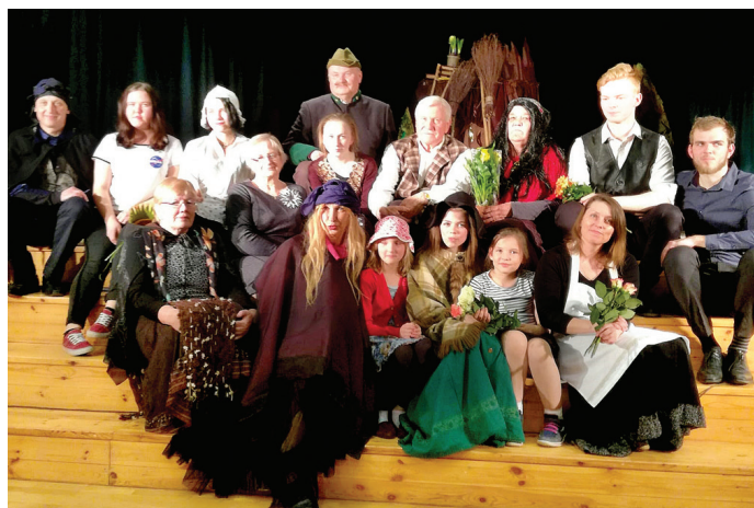
Amatierteātris «Kurmene» ar pirmizrādi uzstājās uz savas skatuves.

Sarmīte Kīse, Kurmenes tautas nama vadītāja