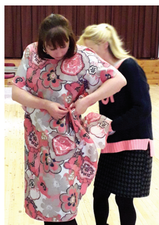
Meistarklases laikā levas Meidīnas tapusi tunika.

25 gadu profesionālo pieredzi, veidojusi vairākas kolekcijas, izstrādājusi dizainu Latvijas Olimpiskajai delegācijai Londonā 2012. gadā, radījusi formas un darba apģērbu dizainu VAS «Starptautiskā lidosta «Rīga»», VAS «Latvenergo»,