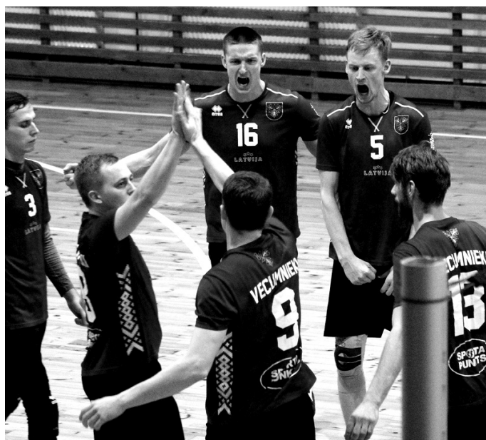
Volejbolisti emocionāli aizvada katru spēli.

Abu komandu otrajā izslēgšanas turnīra spēlē aina bija pavisam cita. Liela atdeve laukumā no abu komandu spēlētājiem, nevienai no komandām