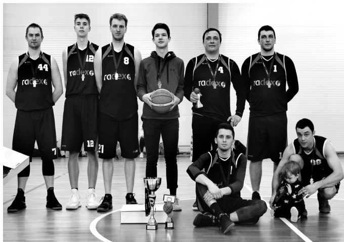
Čempionāta uzvarētāji – komanda «Misa».