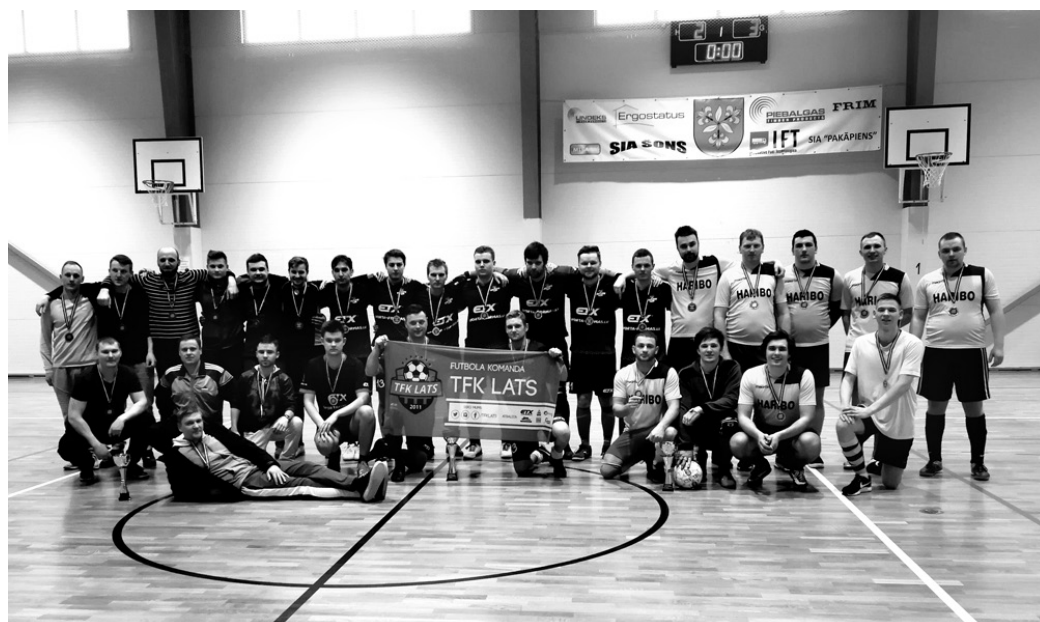
Vecumnieku novada atklātā čempionāta 2019 godalgoto vietu ieguvēji.

Spēlē par trešo vietu tikās komandas «Vecumnieki» un