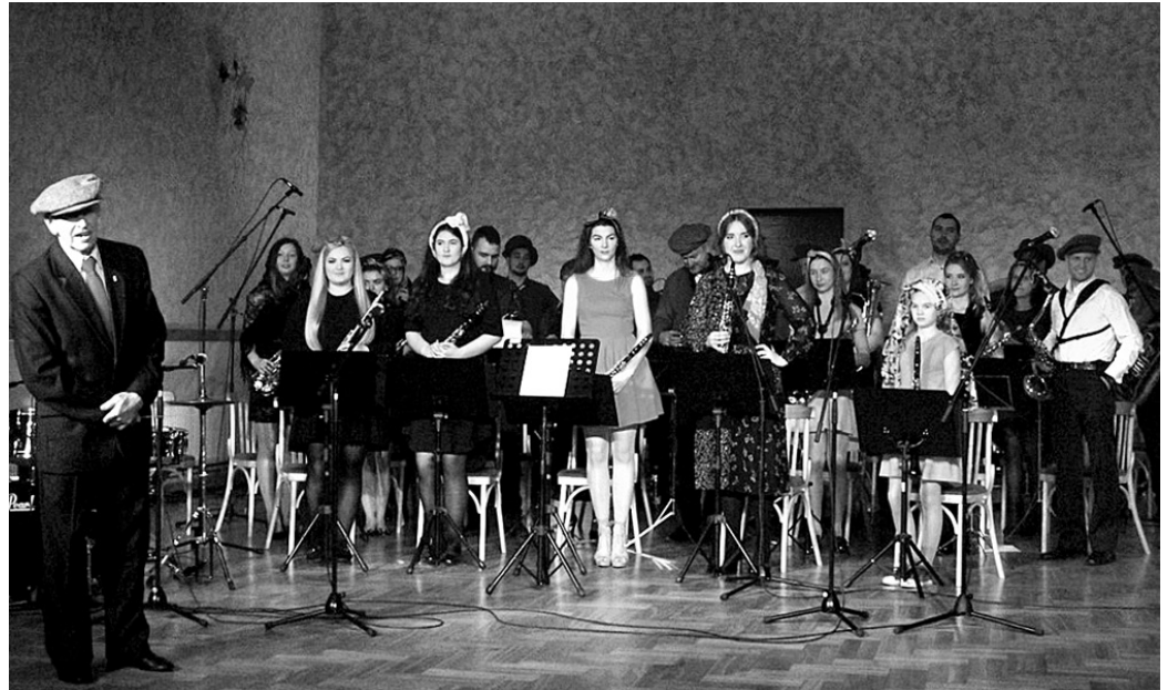
Pūtēju orķestra 15 gadu jubileju nosvinēja muzikālā un pozitīvā gaisotnē.

Orķestris 15 gados ir piedzējis daudz. Tas ir kā viena liela ģimene, kopā iets roku rokā koncertos, lielos svētkos, piemēram, Dziesmu svētkos, kuriem gatavošanās prasa lielu atbildību un laiku. Kopīgi ir sastrādāti dažādi nedarbi, par kuriem visspilgtāk varētu pastāstīt trompešu spēlētāji. Šajos kopības gados orķestris ir iemīļojis vairākus skaņdarbus,