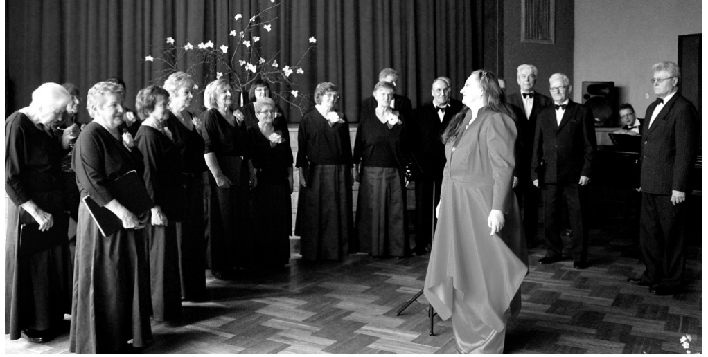
I pakāpi ansambļu skatē ieguva arī Vecumnieku tautas nama senioru jauktais koris «Atbalss».

Dodoties uz Misas tautas namu 9. martā, bija dzirdama putnu čivināšana. IZRĀDĀS, ka pēdējās dienās pār Misu ir lidojušas dzērves, zosis un gulbji. Tas nozīmē, ka pavasaris ir klāt!