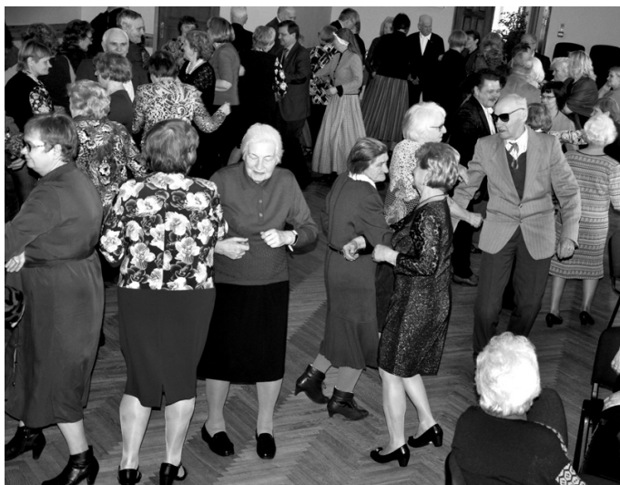
Seniori lustīgi izdejojot latviskos dančus.