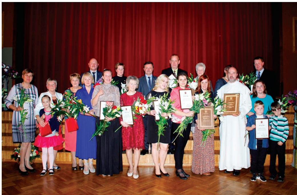
Sumināti «Sakoptākā īpašuma 2018» dalībnieki.

Bārbelē Doktorāta ielas 2 māja sagaidīja ar skaistu ziedu dārzu. Rīgas ielas 7. mājas