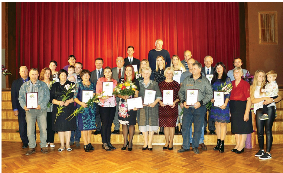
«Iedzīvotāji veido savu vidi 2018» projekta dalībnieki gandarīti par paveikto.