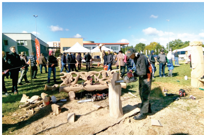
Meistari koka skulptūras radīja izstādes apmeklētāju acu priekšā.

No Vecumnieku novada uz Lietuvas izstādi brauca 50 cilvēki, paldies visiem par atsaucību un lielo interesi. Atvainojos tiem, kas nevarēja doties braucienā, jo vietu skaits auto-