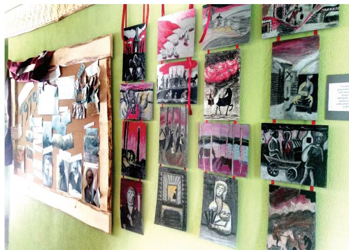
Simtgades notikumi bagātināja mācību saturu.

Projekts «100 gadu 100 dienās» ir pedagogu iniciatīva, viņi ar valsts vēsturi saistī-