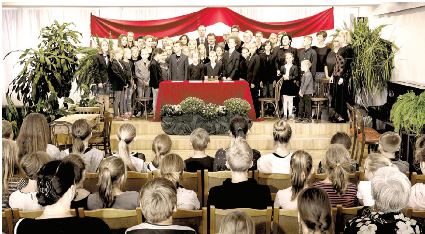
Simboliskā Latvijas valsts proklamēšanas aina iedzīvināta ar novadnieku līdzdalību.

○ Valsts 100 gadus 100 dienās izdzīvo Mūzikas un mākslas skolā