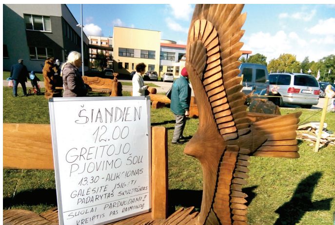
Izstādes gaitā tapušie koka darbi bija iegādājami izsolē.

○ Lietuvas forumā iepazīst lauksaimniecības jomas jaunumus