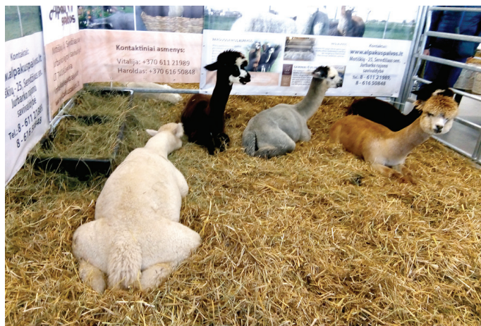
Forumā bija apskatāmi dažādi lauksaimniecības dzīvnieki.

Braucieni uz Lietuvas izstādi šoruden rīkojam, lai dažādotu novada lauksaimnieku iespējas iepazīt nozares jaunumus līdztekus tradicionālajai Latvijas izstādei Rānavā. Tā kā iegūvām informāciju, ka pavasarī šī izstāde Lietuvā ir vēl plašāka, apsveram iespēju plānot līdzīgu braucieni pēc pusgada.