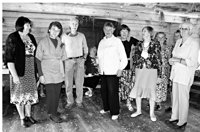
Novada seniori tikšanās pagastos cer veidot par tradīciju.