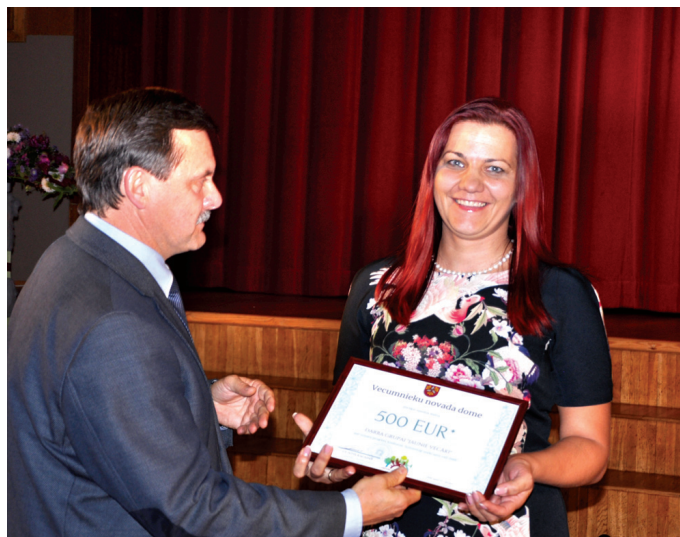
Savas ieceres papildinās grupa «Jaunie vecāki».

Sertifikātus par sekmīgi pabeigtiem projektiem saņē-