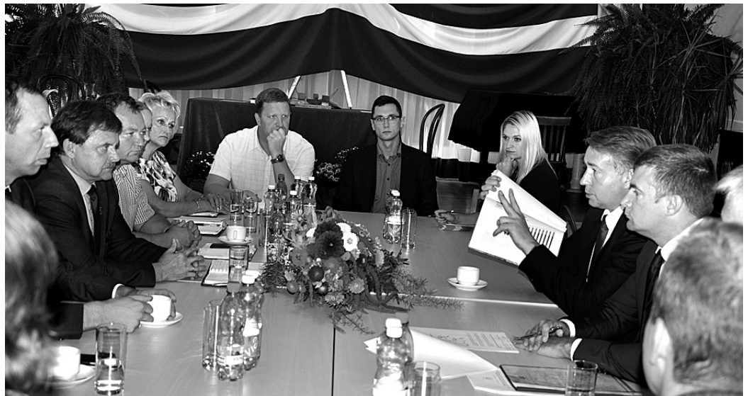
Vecumnieku pašvaldības amatpersonas Satiksmes ministrijas un ceļu uzturēšanas institūciju pārstāvjus iztaujāja par konkrētiem darbiem novadā.

Pašvaldība pēc Vecumniekos uzstādītā radara pozitīvā efekta aicina tādu uzstādīt arī Bārbelē vai Skaistkalnē, kam LVC vadība neiebilda. Pašvaldības pārstāvji izklāstīja problēmu ar smago transportu no Lietuvas, kas Latvijā iebrauc, visticamāk, pārsniedzot pie-