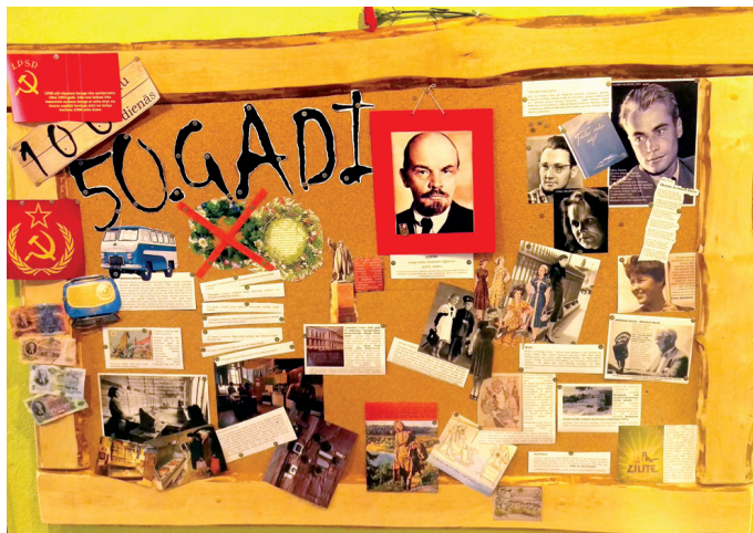
Ziņojumu dēļa materiālam izmantoti digitālās bibliotēkas «Lettonica» vietnes «Zudusī Latvija» un žurnāla «lr» materiāli.