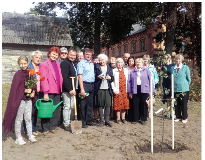
Kopīgi iestādītais kociņš priecēja ikvienu akcijas dalībnieku.

Rita Kovala, Vecumnieku pagasta muzeja vadītāja