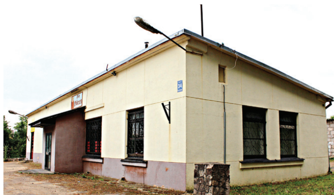
Ēkā Rīgas ielā 34 iecerēts atvērt tūrisma informācijas punktu.

rādīja, ka projektu atlikšana nebūtu laba zīme par domes lemtspēju, ja tā nespēj pabeigt sāktos darbus. Savukārt G. Kalniņš uzsvēra, ka valsts finansētā KAC ierīkošana var kalpot par novada pastāvēšanas garantiju. Pašlaik reģionos izveidoti teju 100 šādi centri, bet tiem novadiem, kuros valsts pakalpoju-