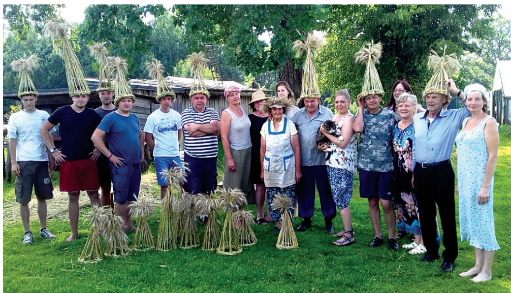
Rudzu stiebru cepures selekcionāru Viņķeļu tīrumā darināja starptautiska komanda.

Līdz ar folkloristiem tīrumā darbojās jaunieši no biedrības «Jaunatne smaidam», viņu vidū – divi ārvalstu brīvprātī-