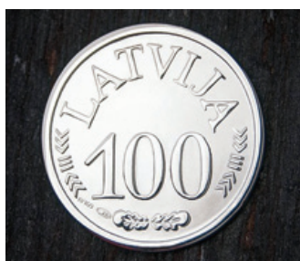
Simtgades bērniem dāvināmais vērdušs un dekoratīvā ozolkoka kastīte.

Ozolkoka kastīte rotāta ar projekta «Simtgades bērni» lo-