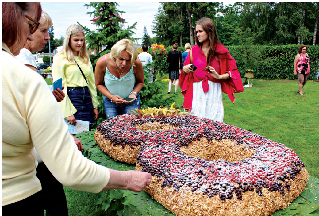
Komandas «Eziši» darinātais dekors pievilka gan apmeklētāju, gan saldumu kārotāju kukaiņu uzmanību.

Liliju svētku otrajā dienā Vecumnieku izgaršošana sākās, tērpojoties skaistos 20. – 30. gadu stila tērpos, piemeklējot velosipēdus un citus aksesuārus, lai dotos otrajā Tvida velobraucienā. Ikvienu pietura nesteidzīgi izbaudītajā maršrutā atklāja jaunu vietējo talantu un ļāva