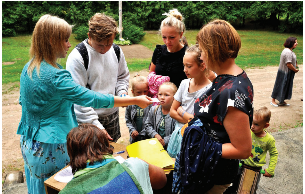
Komandas no Janas Justes (no kreisās) saņēma uzdevumus, kas ļāva daudz uzzināt par Vecumnieku vēsturi.

Pirms sākt kontrolpunktu medības Vecumnieku centrā, katrs dalībnieks saņēma lapu ar fotogrāfijām – dažādu ēku un objektu detaļas, kuras bija jānoteic un jāatrod, lai saņemtu zīmogu par uzdevuma izpildi. Pusotras stundas laikā bija jāapmeklē 11 Vecumnieku nozīmīgākās vietas. Kontrolpunktos darbojās brīvprātīgie – vietējie jaunieši.