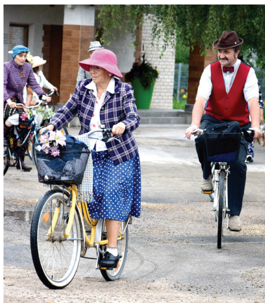
Tvīda braucienā var izrādīt smalkus tērpus.