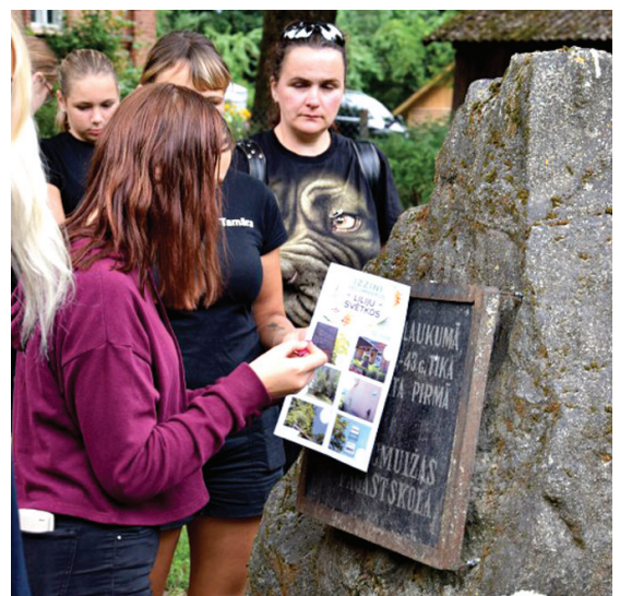
Atrastie objekti ļāva citādi paskatīties uz dzimto ciematu.