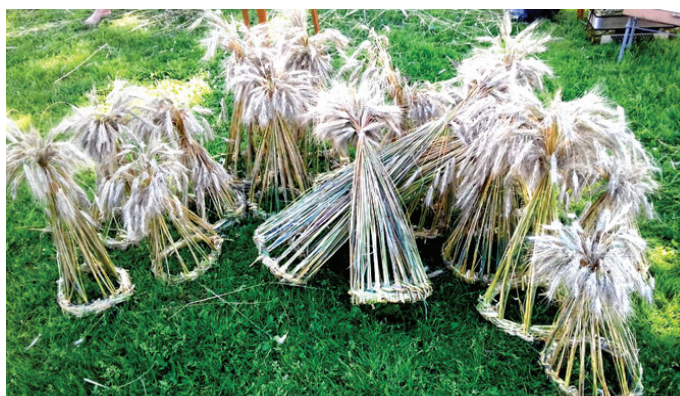
Cepures pa ziemu glabās un pirms budēļu gājiena izrotās ar sarkanām lentītēm.

Cepures izdevušās visiem dalībniekiem, jo ikviens strādāja ar patiesu aizrautību. Arī abi ārvalstu jaunieši katrs izveidoja divas cepures. Viens no pušiem pat izdomāja savu pīšanas