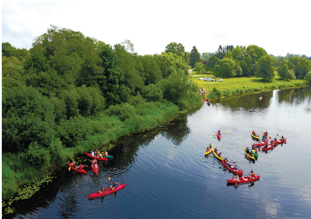
Laivotāji Mēmeles upē, kas savieno kaimiņus Latvijā un Lietuvā.

Brauciena dalībnieki saņēma foto orientēšanās uzdevumus, kurus pildot, laivotāji bija aicināti izkāpt visās atpūtas vietās Latvijā un kaimiņu zemē, gan nobaudot vietējo mājražotāju sagādātos lauku labumus, gan priecājoties par muzikantu skanīgajiem priekšnesumiem.