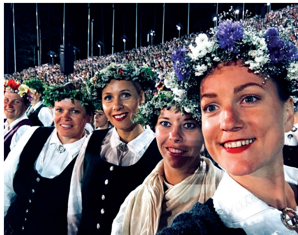
Vecumnieku dziedātājas Lielajā estrādē.