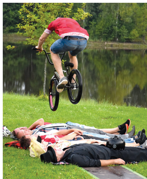
Ekstrēmie velobraucēji priecēja ar aizraujošiem trikiem.