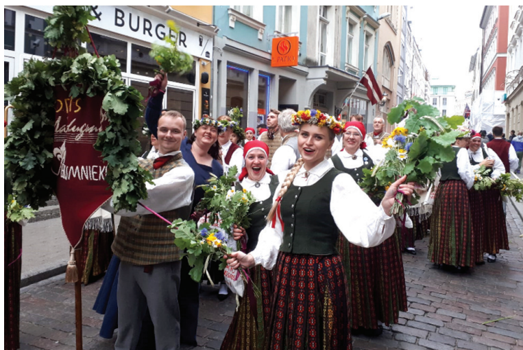
Koris «Maldugunis» svētku gājienā.

○ Jauktā kora «Maldugunis» gaitas Dziesmu svētkos