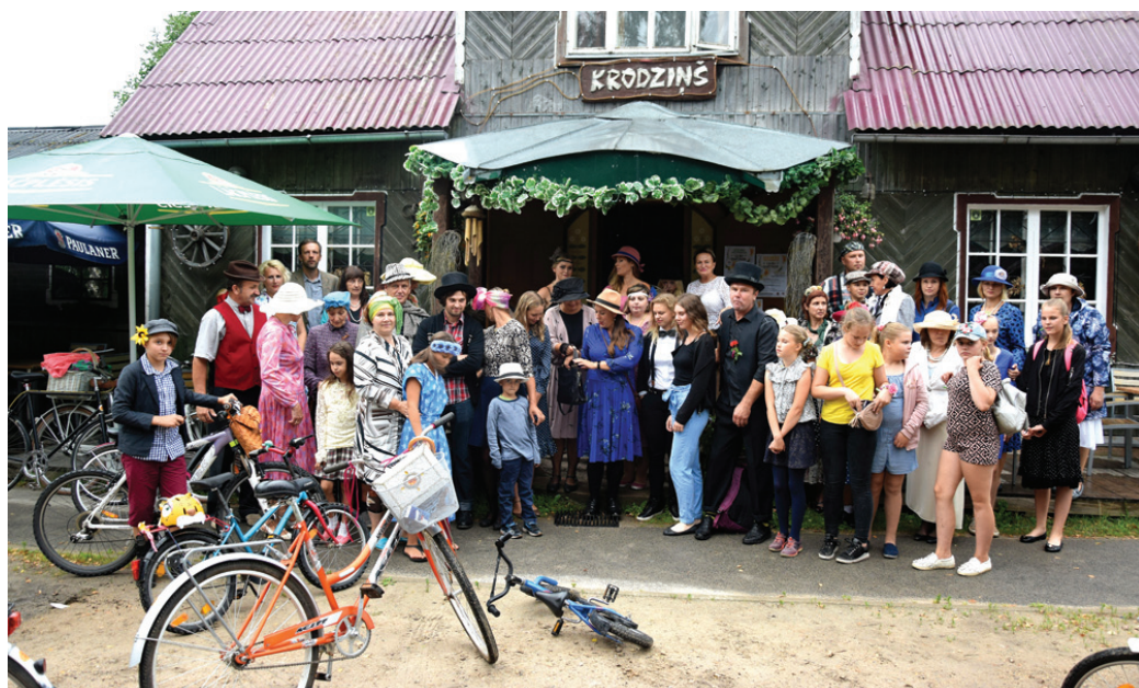
Brauciena dalībniekus silti uzņēma un pamiloja vairākas ciema saimnieces.