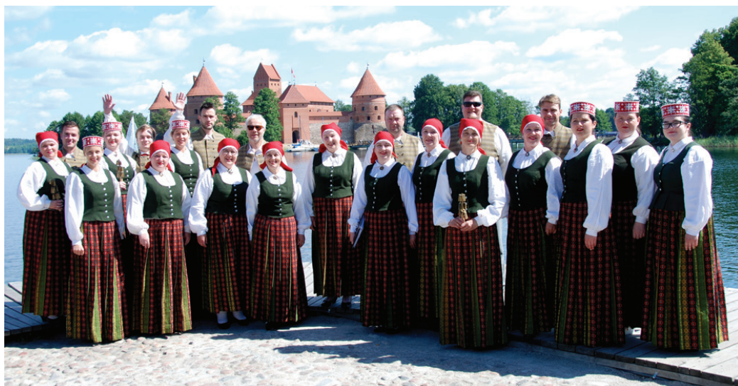
Vecumnieku koristi festivālā «Dziedam Viļņai».

Atklāšanas koncertā koris atskaņoja trīs latviešu tautasdziesmu apdares un divus skaņdarbus no sakrālās mūzikas repertuāra. Kora uzstāšanos bagātināja trejdeksni, lietuskoks, klavieru pavadījums un solistu balsis.