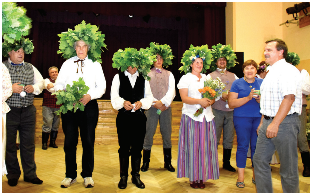
Saulgriežu spēka dziesmas uzmundrināja ikvienu arī tautas nama zālē.

Kaut arī amatieru kolektīvu uzstāšanos lietus dēļ pārcēlām uz tautas nama lielo zāli,