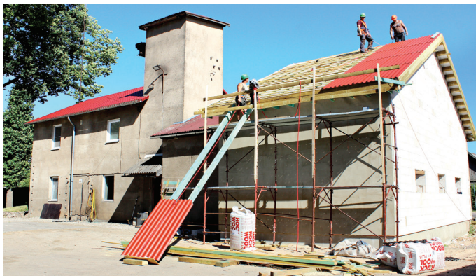
Ugunsdzēsēju depo jaunā autonomvietnē jūnija otrajā pusē tāpa straujā tempā.

Darbi iepriekš kavējušies. «Traucēja laikapstākļi pavasarī, kuru dēļ bija vajadzīga teh-