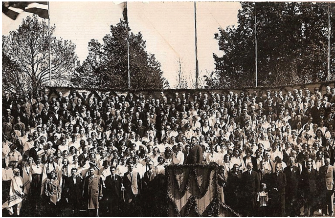
Bauskas apriņķa dziesmu svētku kopkoris Teodora Reitera vadībā

○ Skaistkalnes vēsturē dziesmu svētkiem īpaša vieta