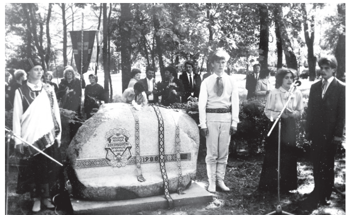
Piemīnas akmens atklāšana 1988. gada 29. maijā Skaistkalnes vidusskolas parkā.

Lielajam notikumam par godu ciemata ielas, kur bija plānots gājiens, tika asfaltētas. Segumu uzlika teritorijai ap skolu un celiņiem parkā. Pedagoģe atminas, ka pirms tam nelielais ceļa posms no skolas līdz ēdnīcai bijis dubļu un peļķu klāts. Viņa lēš, ka labiekārtošana izmaksājusi gana daudz.