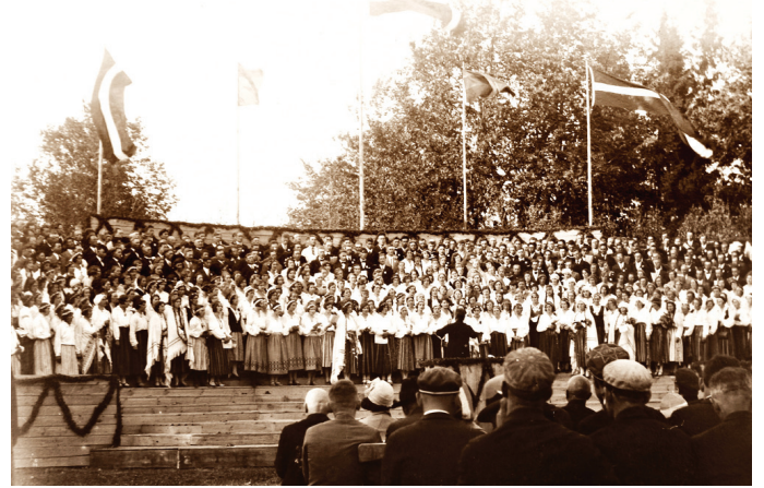
Skaistkalnes sešklasīgās pamatskolas laukumā 1933. gada 5. jūnijā.

Dziesmu un deju svētku tradīcijai Skaistkalnē šogad aprit 85 gadi.