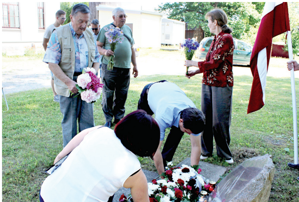
Ziedi deportācijās cietušajiem pie piemiņas akmens dzelzceļa stacijā.

Deportācijas 1941. gadā galvenokārt tika vērstas pret cilvēkiem, kuri agrākās nodarbošanās, sociālā un ekonomiskā stāvokļa dēļ pēc formālām pazīmēm tika uzskatīti par okupācijas režīmam neuzticamiem un bīstamiem. Deportācijai bija pakļauti viņu ģimenes locekļi, neņemot vērā ne vecumu, ne dzimumu. Faktiski vienā dienā tika iznīcināts Latvijas