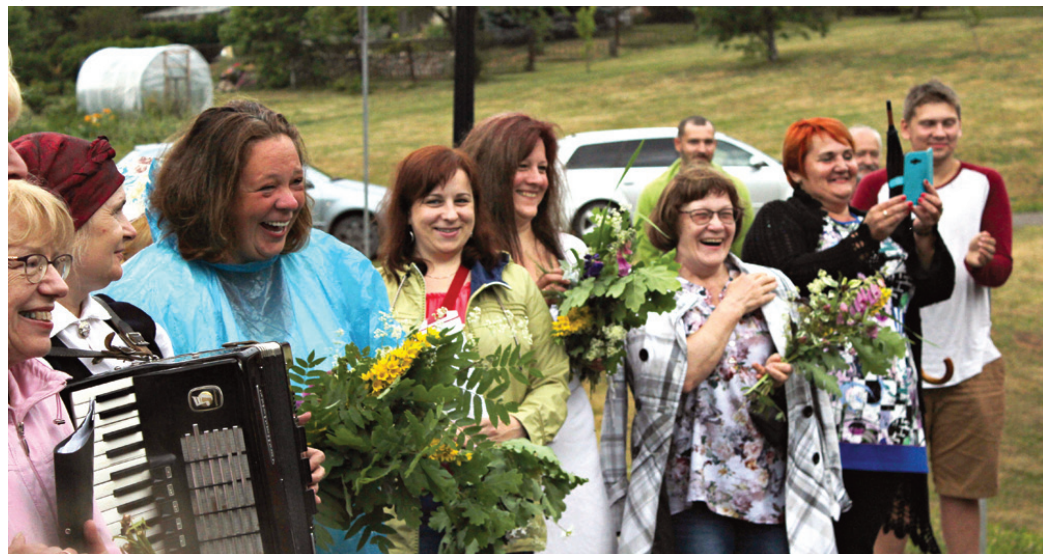
Skaistkalnieši liksmu noskaņojumu uzturēja visu saulgrīžu vakaru un aiznesa līdzī uz mājām.