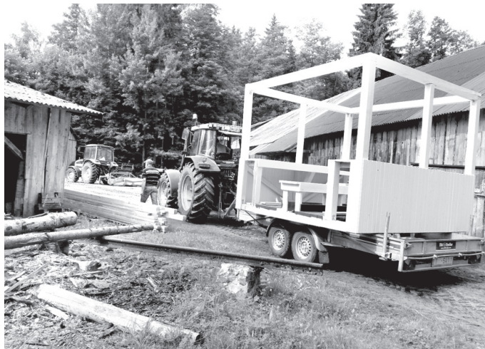
Tirgus mājiņas karkass no z/s «Bogdani» ceļā uz Misas centru.

Iegūto naudas balvu VUB izlietos, turpinot uzlabot Misas tirgus laukumu, ap jauno mājiņu pašrocīgi ierīkojot atpūtas zonu ar guļbūves tipa koka soliēm, pastāstīja Z. Alekšūns.