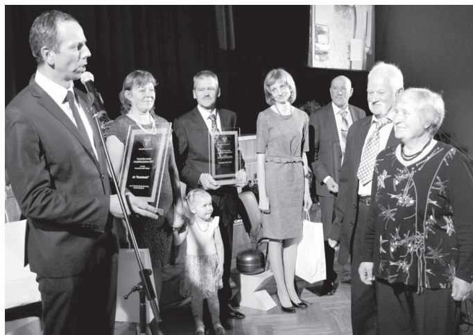
Apbalvojumu «Novada odziņa» saņem z/s «Grantskalni» saimnieki. Fonā konkursa laureāti «Ausekļu dzirnavas» un «Bogdani».