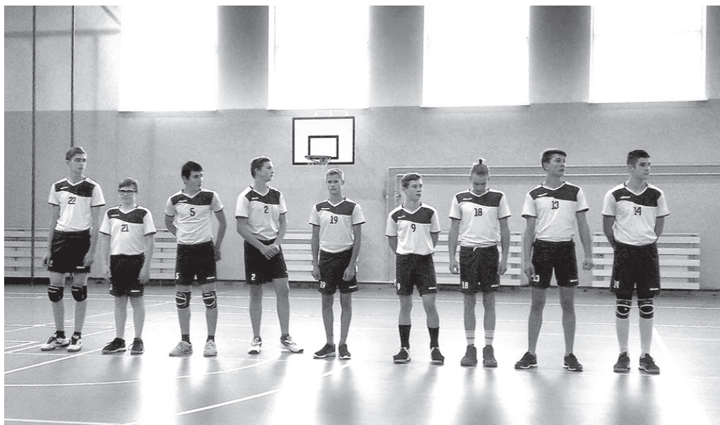
U17 komanda Latvijas kausa pirmajā posmā Cēsīs pirms spēles.

U17 zēni kausa finālposmā sacentīsies 2. finālgrupā, U16 meitenes sacentīsies 4. finālgrupā, U13 zēni finālposmā spēlēs 1. finālgrupā un ir vieni no pretendentiem uz medaļām, tikmēr U15 zēni priekšsacīkstes aizvadīja Kuldīgā, kur uzdevums bija radīt saturīgu sniegumu, lai pacīnītos par augstām vietām.