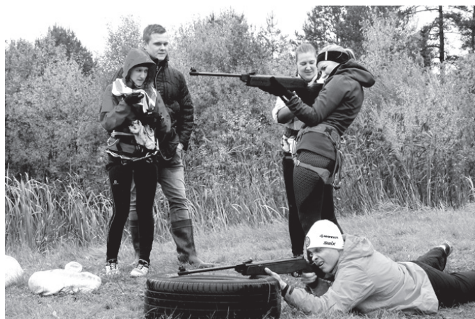
Militarizētā šķēršļu josla, kuras pirmais uzdevums – šaušana mērķī.