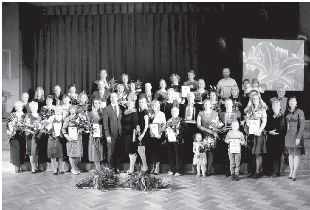
Konkursa «Sakoptākais īpašums» un «Iedzīvotāji veido savu vidi» 2017. gada dalībnieki.