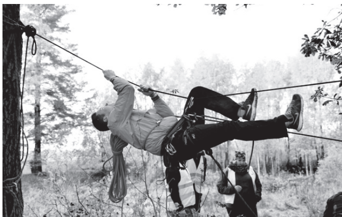
Pirmais nosprīgo virvi pārējiem komandas biedriem.

14. oktobris bija lietaina diena, tāpēc to var uzskatīt par izaicinājumu ne tikai sportistiem, bet arī tiesnešiem – Misas vidusskolas skolēniem un absolventiem. Dalībnieki devās pārgājienā, kura kontrolaiks vecākajām grupām bija 11 stundas (jāveic 31 km un 14 dažādi uzdevumi), vidējai grupai – 10 stundas (24 km un 12 uzdevumi), bet jaunākajai un sākumskolas grupām – 8 stundas (attieciģi 17 un 13 km). Pēdējā komanda no meža iznāca vēl vakarā plkst. 23.30.