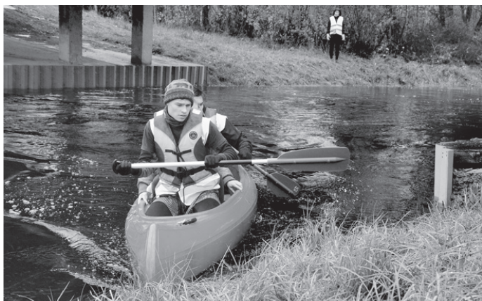
Dalībnieku prasmes pārceļties pāri upei pārbaudīja straujā Misā.

○ Aizritējušās sacensības «Rudens kauss» Misas – Iecavas mežos