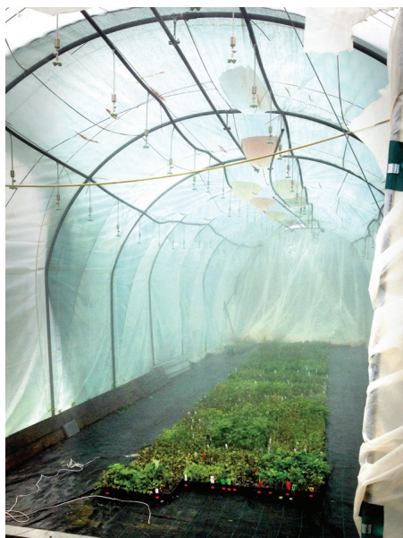
Stādu audzēšana tuneļos.