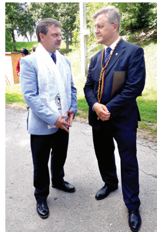
Abu pašvaldību galvenie.