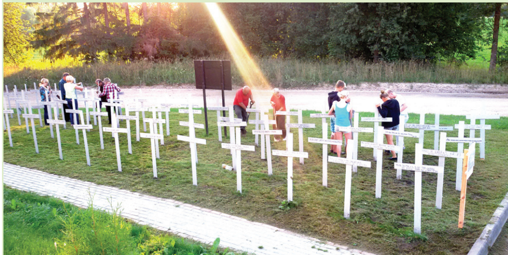
Vakara saules apspīdētā krustu uzstādīšana ar baznīcas palīgiem.