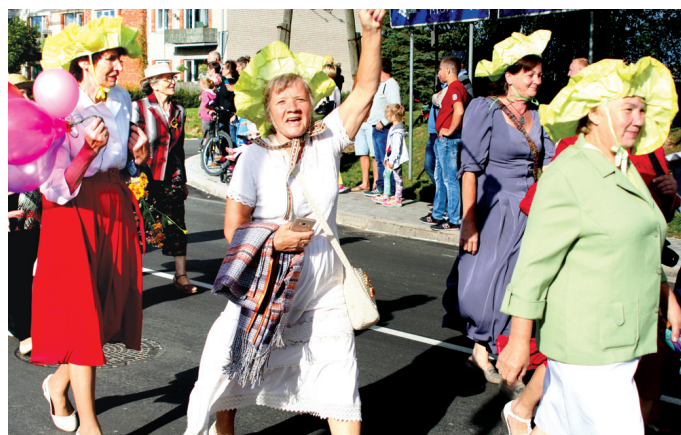
«Mēs neesam gailenes, mums skaistas cepures!» – sauc Skaistkalnes lauku sieviesu klubs «Mēmelīte».