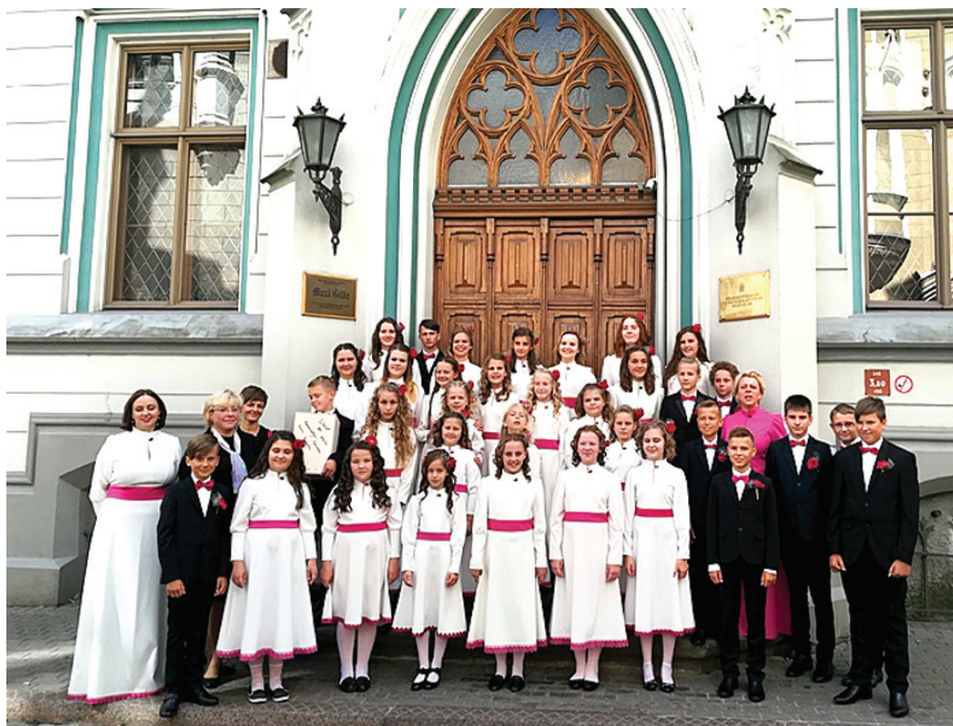
Koristi tikko pēc konkursa, gandarīti par dziedājumu.

Sestdien, 22. jūlijā, koristi pulcējās uz kārtējo mēģinājumu, bet nu jau ar daudz lielāku atbildības un pienākuma sajūtu. Lai cīnītos par medaļām, kuriem bija jādzied piecas dziesmas, no kurām trīs – a capella (bez pavadijuma). Un tas ir ļoti nopietni, vajadzīga milzīga koncentrēšanās un izturība.