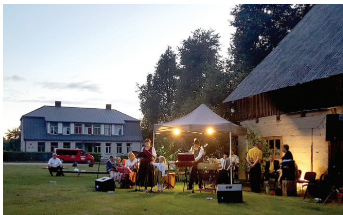
Kamēr notiek estrādes rekonstrukcija, kapelas pulcējas tautas nama pagalmā.