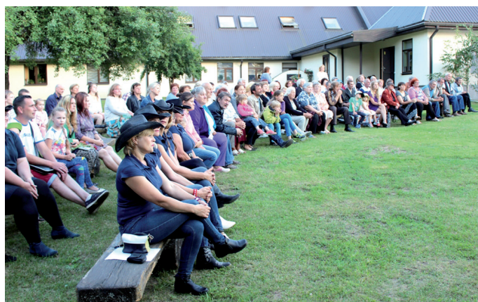
Savu uznaicienu kuplajās skatītāju rindās gaida līnijdejojotājas.

29. jūlija pievakarē Bārbelē pirmo reizi notika lauku kapelu saiets, kura laikā aiz tautas nama pulcējās kupls ļaužu pulks, lai baudītu muzikālo apvienību koncertu. Satikšanos rīkoja Bārbeles tautas nama kapela «Savējie».