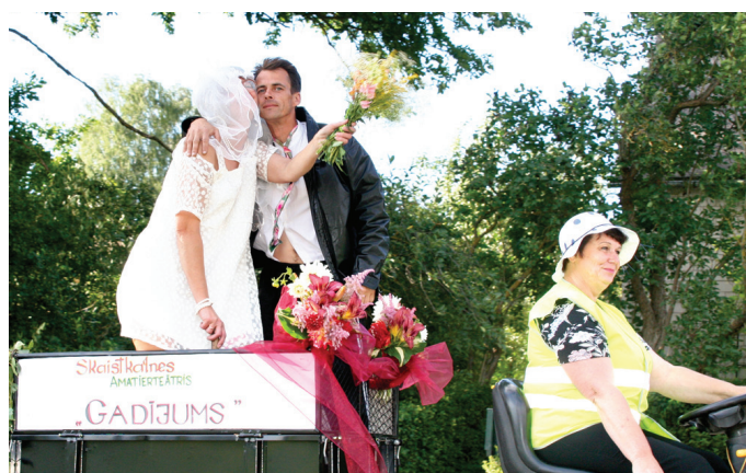
Pat traktora piekabē amatierteātris «Gadījums» jūtas kā uz skatuves.