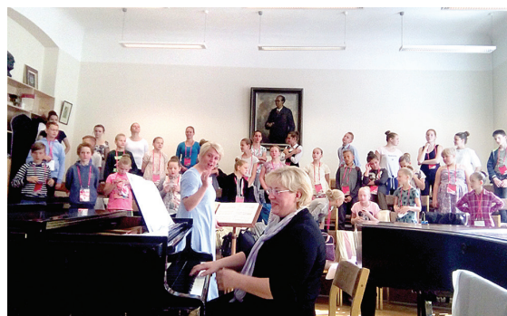
Rīta iedziedāšanās akadēmijā.