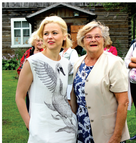
Amtmaņa-Briedīša prēmijas laureātes 2017.