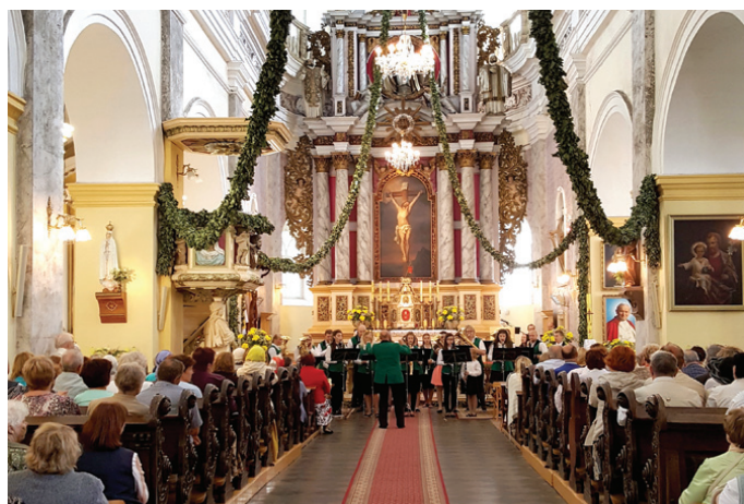
Pūtēju orķestra melodijas izskan baznīcā.

Izdomas netrūka! Gājiens ar šarmu, unikalitāti un sirsnību vijās uz tautas namu, kur visus gaidīja Baltinavas amatierkolektīva «Palādas» izrāde «Ontans un saime». Tautas nams pilns ļaužu baudīja Latgales dialektu un humoru. Īsi pirms izrādes tās galvenais varonis Ontans interesentus pacienāja ar «šmakovku». Vakara noslēgumā varēja izdejoties diskoballē.