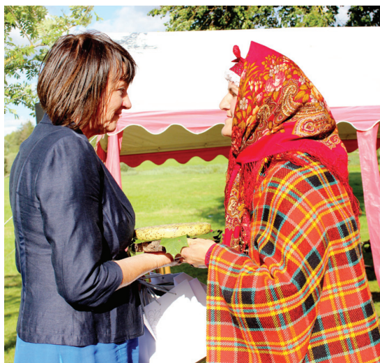
Suitu sievas dāvā namamātei siera rituli.

KATRĪNA ANTONOVA, Sabiedrisko attiecību nodaļas redaktore