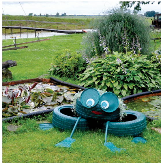
«Mačenos» pie ūdensrozēm gozējas varde.

Iebraucot zemnieku saimniecībā «Ķekari», pār pagalmu cēli aiziet zosu bars, turpat stāigā suns un kaķi, kuri cits citu netraucē un dzīvo harmonijā. Tāds pats miers jūtams saimniekos, kuri pastāsta par savas saimniecības pirmsākumiem – iesākuši ar piena lopiem, līdz nonāca pie gaļas liellopu audzēša-