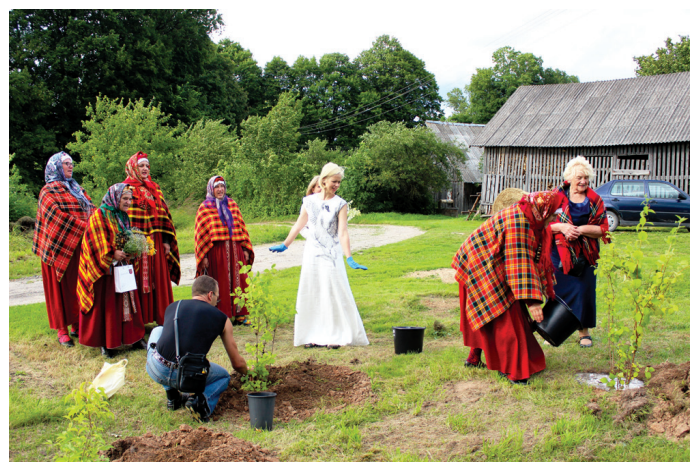
Jasmīns jau ierakts, un aktrise var uzdegot.