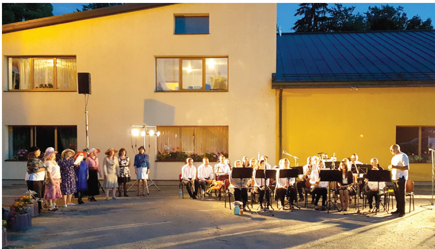
Pūtēju orķestri «Skaistkalne» sveic sieviešu vokālais ansamblis «Vēl mazliet» un amatierteātris «Gadījums».