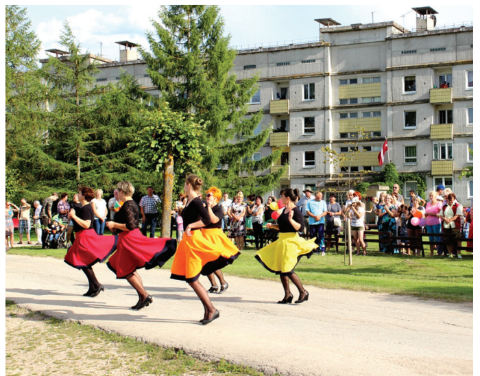
Vejā plīvo Mazzalves deju kopas «Mozaika» dejtāju svārki.