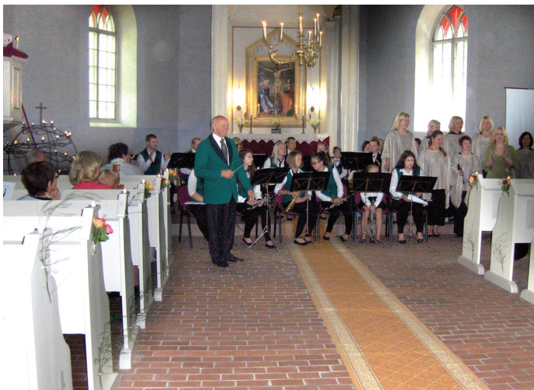
Skaistkalnes pūtēju orķestris aizkustinošā priekšnesumā priecē atnākušos.

Bārbeles baznīcas sākumi datējami ar 1567. gadu, kurā