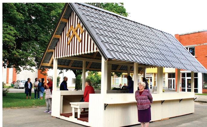
Jaunajā tirgus mājiņā tirgotāji un pircēji aktīvi jau atklāšanas dienā.

Palīdzīgu roku mājtiģus mājiņas tapšanā pielika lauksaimniecības uzņēmuma «Bog-