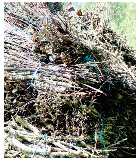
Zemnieku saimniecībā «Auseklīši» sagādāta tējas malca.

nas un paši smeļ, ka zemnieku kontrolē 15 valsts institūcijas.