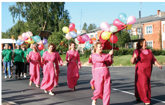
Ar baloniem skatītājiem sveiciens sūta vokālais ansamblis «Vēl mazliet».