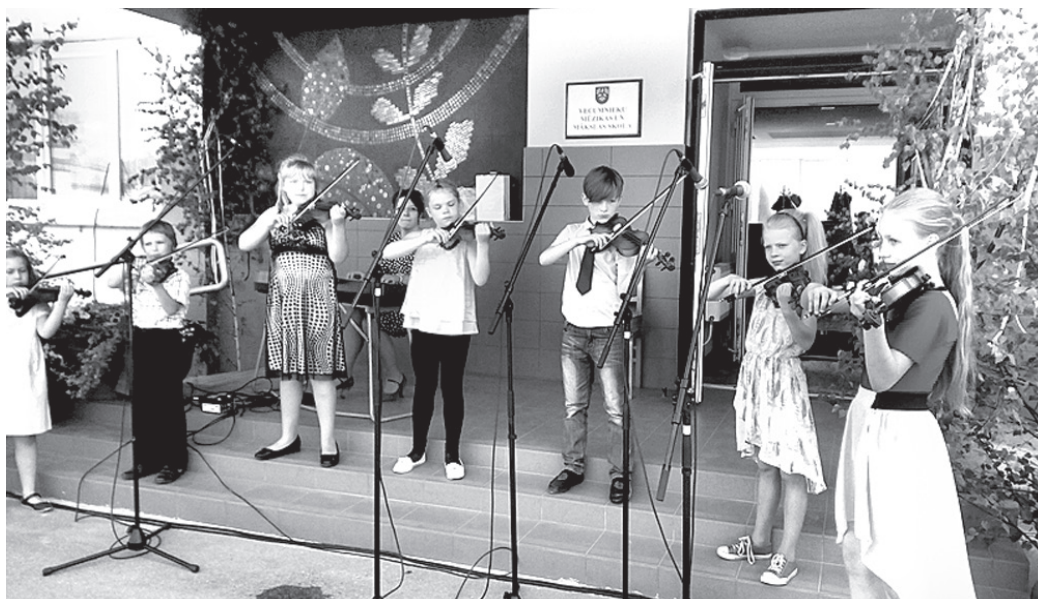
Muzicē vijolnieku ansamblis.

Šogad laika apstākļi mūs lutināja un svētki izdevās krāšņi un dzīvi. Muzikālus priekšnesumus bija sagatavojuši Mūzikas skolas audzēkņi, kā arī vie-