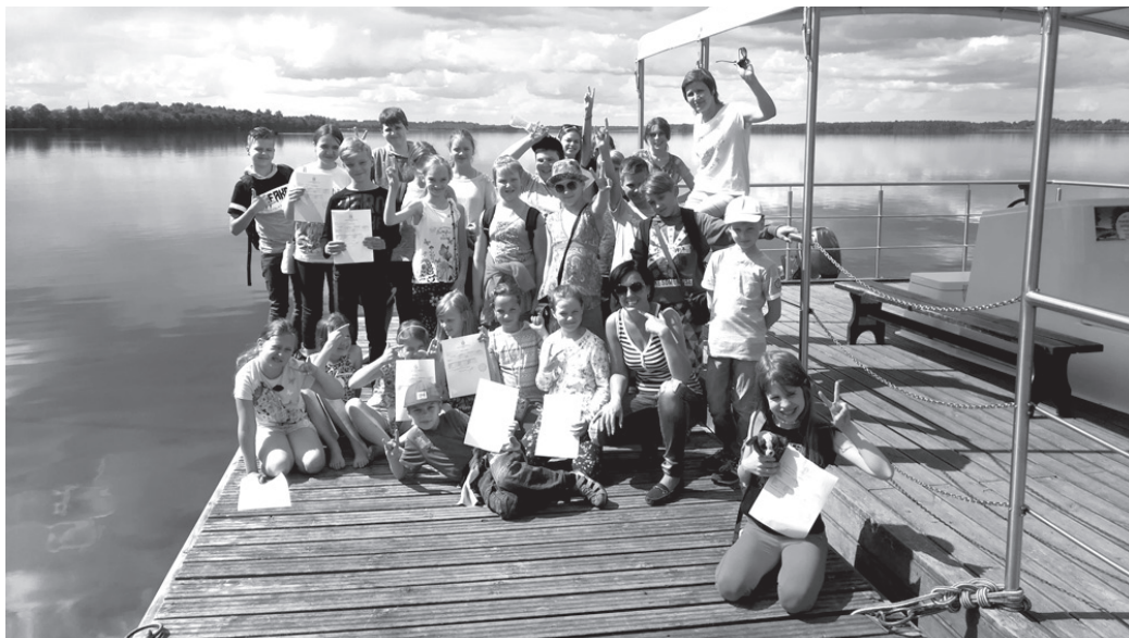
Mākslas programmas audzēkņi pie Ledus laikmeta centra Tartu, Igaunijā, pēc liecību izdošanas.