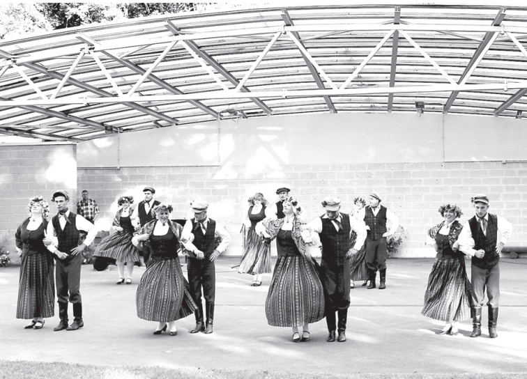
ncertā deju vidējās paaudzes tautas deju kolektīvs «Stelpe».