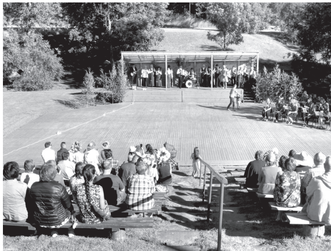
Līgo dienas koncerts Skaistkalnes estrādē ar lietuviešu folkloras kopu no Radviliškkiem un Skaistkalnes orķestra piedalīšanos.