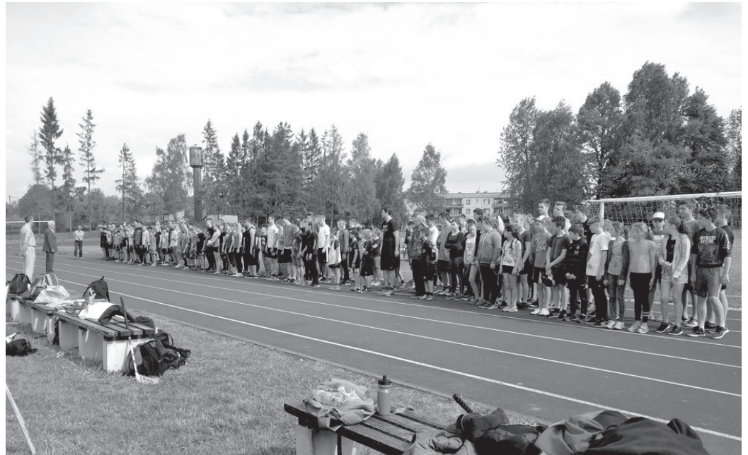
Olimpiādes dalībnieki sacensību atklāšanā sastājušies parādei.

Dienas pirmajā pusē dalībnieki startēja vairākās vieglatlētikas disciplīnās – dažādu distanču skrējienos un stafetē, šķēpa mešanā, augstlēkšanā,