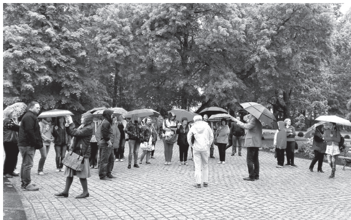
Olustvere lauksaimniecības vidusskolas direktors iepazīstina ar skolas apkārtni.