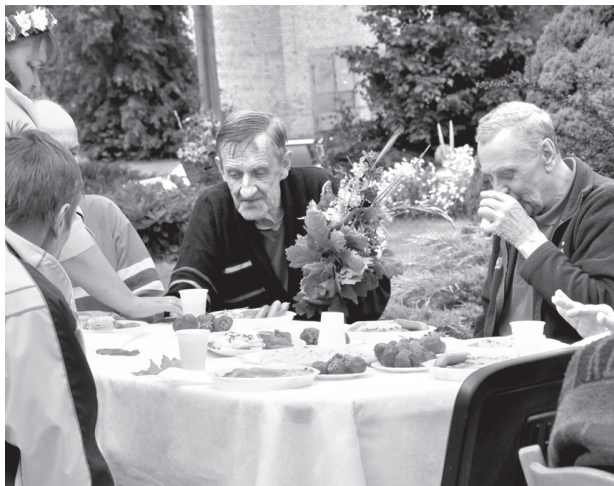
Svētkos tika sveikti pieci pansionātā mītošie Jāņi un divas Līgas.