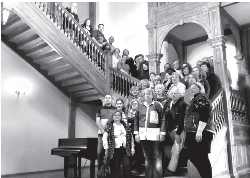
Mācību grupu kopbilde Olustveres vidusskolas muižas daļā.

Praktisko nodarbību ietvaros tika organizēts arī mācību