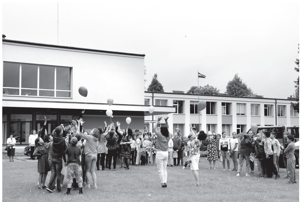
Misas vidusskolas skolēni mācību gada noslēguma dienā palaiž debesīs balonus, kuros ievietots kāds īpašs vēstījums.

1. v. latviešu valodas, 2. v. bioloģijas, 3. v. ekonomikas, 3. v. fizikas olimpiādēs, 1. v. skolēnu ZPD konferencē novadā un 3. pakāpes diploms Latvijas mērogā;