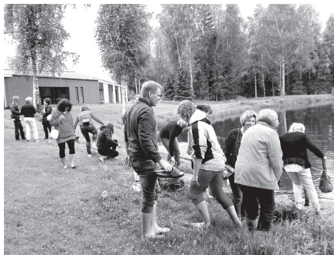
Pēc pastaigas Enerģijas sētā visi mazgā kājas Navesti upē.