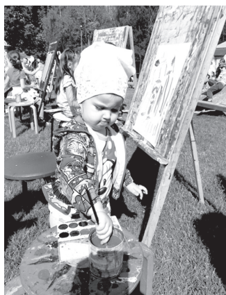
Bērni izpauž radošumu gleznošanas plenērā.

Tradicionāli mācību gada nogalē novada bērni tiek pulcināti pie Vecumnieku Mūzikas un mākslas skolas, lai kopīgi baudītu mūziku, ļautos radošām un mākslinieciskām aktivitātēm svētkos «Pretī saulei, līdzī priekam».