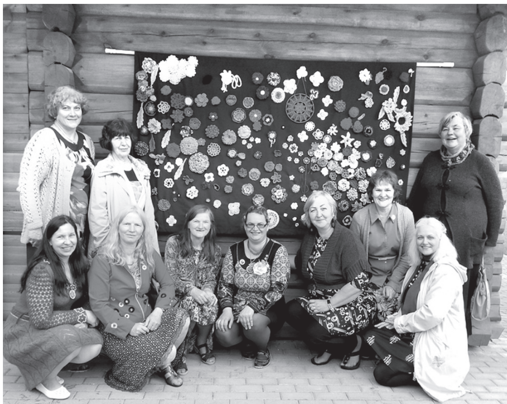
Rokdarbnieces amatu mājā Lietuvā priecīgas par padarīto darbu.