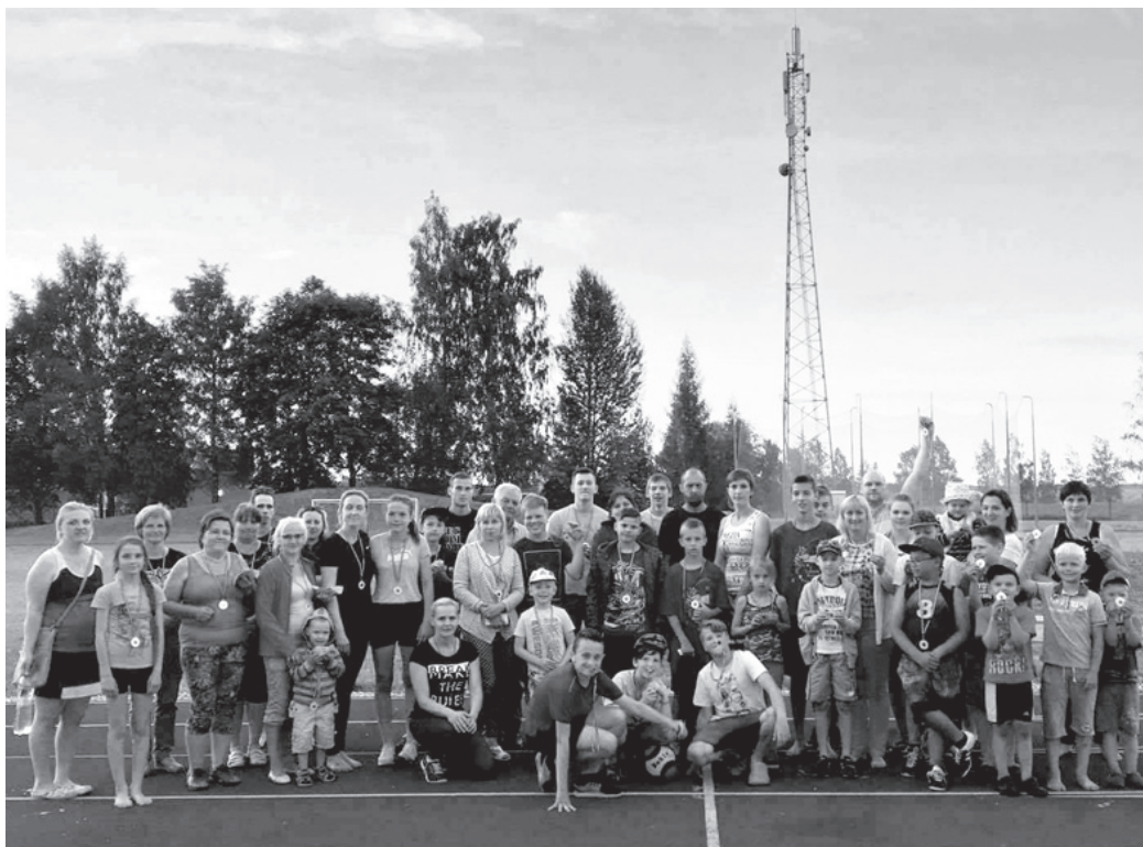
Ģimeņu volejbola pasākuma dalībnieki priecīgi par sportiski pavadīto dienu.

Pēc garās un darbīgās dienas visi tika apbalvoti ar piemiņas balvām un gardu kūkas gabaliņu.