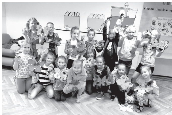
Bērni rāda radošajā dienā izgatavotos taurenus un mašīnas.