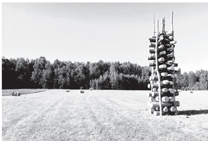
Jau trešo gadu pēc kārtas Skaistkalnē tapa varens Jāņu ugunsķūris, šogad tas sasniedza 5 metru augstumu!