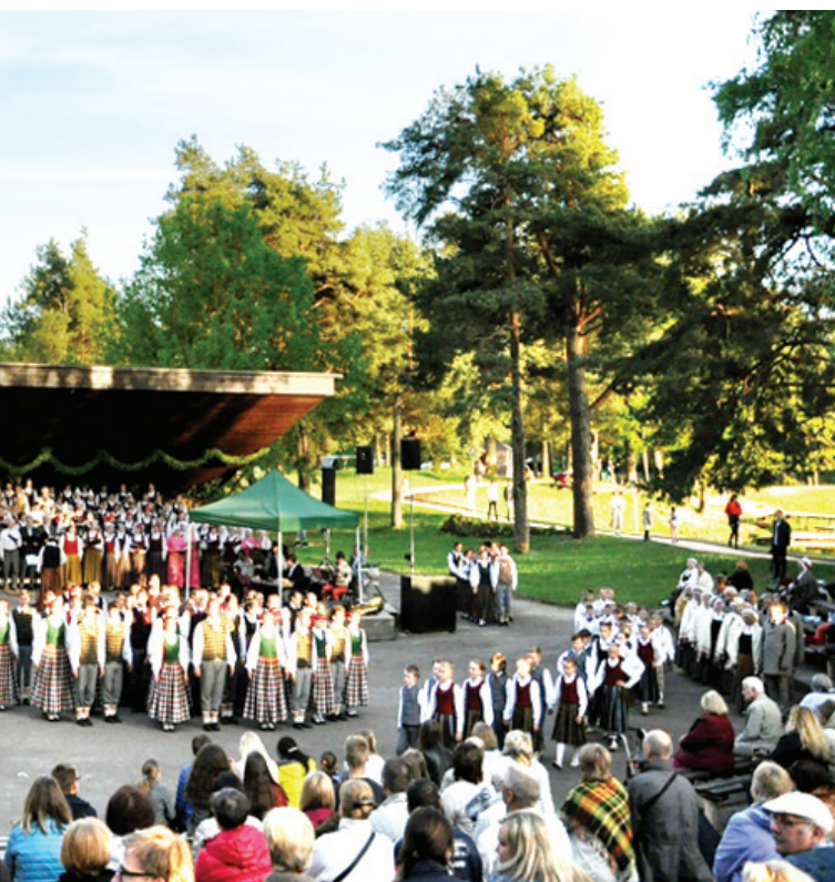
dz, saaugot kopā un spītējot svešajam, veidojās viena, spēcīga tauta