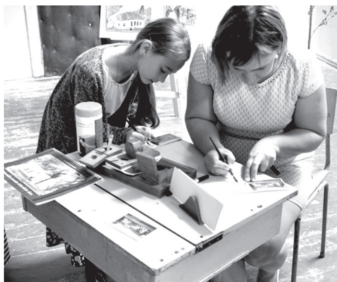
Vecumnieku muzejā notiek rakstīšana ar spalvu un tinti.