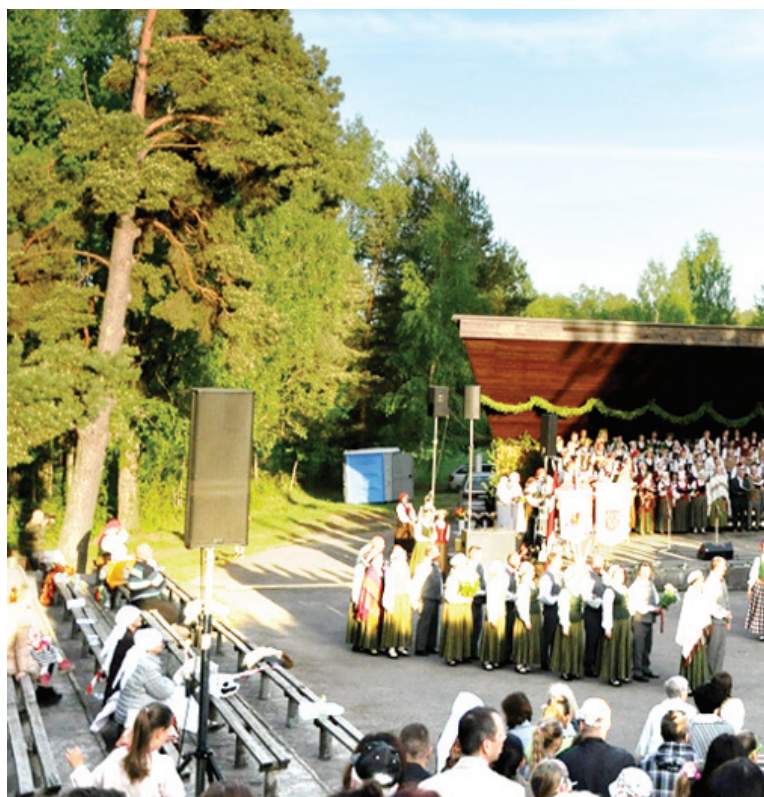
«..jo vairāk latvju tautas no zemes ārā rāva, jo stiprāk tās sakņojās, jo ar savu valodu, tradīcijām un stipriem, skaistiem cilvēkiem!»

certa laikā piedzīvoja ļoti plašu emociju gammu, ko no sirds nodeva arī savam skatītājam – no tradicionālām tautas dziesmām cilšu veidošanās posmā, līdz asinis stindzinošiem marša ritmiem un laikmetīgās dejas saraustītajiem soļiem svešo iekarotāju varas atainojumā. No cerības, kas atdzimst kopā ar Gaismas pili, līdz pārliecinātam un gaišam skatam tautas nākotnē, kas balstīta latviskās vērtībās un cilvēciskā mīlestībā uz savu tautu. «Lec saulīte, spīdi spoži, vieno visu latvju tautu!» – ar šādiem vārdiem izskanēja lielkoncerts, kura izveidei visas sezonas garumā strādāja novada amatiermākslas kolektīvi, to vadītāji un visa svētku radošā komanda.