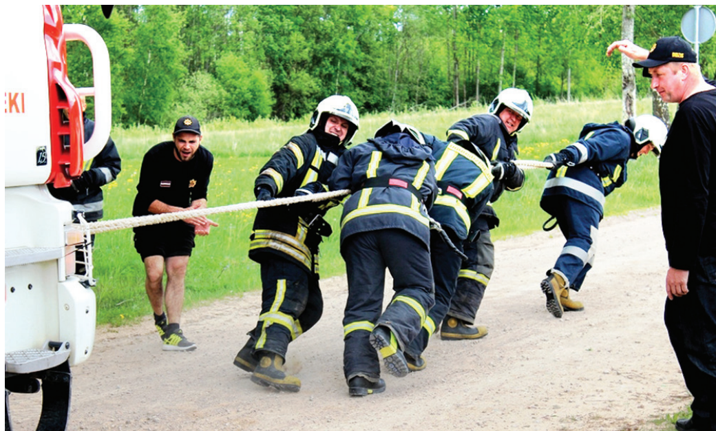
Vecumnieku posteņa komandas spēcīgie vīri šķērso finiša līniju.

Komandas sacentās arī stafetē, kurā bija jāveic brauciens ar glābšanas laivu un laivas