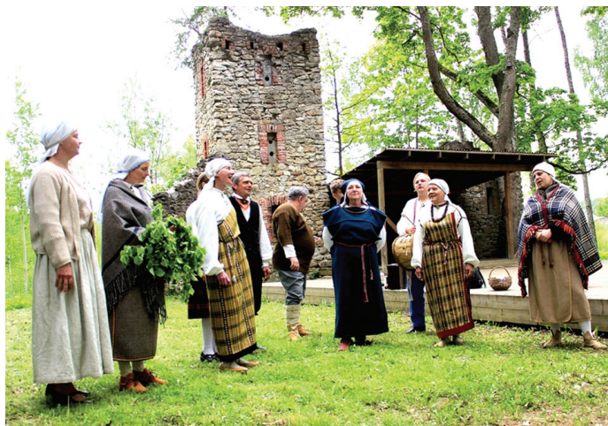
Folkloras kopa «Tīrums» Kurmenes estrādē iepazīstina ar Pēterdienas tradīcijām.

○ Ar daudzveidīgiem un emocijām bagātiem kultūras notikumiem izskan