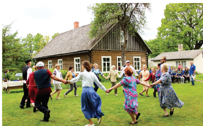
Zaļumballes izdarībās Amtmaņu muzejā iesaista Valles amatierteātris, balli spēlēja pūtēju orķestris «Skaistkalne»