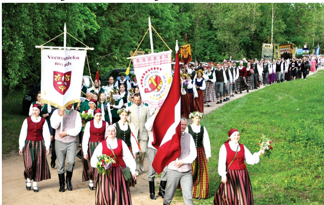
Dziesmu un deju svētku dalībnieki iesoļo estrādē.