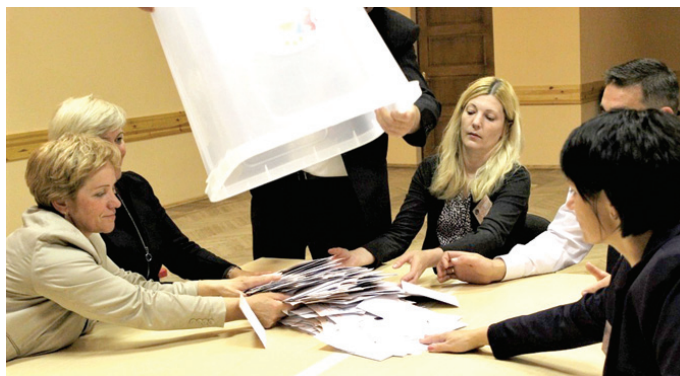
Vecumnieku tautas nama vēlēšanu iecirknis ķeras klāt balsu skaitīšanai.