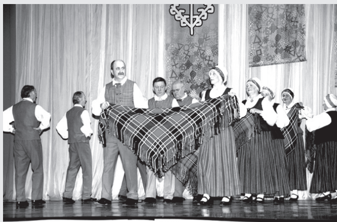
«Ozola» vīriem un sievietēm dejā ar villainēm vienīgajiem izdevās pareizi izpildīt paredzēto soli.