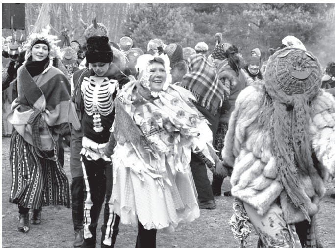
Uzkalniņā pie Jaunā ezera metenbērnī lāvās trakuļībām.