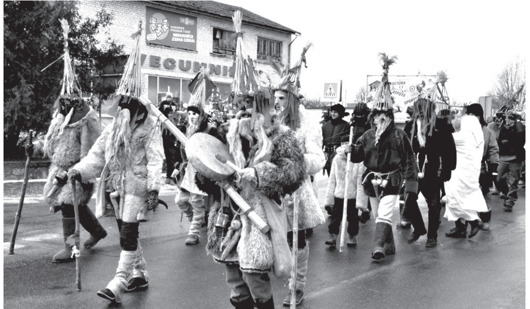
Budēļi galvās lepni nesa īpašās konusveida rudzu vārpu cepures un pievērsa uzmanību ar auglību simbolizējošiem vīrišķajiem rikiem – steberēm.

«Jautra rotaļa bija Meteņa dzīšana jeb Meteņa mīziens; kurš tam ļaujās, to vasarā nekož odi un mušas. Senos laikos Meteņa dzinējs uzrāpās