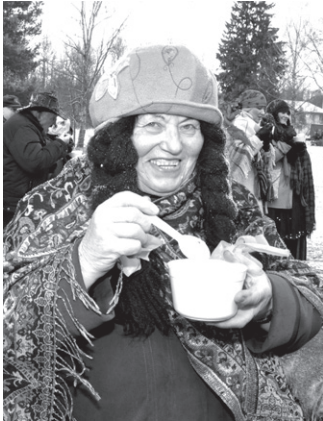
Uz dzīvas uguns gatavotā putra bija garda jo garda.

→1. lpp. simboliskā salmu bumbas dedzināšana un klātesošo enerģija padzina ziemu. Svinību izskaņā jau pavisam mierīgā un pavasarīgā gaisotnē sanākušie varēja mīloties ar Meteņa putru un noskaņoties danču vakaram Vecumnieku tautas namā.