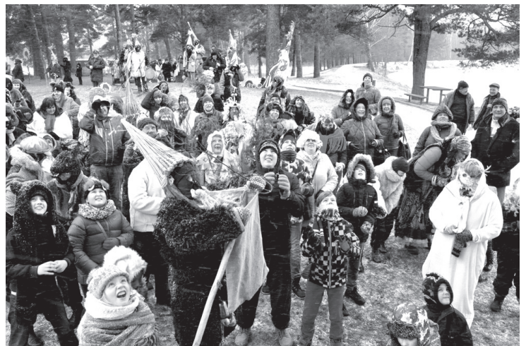
Metenis lielus un mazus aplaimoja ar saldumiem un ūdens šļakatām.