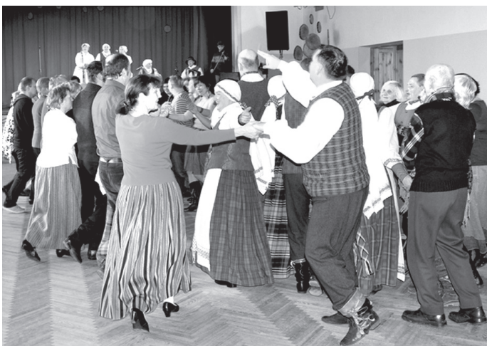
Meteņu švīnības izskanēja ar danču vakaru kopā ar folkloras kopām «Žemyna» (Lietuva) un «Tīrums» (Bārbele).