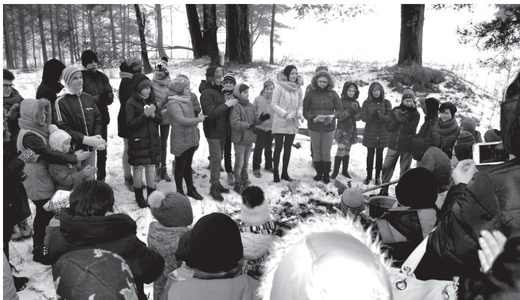
Misas vidusskolas kolektīvs atzīmēja 1991. gada barikāžu aizstāvju atceres dienu.

Noslēgumā visi varēja sasildīties ar zāļu tēju, kas vārīta uz ugunsroka, un iestiprināties ar sviestmaizītēm.