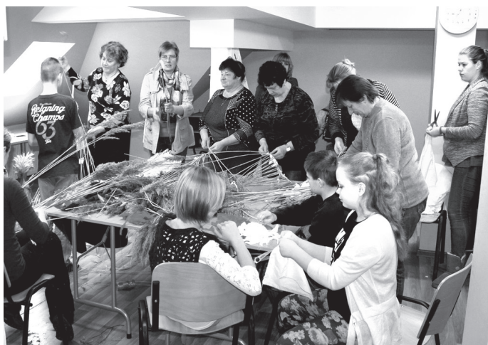
Stelpieši atzina, ka budēja cepures darināšana prasa pacietību.

○ Stelpē un Vecumniekos darina budēļu cepures