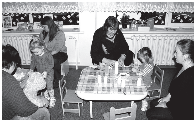
Grupas «Rūķīši» pārstāvji ieinteresēti iesaistās sveču tapšanas procesā.

Laika apstākļu maiņa un apkārt klejojošie vīrusi bija likuši par sevi manīt, veselības un možuma pilnus atstājot vien izturīgākos, taču tas neliedza radīt īpašu gaisotni pirmsskolas grupās.