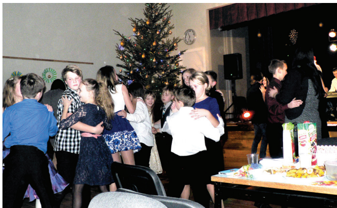
Valles vidusskolas audzēkņi labprāt gan dejoja, gan iesaistījās citās aktivitātēs.

Par balles muzikālo pavadījumu rūpējās duets «Uzmini nu!». Pateicoties muzikantu aktivitātei, puīši un meitenes ātri vien devās uz deju placi. Vecāko klašu audzēkņi