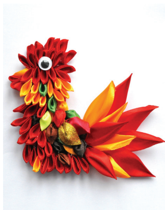
Sagaidot 2017. gadu, tapis Ugunīgā gaiļa tēls.

Gribējās par to uzzināt ko vairāk. Atradu informāciju, ka šī metode radusies 18. gadsimtā Japānā, kad geišas brīvajā laikā izrotāja savus kimono ar ziediem, bet vēlāk gatavoja matu rotas savām frizūrām. Agrāk valdīja uzskats, ka salocīto auduma ziedu izmantošana matu sakārtojumā spēj atvairīt ļaunos garus.