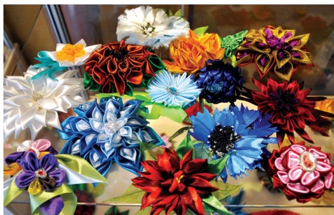
Ziedus un matu rotas vieno koša materiāla izvēle.