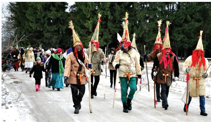
Budēļu gājieni allaž norit jautrā noskaņā.

Sarīkojuma «Meteņi Vecumnieku novadā» programmā paredzētas daudzveidīgas aktivitātes: tēlu izdarības lauku sētās, Meteņu tirgus, maskotais gājieni no Vecumnieku centra līdz Jaunajam ezeram, Meteņu svinības ezera krastā