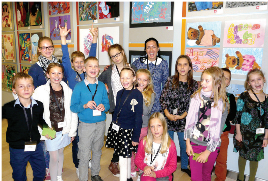
Vizuāli plastiskās mākslas programmas audzēkņu darbi 2013. gadā bija eksponēti Latvijas Nacionālajā bibliotēkā – Gaismas pilī.