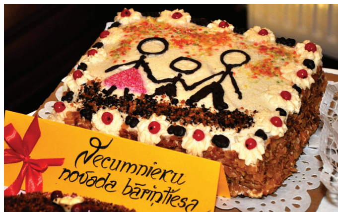
Vecumnieku novada bāriņtiesas tortes autore ir Sociālā dienesta darbiniece Jana Veide.

Vecumnieku novada bāriņtiesa pašreizējā sastāvā darbojas vairāk nekā divus gadus. Priekšsēdētāja Evita Caune uz-