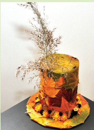
Samantas Cibules rudens noskaņas darinātais dekors.