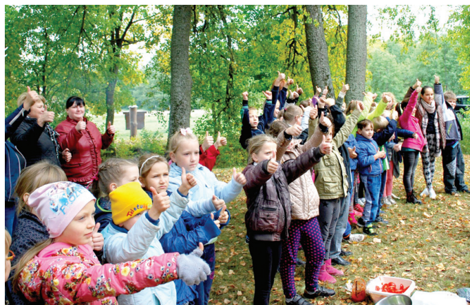
Bērni novērtē tikšanos ar nepārprotamu žestu – iķšķi uz augšu nozīmē, ka draudzēšanās viņiem patīk.

Tikšanās otrajā daļā ciemata pilskalnā tika apgūtas tautas rotaļas. Apjautām, ka kopīgā ir ļoti daudz – latviešu rotaļai «Pirtīņa deg» analoga