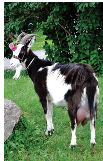
Raibā kaziņa Turkupupa piesaistīja gan bērnu, gan pieaugušo uzmanību.