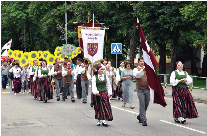
Deju kolektīvs «Vēveri» gājienā devās ar skanīgu dziesmu.

○ Pierobežas pašvaldības stiprina draudzību