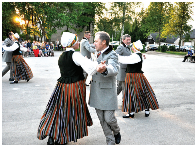
Jaunos tautas tērpus izrādīja deju kolektīvs «senValle».