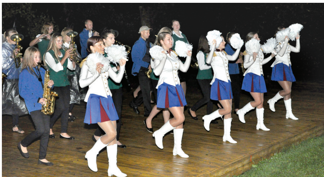
Kopā ar mažoretēm pūtēju orķestra priekšnesums ir atraktīvāks.