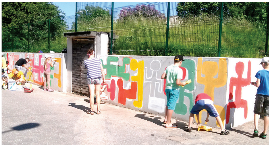
Pelēkās sienas apgleznošana Vecumnieku mūzikas un mākslas skolas audzēkņiem bija laba prakse lielformāta darbu izstrādē.

Ļoti karstajā 1. jūnija rītā mākslas programmas 3. – 6. klašu un «30V» audzēkņi, «apbruņojušies» ar krāsām, otām, paletēm un