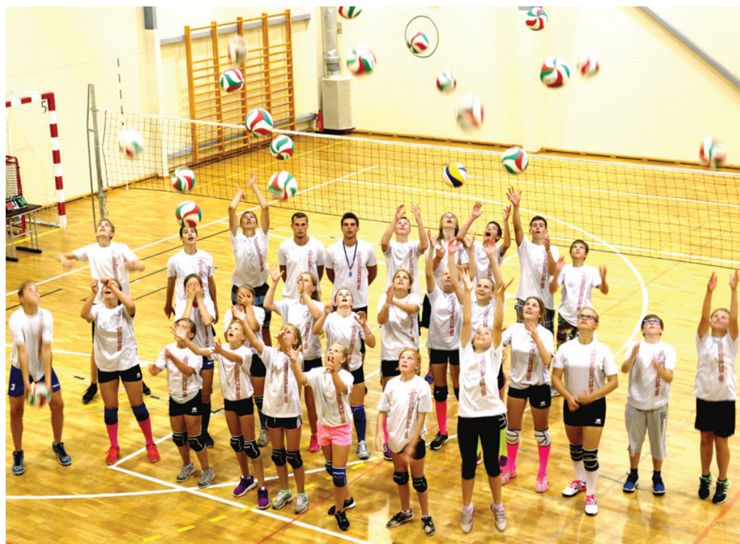
Pirmās nometnes dalībnieku kopbilde Valles vidusskolas sporta zālē.

U13 grupā zēniem pietrūka pavisam maz, lai kāds no