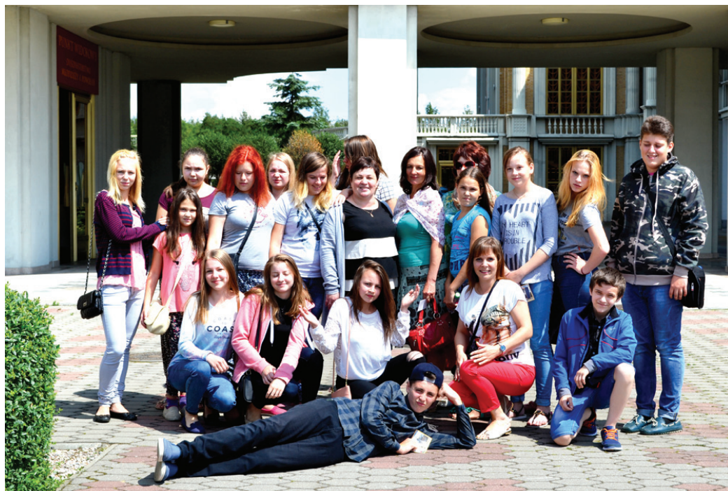
Misas vidusskolas 5. – 12. klašu koris šovasar devās koncertbraucienā uz Poliju.