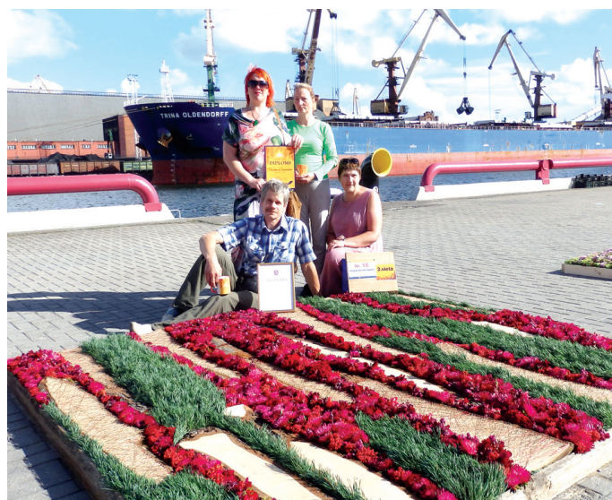
Vecumnieku floristu veidotais ziedu paklājs «Gadskārtu noslēpumi» guva augstu novērtējumu.

Japānas floristi bija labākie otro gadu pēc kārtas. Viņi strādā kvalitatīvi un enerģētiski