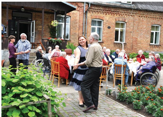
«Atvasarā» valdīja prieks un svētku noskaņa.