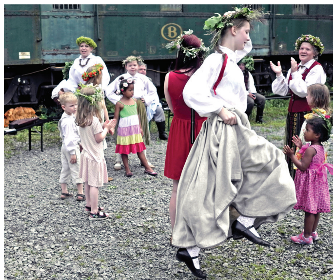
«Tīruma» dalībnieki rotaļās iesaista Briseles bērnus.

nieks varēja saņemt «gabaliņu» mūsu prieka un zināšanu par Jāņu svinēšanu Latvijā, sajūst līdzpaņemto Zemgales krāšņumu gan dziesmās, gan tērpos, kas vēl ilgi tiks domāt par savu identitāti un saknēm.