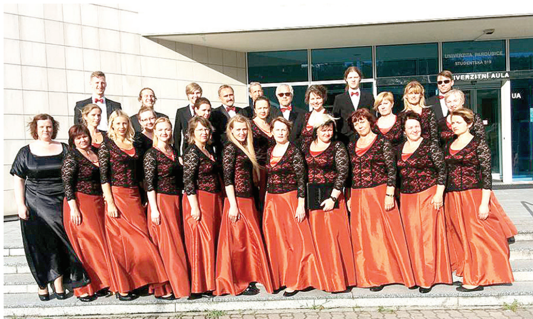
Vecumnieku tautas nama jauktais koris «Maldugunis» Pardubicē pirms pēdējā uznāciena.

Aizvadītā sezona korim bija notikumiem un skaistām koncertprogrammām bagāta. Darba cēlieņi mijās ar kopīgu atpūtu, gatavojot valsts svētku programmu, kas izskanēja Stelpē un Vecumniekos, strādājot pie ziemas saulgriežu koncerta «Ziemassvētki jaunajā pasaulē», bagātinot Vecumnieku tautas nama amatiermākslas kolektīvu koncertus, kā arī