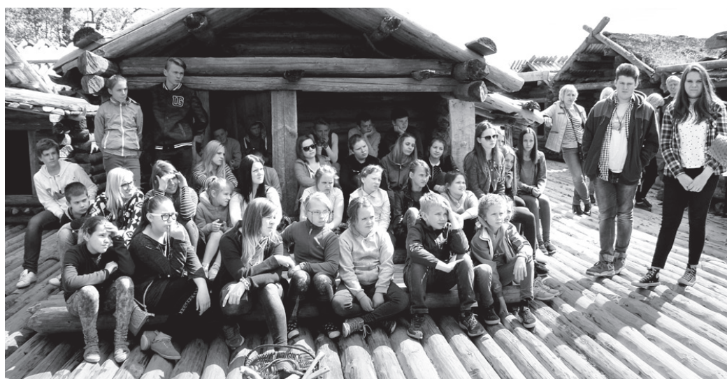
Misas vidusskolas labākie un aktīvākie audzēkņi mācību gada izskaņā devās ekskursijā uz Cēsīm un Āraišiem.

Skolotāja iniciējusi vērienīgus pasākumus. Misā noticis sadraudzības koncerts ar Bauskas skolu koriem, divi Misas kolektīvi viesojušies Bauskas kultūras centrā, skolēni koncertējuši gan Bauskas katoļu, gan Vecumnieku baznīcā. Ar vērienīgumu ikvienu pārsteidza koncerts Misā «Tik dēļ jums, daiļās dāmas, dēļ jums», kad plecu pie pleca dziedāja Dobeles mūzikas skolas zēnu koris, Ķekavas vidusskolas zēnu kamerkoris, Misas vidusskolas zēnu koris un vīru koris «Ķekava». Jūnija beigās