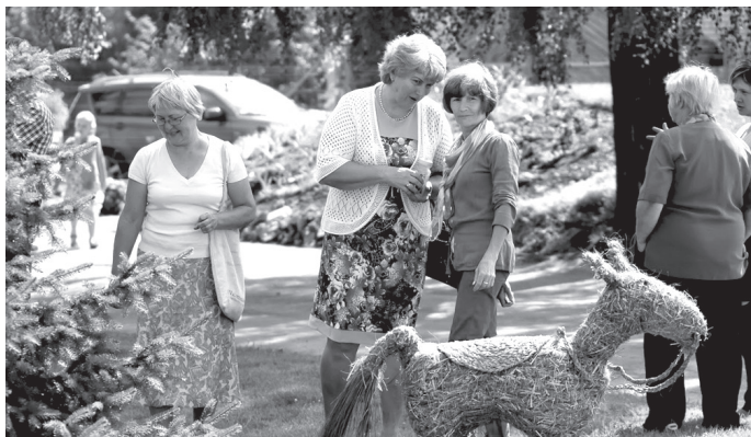
Svētku apmeklētāji apskata floristu konkursa dalībnieku veidotos mājas darbus, lai izlemtu, kam atdot «savu balsi».

→1. lpp. kā māksla pārņem telpu, kas uz laiku pārtop par «sievietes būduāru».