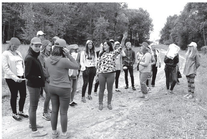
Pārgājiena laikā skolēni izzināja dabu.

○ «Fibiķīma skola» vieno jauniešus jau piekto vasaru