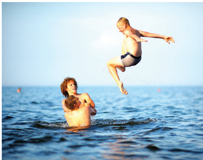
Radošās nometnes laikā brīvajos brīžos iecienītākās izklaides orķestra dalībniekiem ir peldes jūrā. 2014. gads.