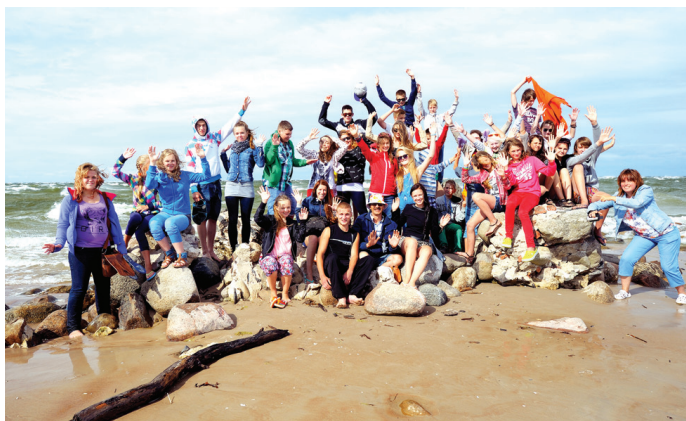
Ierasts, ka ik reizi radošās nometnes pirmajā dienā visi dodas uz Kolkas ragu, kur top arī kopbilde. 2013. gads.