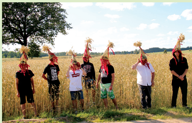
Budēļu cepures tapa no zemnieku saimniecībā «Roņi» izaudzētiem rudziem.