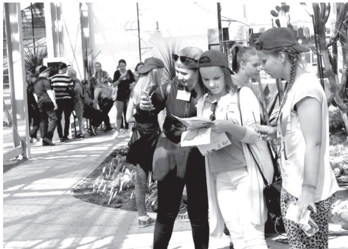
Aizraujoša bija nodarbība Latvijas Nacionālajā botāniskajā dārzā Salaspilī.

«Man šodien ļoti patika iet uz mežu, pļavu un diķi, jo vislabāk jutos dabā. Mēs devāmies uz mežu un redzējām stārķus, strazdus, dažādus augus un kokus. Kad bijām izstaigājušies, nācām atpakaļ uz skolu un darinājām maketus par ekosistēmām. Izgatavojām skaistu meža maketu.