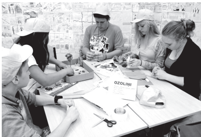
Top Vecumniekos izpētītās ekosistēmas modelis.

Šī bija ļoti interesanta un piedalīta diena.»