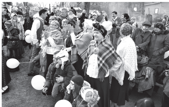
Izdarības tirgus laukumā aizrāva lielus un mazus.