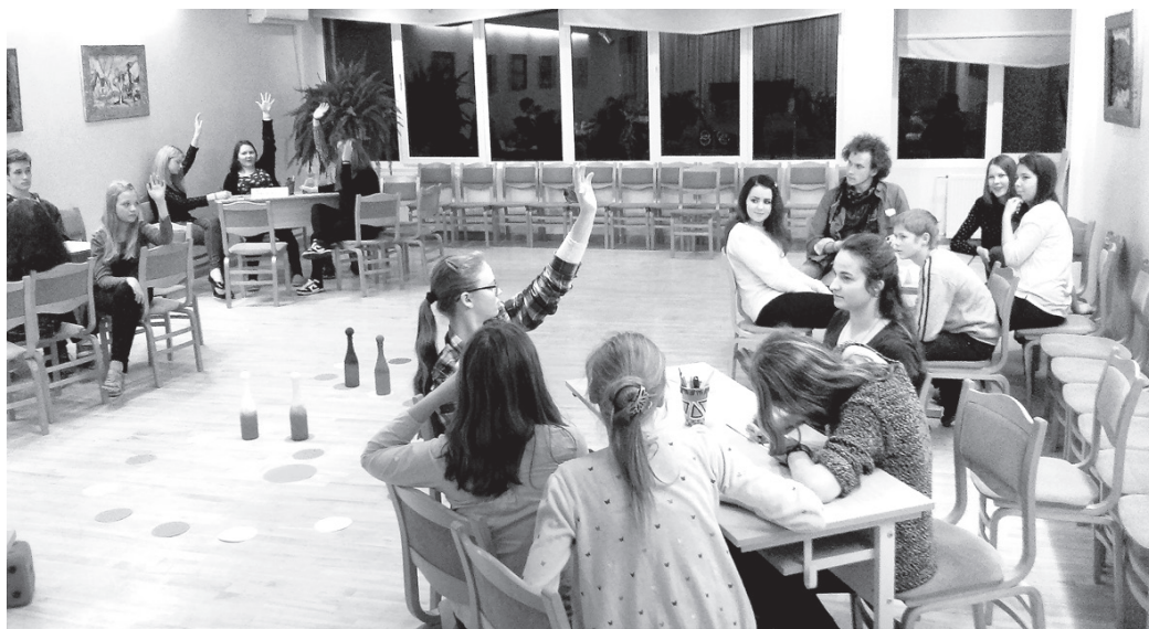
Kamēr pārējās komandas domā pareizo atbildi, zinātāji jau ceļ rokas, lai nopelnītu papildu punktus.

Sākumā veiksmīgākie kauliņa uzmešanā un virzībā uz priekšu bija komandas «Zudusī cerība» pārstāvji, taču vēlāk viņus pārējie panāca. Dalībniekiem bija iespēja pelnīt papildu punktus, atbildot uz jautājumiem pareizi, ja kāds kļūdījās, un tādējādi virzīties uz