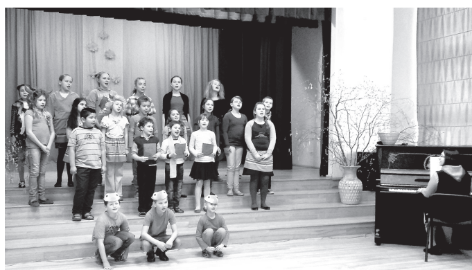
Ar dziesmu «Maza, zaļa vardīte» uzstājas vokālā ansambļa un ritma spēļu dalībnieki.