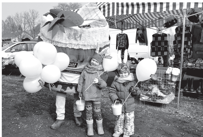
Ar uzņēmuma «Latvijas maiznieks» Kūciņu vēlējās nofotografēties daudzi svētku dalībnieki.

kūkas, maizes un maizītes, ko tirgus apmeklētāji varēja degustēt un iegādāties. Pircējiem bija iespēja piedalīties balvu izspēlē.