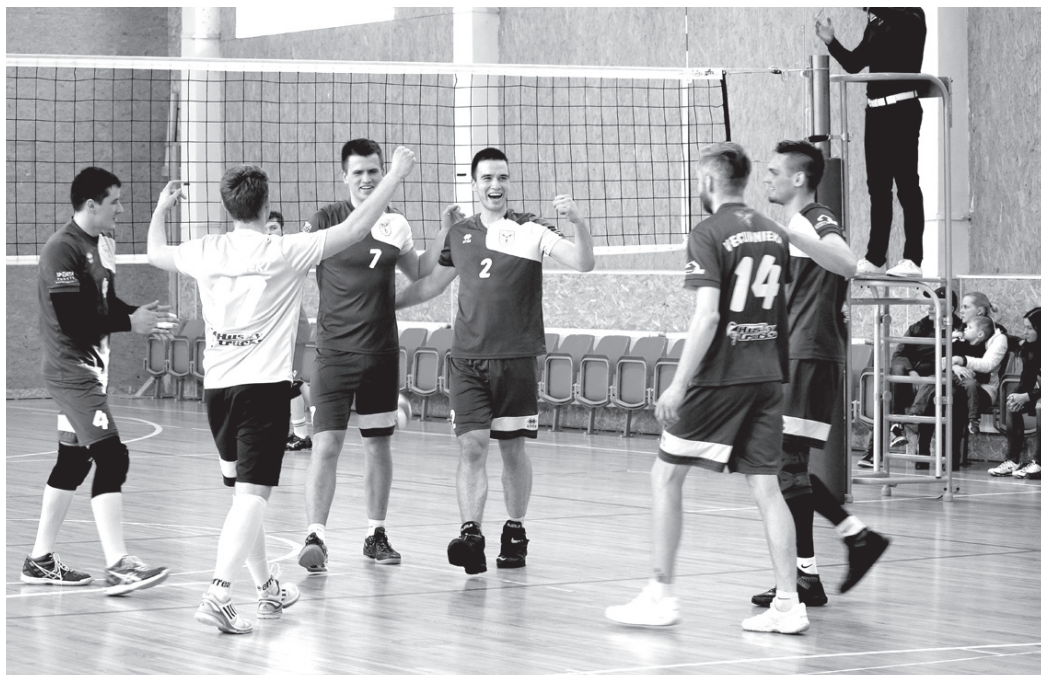
Komanda «Vecumnieki» spēlēja pret volejbola kluba «Balvi» vīriem izcīnīja uzvaru.