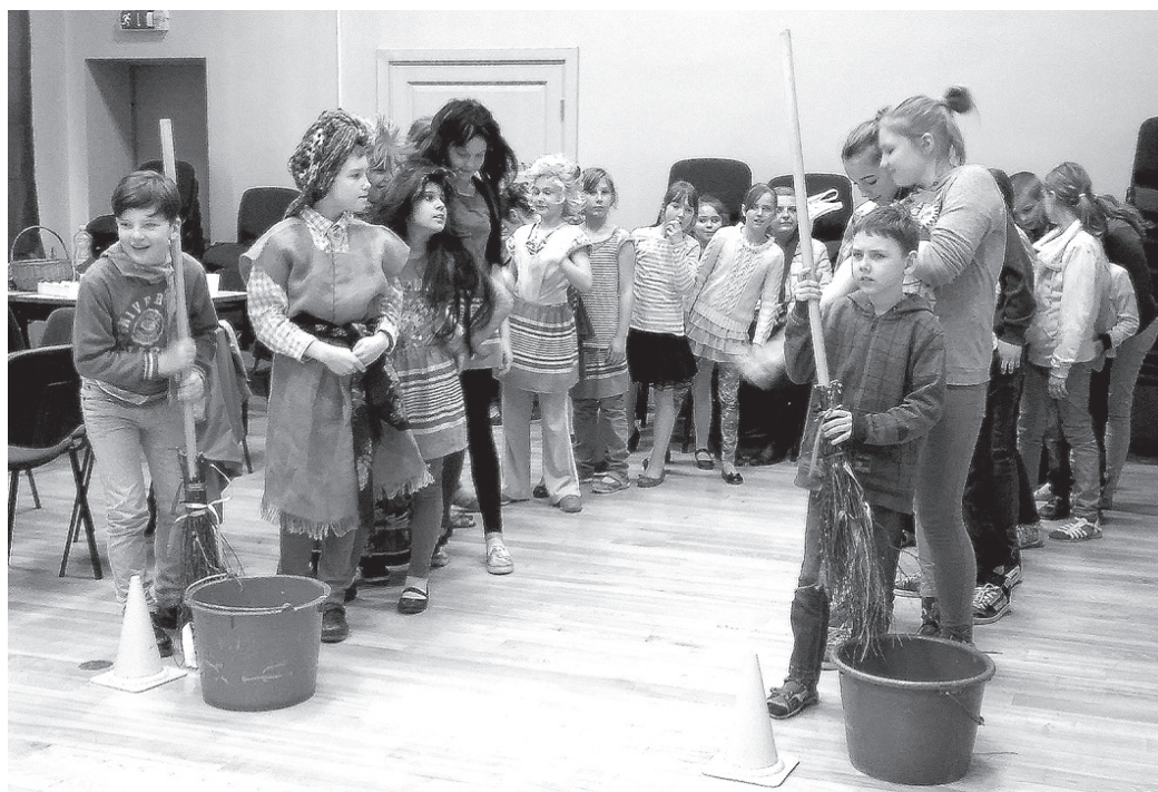
Aizraujoša bija teātra pulciņa dalībnieku sagatavotā atrakcija.