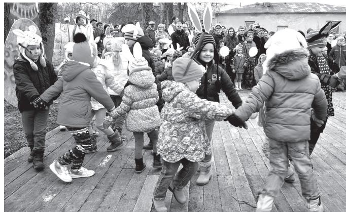
Bērni uz rotaļās iešanu nebija jāskubina.

Svētku atbalstītājs, uzņēmums «Latvijas maiznieks» bija atvedis daudz un dažādu veidu