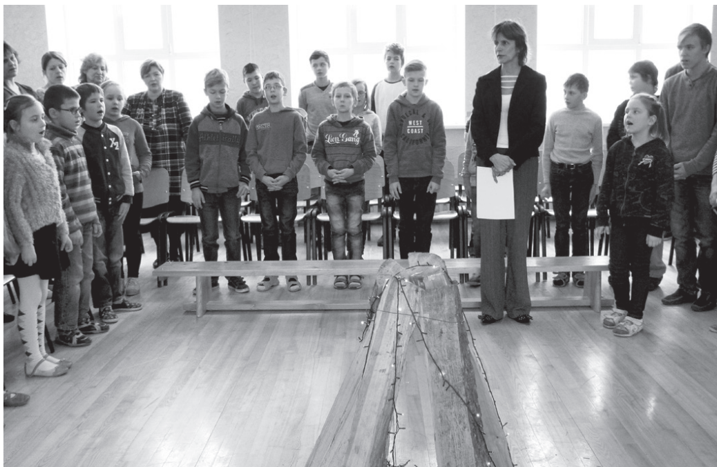
Pieminot 1991. gada janvāra notikumus, pie simboliska ugunsкура pulcējās Stelpes pamatskolas audzēkņi un skolotāji.

Vēstures skolotāja ļāva iztēloties, kā tika veidotas barikādes. Galvaspilsētā sabrauca smagā lauksaimniecības tehnika. Piekabes bija piekrautas ar smiltīm, dzelzsbetona blokiem un akmeņiem, lai pasargātu Rīgu no ienaidnieka tanku uzbrukuma, nosprostotu piekļuvi Latvijas Televīzijas ēkai un citiem svarīgiem objektiem.