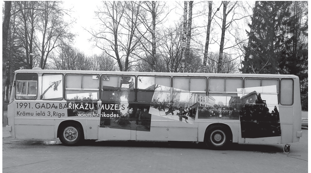
Autobusā iekārtotā ekspozīcija vēsta par Latvijas Trešās atmodas barikāžu laika notikumiem.