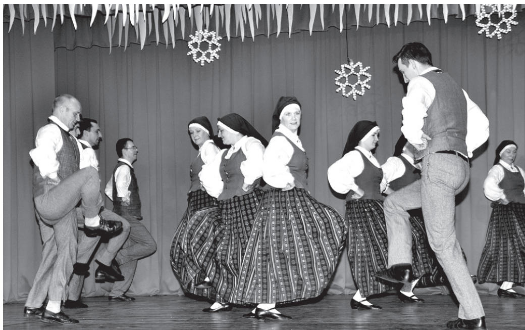
Emocijas un dzīvesprieku dejā pauž Vecumnieku tautas nama vidējās paaudzes deju kolektīvs «Vēveri».