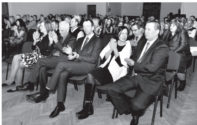
Pateicības sarīkojumu apmeklēja sporta jomas lietpratēji, sportisti un viņu atbalstītāji. Foto – ŽANNA ZĀLĪTE

Avots: Vecumnieku novada Domes sporta skola.