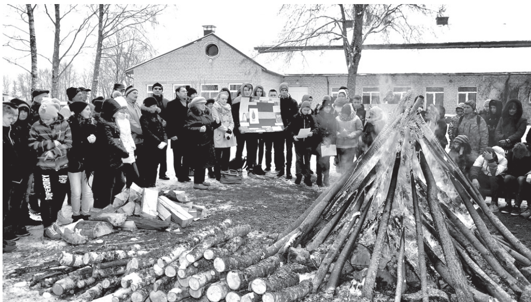
Pieminot tālos janvāra notikumus, barikāžu dalībnieki aicināja novērtēt izcīnīto uzvaru – iespēju dzīvot neatkarīgā valstī.