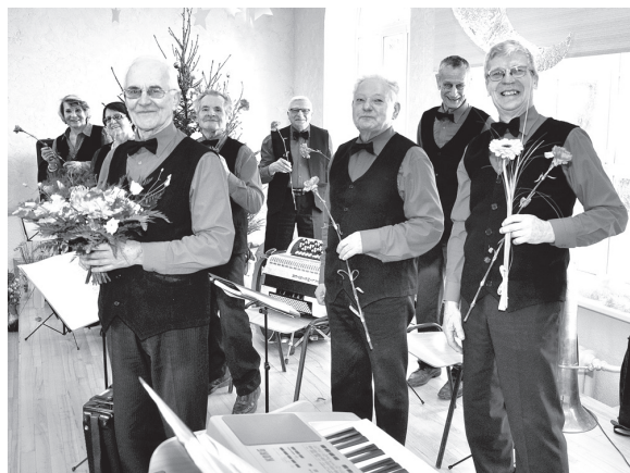
Senioru akordeonistu ansambļa «Akords» dalībnieki no Saldus uz Stelpi bija atveduši skaistas melodijas un dzīvesprieku.