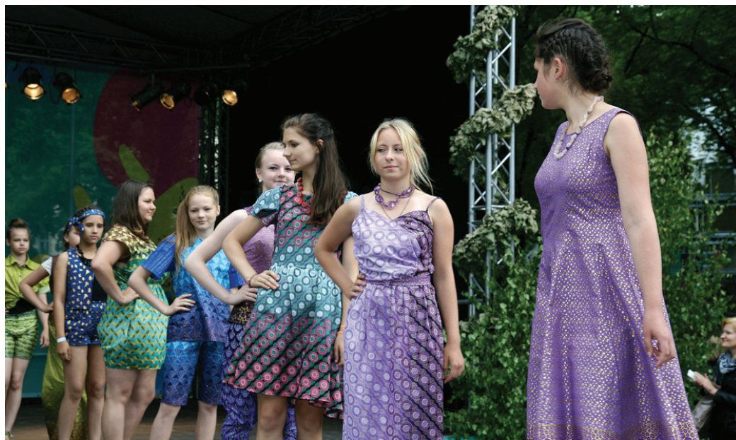
Vecumnieku vidusskolas audzēknes izrāda pašu veidoto tērpu kolekciju «Krāsainā Āfrika».

To ar cītīgu darbu gan nodarbību laikā, gan ārpus tā un šad tad arī sestdienās un svētdienās nopelnīja Vecumnieku vidusskolas 6.b klases meite-