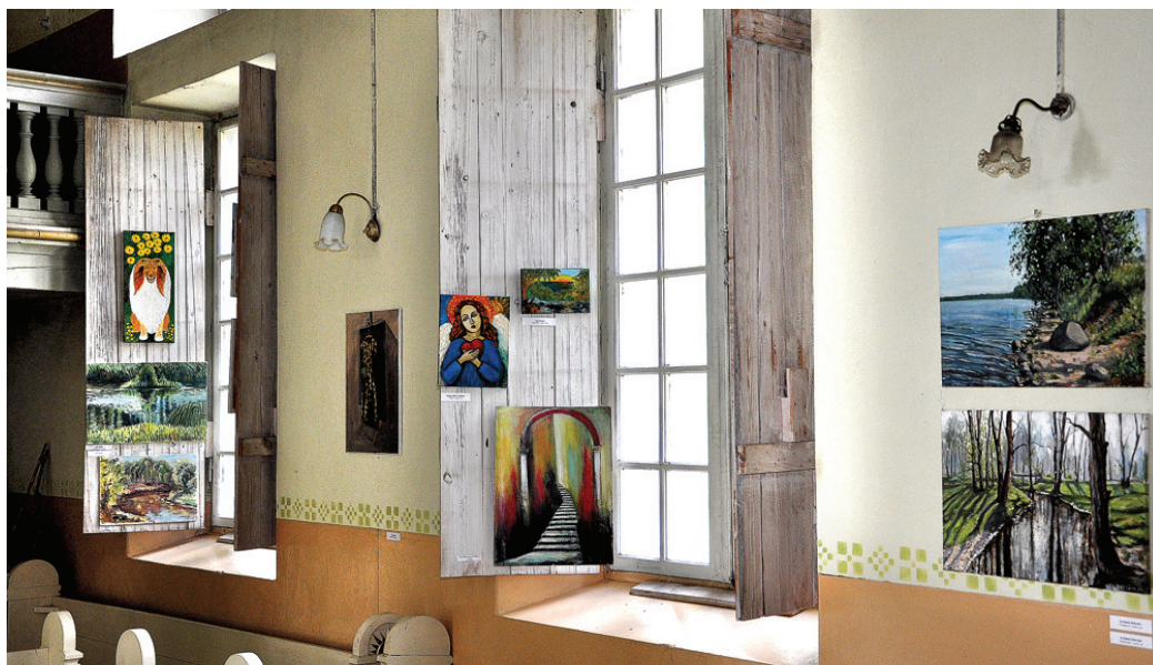
Līdz augusta beigām Vecumnieku baznīcā var apskatīt dažādu autoru gleznas.

Glezniecība ir izpausmes veids, kas tāpat kā vārda māksla vai mūzika spēj parādīt dvēseles izjūtas, kas neatrodas acīm redzamajā realitātē. Tāpat kā jebkurā mākslas žanrā, arī glezniecībā valda savi likumi un noteikumi, kas ir jāzina, taču pats būtiskākais ir patiesums