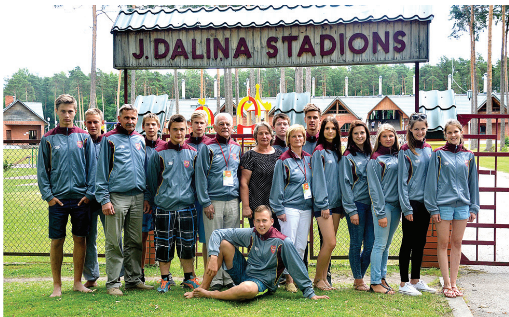
Vecumnieku novada sportisti un treneri Valmierā, J. Daliņa stadionā.

Trīs dienas sacensību norišu vietās valdīja komandas gars, jaunieši cits citu atbalstīja. Brīnumi nenotika, bet viss, kas tika iegūts, atspoguļo treniņos ieguldīto darbu. Dalībniekus vienoja gājiens atklāšanas ceremonijā, kurā novada karogu nesa Kristaps Jaun-