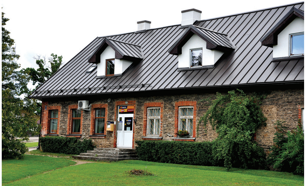
Kafejnīca «Pie Mēmeles» atrodas ēkā, kur darbojas Skaistkalnes pasta nodaļa.

Kafejnīca «Pie Mēmeles» būs atvērta katru dienu no plkst. 10 līdz 20, bet piektdienās, sestdienās un svētdienās – līdz plkst. 22.