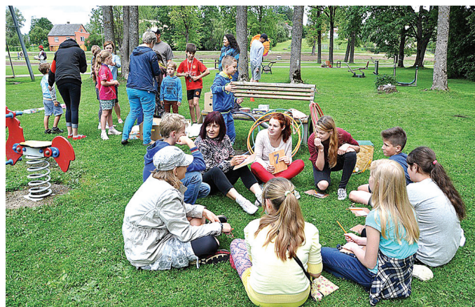
1. augustā Skaistkalnē valdija sportiska gaisotne, norisinājās dažādas aktivitātes bērniem.

82 gadus vecais skaistkalnietis Jānis Ābeltiņš uz Kane-