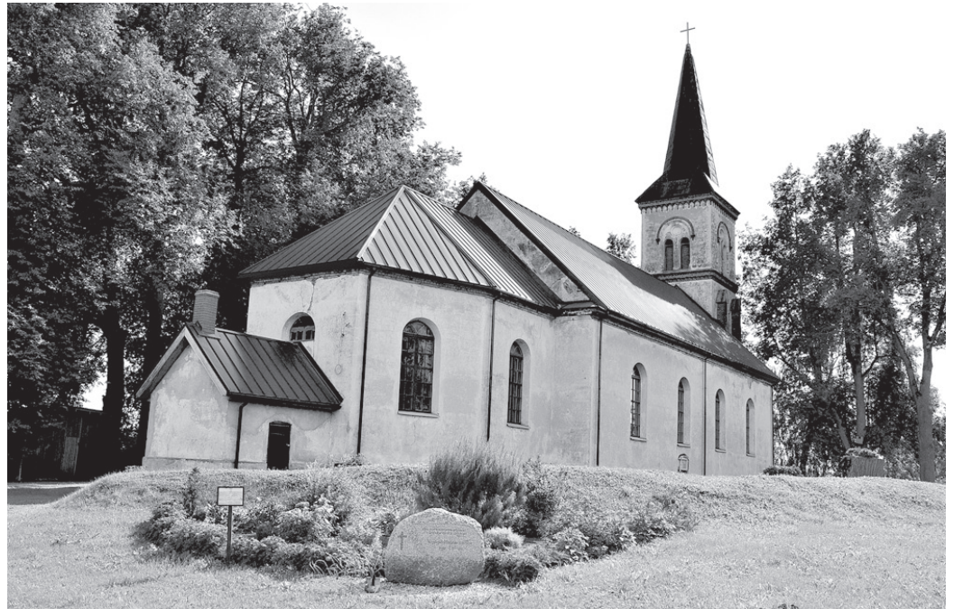
Valles evaņģēliski luteriskā baznīca 16. augustā uzņems tuvus un tālus viesus.