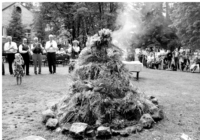
Kopīgi veidotā zāļu vija rotāja Jāņu ugunsroku, kas Vecumniekos tika iedegts parkā aiz tautas nama.