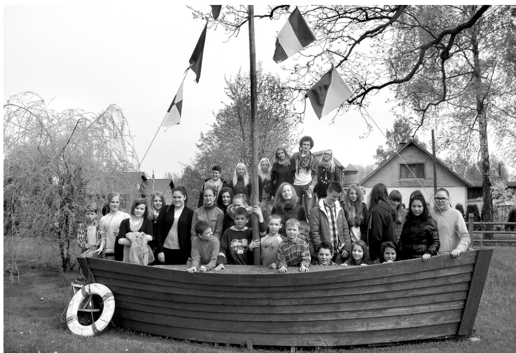
Ekskursijas dalībnieki pie Ainažu jūrskolas muzeja.

Klētiņā izvietotie eksponāti savākti tuvākajā apkārtnē, daudzi ir pašdarināti. Starp lietām bija veļas mašīna, maltuve, dažādas lādes, sieti, linu apstrādes rīki u. c. Visiem bijusi vieta lauku sētā.