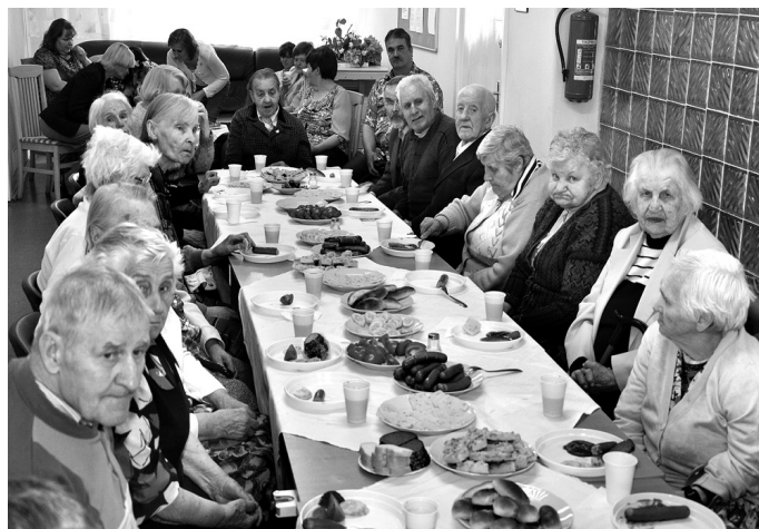
Pansionāta ļaudīm prieku sagādāja koncerts un iespēja pulcēties kopā pirmssvētku noskaņā.

Vecumnieku bibliotēka sadarbībā ar tautas namu 22. jūnijā aicināja pagasta iedzīvotājus