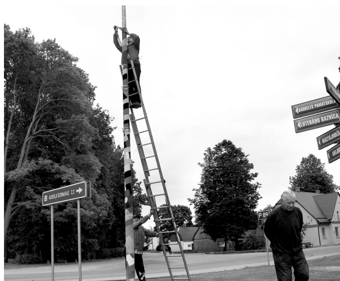
Apadītais laternas stabs atrodas pašā Bārbeles centrā.

B. KRAUZE, Bārbeles pagasta bibliotēkas vadītāja