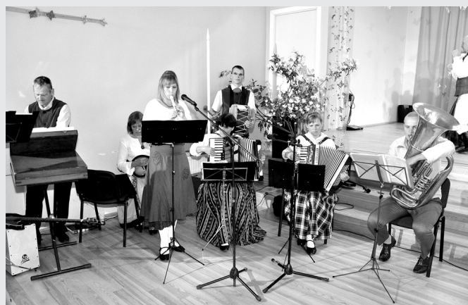
Lauku kapela «Savējie» kuplināja Jāņu ielīgošanas koncertu Vallē.