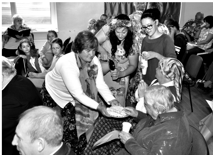
Koncerta apmeklētāji un dalībnieki Vallē varēja n baudīt gan jāņu sieru, gan alu un kvasu.