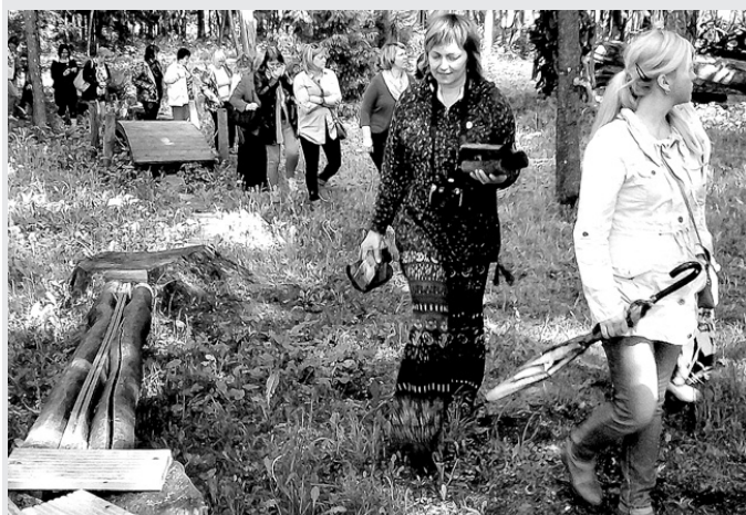
Vecumnieku novada pirmsskolas pedagogi izzināja «Mežmalīņas» draugu aktīvās atpūtas trasi Priekuļos.

S. SAMA, Vecumnieku novada pirmskolas metodiskās apvienības vadītāja