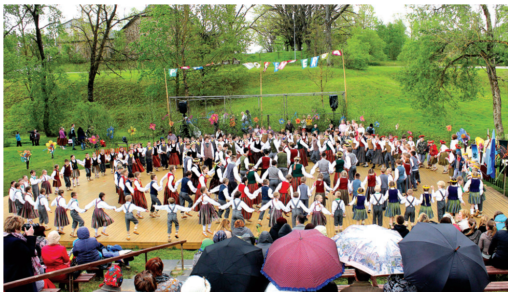
Svētku «Pavasaris Šēnbergā» dalībnieki vienojas kopīgā dejā.

Kā ik gadu, sarīkojums pulcēja daudz dalībnieku. No kaimiņvalsts Lietuvas ieradās Radvilišķu pamatskolas vadība, Biržu vidusskolas deju kolektīvs un ansamblis, Panevė-