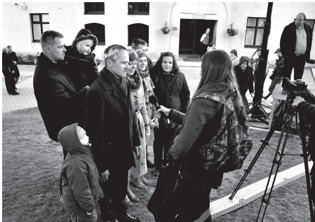
Mediņi bija vieni no septiņu Latvijas dzimtu pārstāvjiem, kas tika godināti koncertuzvedumā «Manas ģimenes ceļš».

«Tas ir liels pagodinājums pārstāvēt Zemgali šajos ģimeņu svētkos. Mūsu kuplā dzimta nav īpašāka par citām Latvijas ģimenēm, taču ar lepnumu apzināties, ka esam stipri un latviski,» novērtējot sa-