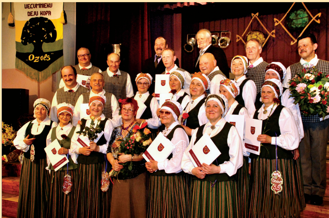
Vecumnieku tautas nama senioru deju kopai «Ozols» ir 55 gadus senas tradīcijas.