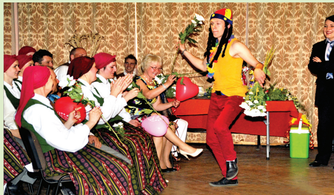
Ar eksotisku sveicienu «Vēverus» sumina deju kopas «Vanagi» (Vārkava) pārstāvji.