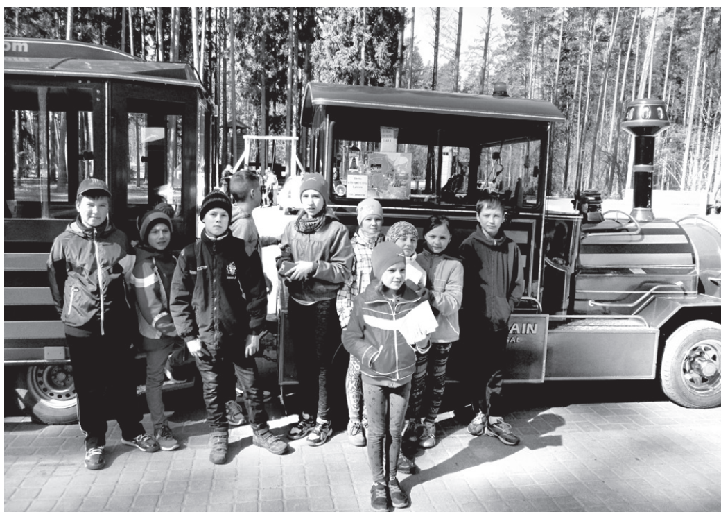
Vecumnieku vidusskolas audzēkņi Meža olimpiādē ieguva 5. vietu valstī.

Sacensībās bijām pati jaunākā komanda. Pārējie dalībnieki bija 8. – 12. klašu skolēni. Mums atļāva startēt visiem kopā – audzēkņiem un skolotājai, lai 5 km garajā trasē mežā bērni vieni paši neapmaldītos.