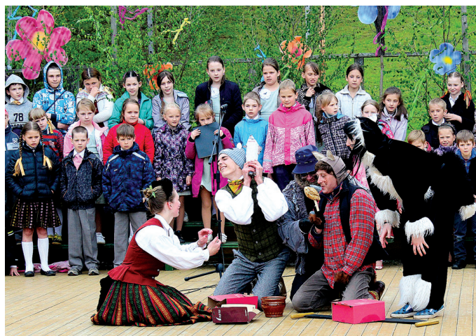
Teatrālu priekšnesumu sniedz pieci kaķi.