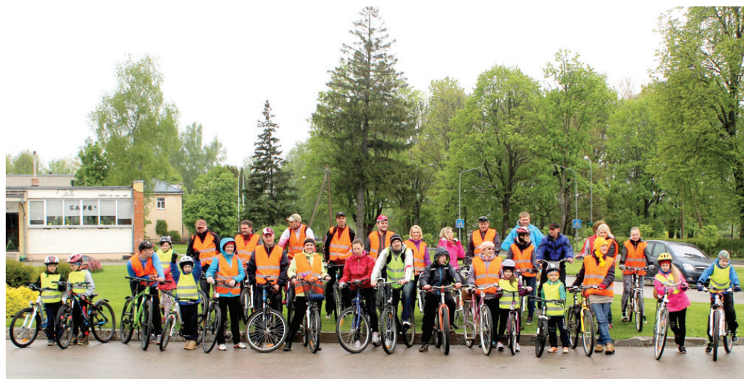
Ikgadējā pavasara velobrauciena dalībnieki pirms starta pulcējās Vecumnieku centrā.