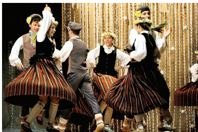
Misas vidusskolas 9. – 12. klašu tautas deju kolektīvs.