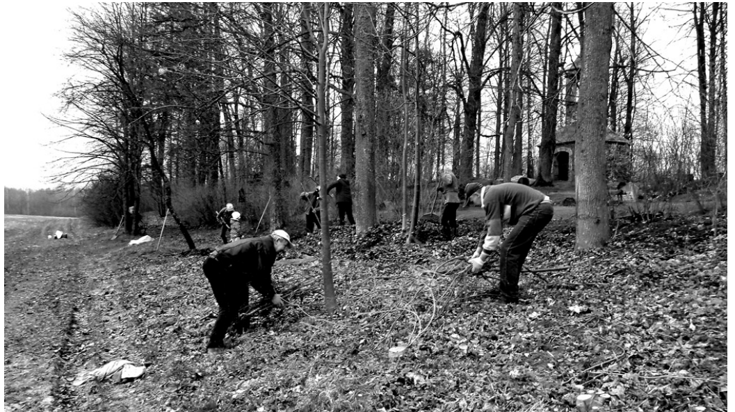
Talcinieki attīra Klīvu kapsētas ceļa malu no lapām un nozāģētajiem krūmiem.

Darbs ritēja līdz vēlai pēcpusdienai. Spēkiem izsīkstot, talcinieki apjauta, ka visu kap-