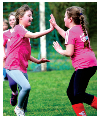
Rozā komandas spēlētājas emocionāli atzīmē vārtu guvumu.

Jau gadu futbola klubs «Iecava» dod iespēju Vecumnieku novada bērniem apgūt meistarību kājbumbas spēlē. Nodarbības apmeklē interešenti no Vecumniekiem, Bārbeles, Stelpes, Misas un Valles, divas reizes nedēļā trenējoties Vecumnieku vidusskolas sporta laukumā. Grūtāk ir treniņus organizēt ziemā, kad sporta zāles noslogojuma dēļ