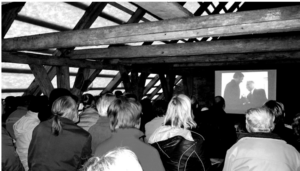
Dažādos laika posmos uzfilmēto materiālu par dzīvi Skaistkalnē vēroja ap 80 interesentu.

Vecākajai un brieduma paudzei šis vakars deva iespēju kavēties atmiņās par jaunību, dažādiem notikumiem ciema dzīvē – gan kolhoza laikiem, gan atmodas vēsmām. Cits citam sekoja amatieru uzņemti videostāsti par malkas talku skolā, kolhoza gada atskaišu sarīkoju-