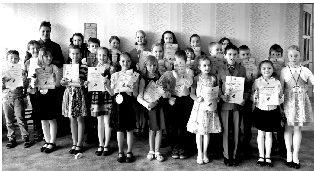
Raiņa un Aspazijas daiļradei veltītajā dzejoļu runas festivālā «Zvirbulis 2015» piedalījās bērni no visām novada skolām.

Vislabākie dzejoļu runātāji Vecumnieku novadā ir: Mar-