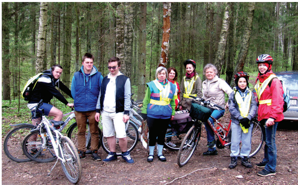
Velobrauciena dalībnieki pie Skaistkalnes karsta kritenēm.

Šim apvidum ar gleznaino ainavu Mēmeles līčos un lielā Vērdirņkroga paliekām ir raiba vēsture. Administratīvā piederība gadu ritumā vairākkārt