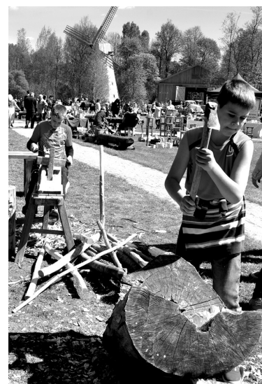
Puiši iemēģina roku kokapstrādes darbos.