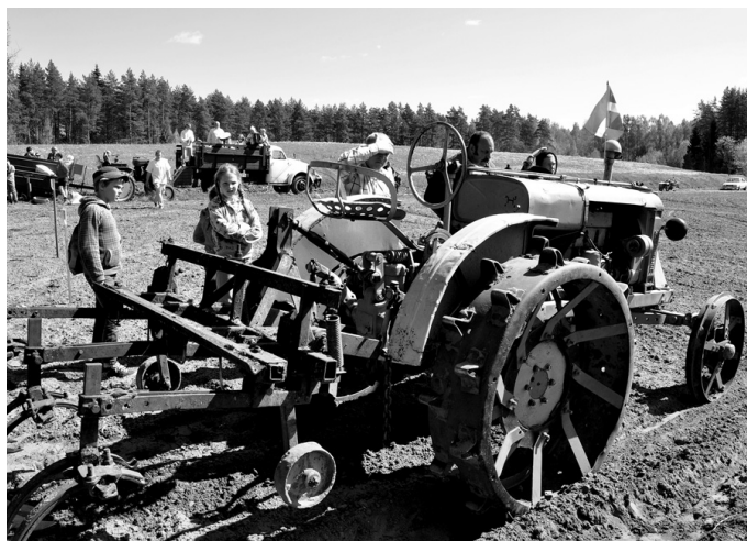
Gandrīz 90 gadu vecais traktors «Universāls» joprojām ir lielisks palīgs zemes apstrādes darbos.

dalībnieku pulkā, ar skaistām melodijām priecējot sarīkojuma apmeklētājus un uzmuntrinot amatniekus.