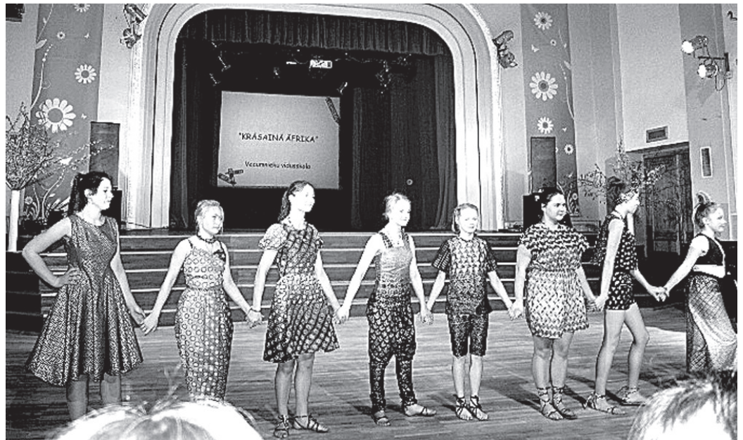
Vecumnieku vidusskolas meiteņu veidoto tērpu kolekciju «Krāsainā Āfrika» atzinīgi novērtēja gan žūrija, gan skatītāji.

Pēc izstādes apmeklēšanas muzejā visi dalībnieki tika ai-