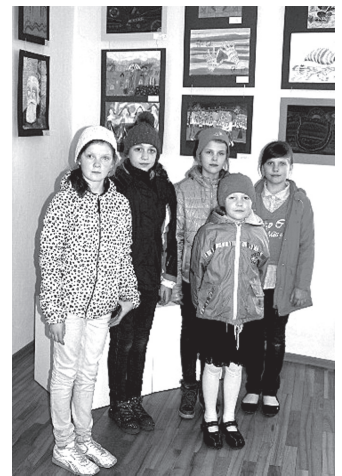
Vecumnieku vidusskolas jaunās mākslinieces Bauskas muzejā apskatīja gan savus, gan citu skolēnu radītos darbus.