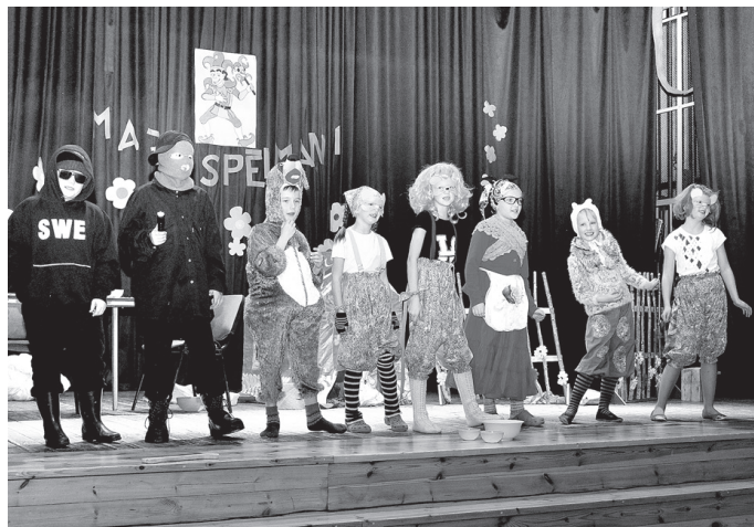
Vecumnieku vidusskolas 1. – 4. klašu teātra pulciņš «Ziķeri» izrādīja uzvedumu «Suns un kaķis».

Stelpes pamatskolas 5. – 8. klašu teātra pulciņam (Lilita Berliņa), kas bija uzvedis A. Grīniece lugu «Māllēpītes atmošanās», tika piešķirta nominācija «Muzikālākā un sirsnīgākā izrādē». Mūziku bija «apstrādājis» Dmitrijs Gridjuško. Uz skatuves darbojās: An-