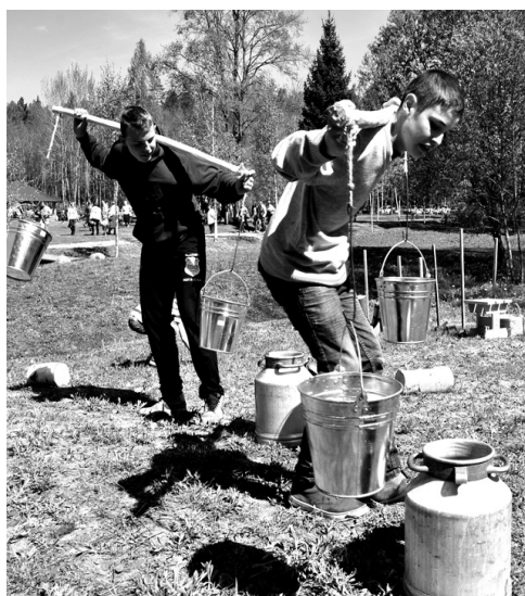
Izrādās, nest ūdens spaiņus ar nēšiem nav nemaz tik viegli.