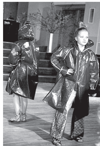
Oriģināla bija dalībnieču defilēšanas maniere.