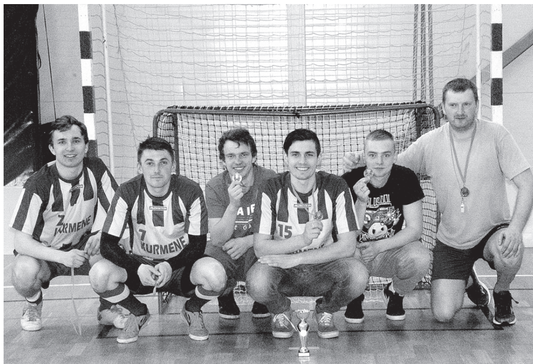
Kurmenes kausa izcīņā florbolā trešo vietu ieguva Vecumnieku novada komanda «Kurmene».