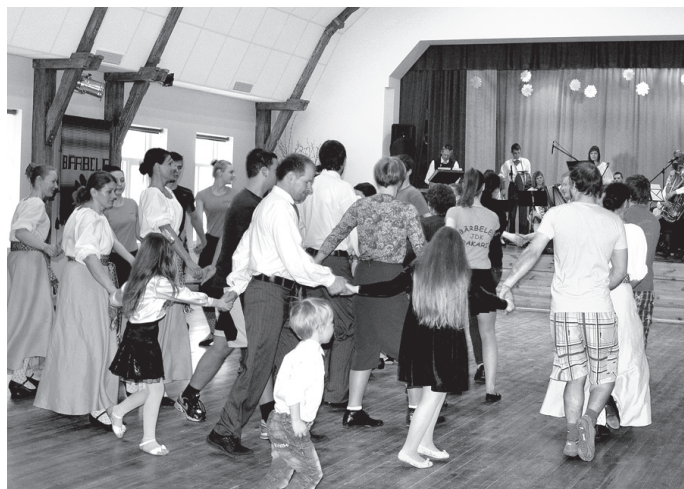
Klātesošie tiek iesaistīti dejā «Upe nesa ozoliņu».

Sarīkojuma apmeklētāji varēja izbaudīt mēģinājumu gaisotni un vērot, kā tiek apgūti deju soļi, veidoti skaisti latvju raksti, kā tiek izdziedātas un izspēlētas burvīgās latviešu tautas melodijas u. c. Tas ir process, ko skatītājs neredz, bet kapelas dalībniekiem un dejojājiem tā ir ikdiena. Parasti publika bauda tikai gala rezultātu, kur gan deja, gan dziesma ir jau gatavs priekšnesums. Kāds ir ceļš līdz skaistam deju solim un rakstam, labskanīgi pasniegtai dziesmai – to kolektīvu dalībnieki centās parādīt sarīkojumā «Satiec savu meistaru!».