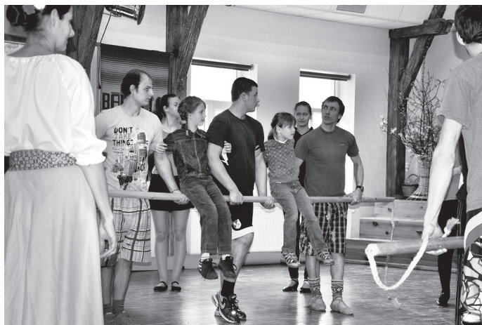
Izšūpojot bērņus, kopīgi izskan dziesma «Atnāca Lieldiena».

○ Amatiermākslas kolektīvi iedzīvina latviešu tautas tradīcijas