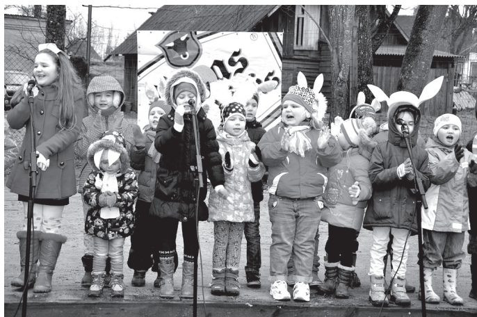
Tirgus laukumu pieskandināja Vecumnieku tautas nama bērnu vokālā ansambļa «Zīļuki» dalībnieku balsis.