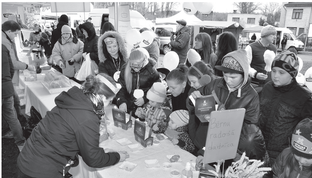
A/s «Latvijas maiznieks» teltī gardi smaržoja smalkmaizītes, ko bērni varēja garnēt un turpat notiesāt vai iepakot kastītē un nest uz mājām.