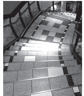
Tirdzniecības centrā «Mols» var apskatīt uzņēmuma meistarū veidotās kāpnis.

zaina vizītkartes, top interneta mājaslapa, tiek plānots izveidot reklāmu uz automobiļa. Pašlaik uzsvars tiek likts uz mazbudžeta mārketingu un darbu ar klientu «aci pret aci». Nekāda «spalvu spodrināšana» nelīdzēs, ja pakalpojums būs nekvalitatīvs un komunikācija – apgrūtināta.