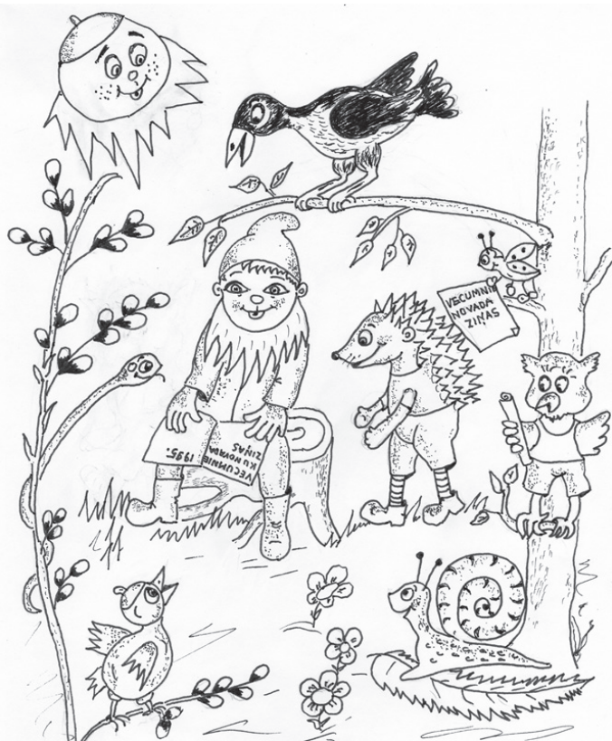
Zīmējums – GINA VIEGLIŅA-VALLIETE

«Jā, nebūtu «Vecumnieku Novada Ziņu» mēs neuzzinātu, kas notiek novadā,» domīgi saka Pēterītis un ierosina: «Tagad labāk parunāsim par svētkiem! Kā atzīmēsim dzimšanas dienu?»