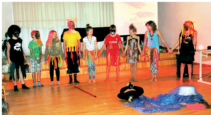
Āfrikas tautu tradīcijas attēlo un demonstrē mākslas programmas 2. un 3. klases audzēkņi.

Senās Ēģiptes dievu pielūgšanas rituālus un mūmijas