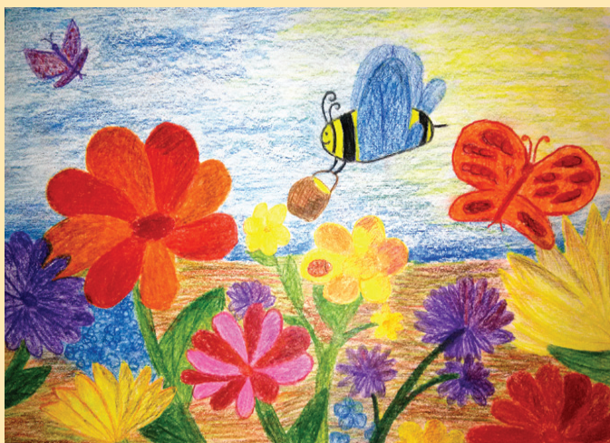
Katrīnas Lavrinovičas zīmējums.