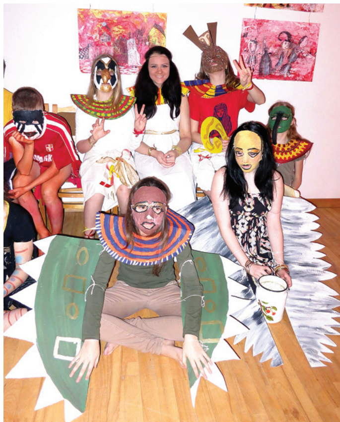
Ēģiptes saules reliģijas dievu maskas veidoja Vizuāli plastiskās mākslas programmas 5. un 6. klases audzēkņi.

2. un 3. klases audzēkņi izspēlēja ainiņu Āfrikas džun-