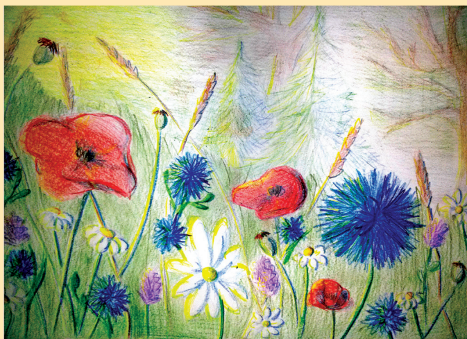
Robertas Paulas Tomsoņas zīmējums.