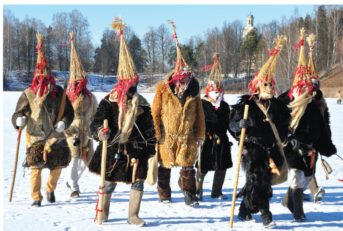
Folkloras kopas «Grodi» (Rīga) budēļi solīja, ka Vecumnieku novadā šis gads būs auglīgs.