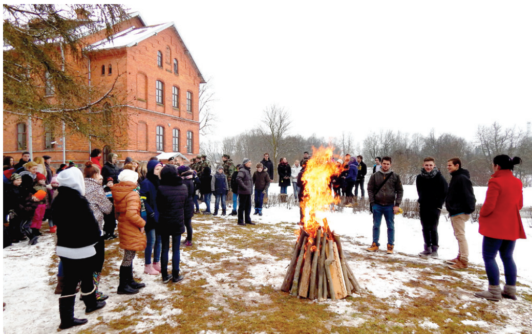
Pieminot 1991. gada janvāra barikāžu laiku, gaiši deg ugunskurs Skaistkalnes vidusskolas pagalmā.

○ Tiekas ar vēsturisko notikumu dalībnieku