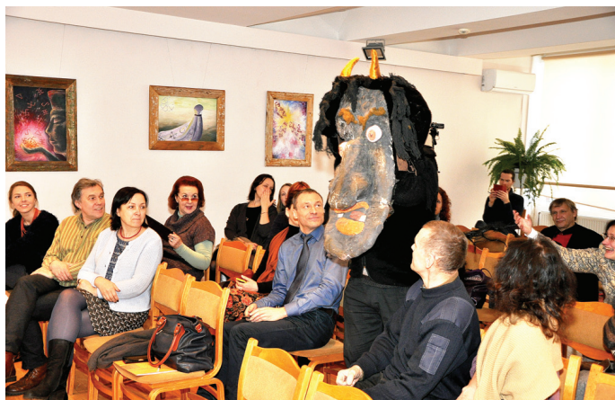
Masku konferencē Lietuvas pārstāvji izrādīja pat pašu Velnu!