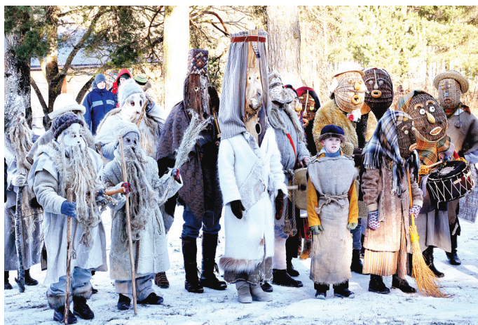
Folkloras kopu «Rāmupe» (Katlakalns) un «Delve» (Limbažu novads, Vidriži) dalībnieki atveidoja viedos, veļu laikam raksturīgos tēlus – vecišus, bet ar izdomu pārsteidza «Vīteri» (Rēzekne), kas čigānos iet, maskējušies ar groziem.

Par rituāliem un izmaiņtājiem apziņas stāvokļiem uz diskusiju aicināja transperso-