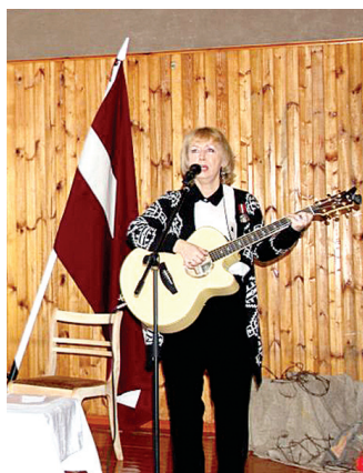
Skolā viesojās Atmodas laika aktīviste, dziedātāja Ieva Akurātere.

Ieklausoties Ievas Akurāteres izpildītajā dziesmā, ir patīkami apzināties, ka varam ru-