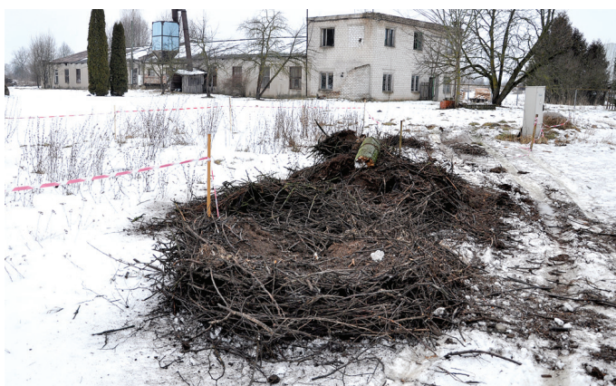
Bārbelē pie daudzdzīvokļu mājām tika demontēts trīskāju elektrolīnijas balsts, uz kura atradās stārķa ligzda.

Pirms vairākiem gadiem gaisvadu elektrolīnija centrā tika rekonstruēta, elektrības vadi no trīskāju balsta bija noņemti, bet lielajā ligzdā neviena netraucēti turpināja dzīvot baltie stārķi. Kad putnu mājvieta pirms pāris gadiem bī-