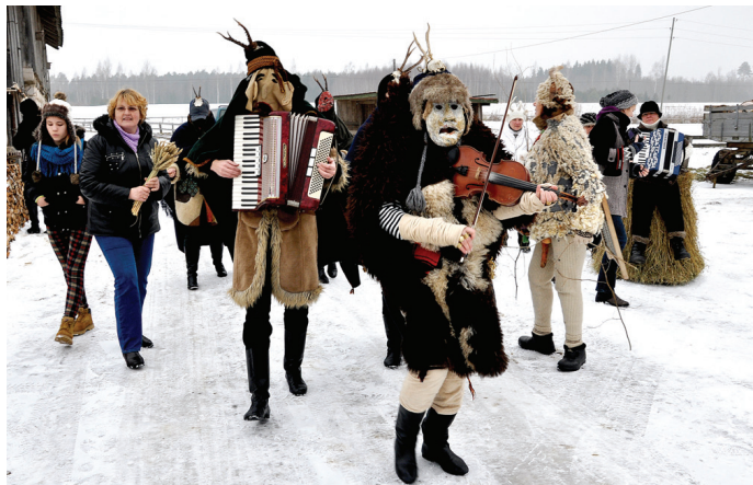
«Skandinieku» buki pierībināja un piedziedāja Kurmenes pagasta «Saliņu» sētu.