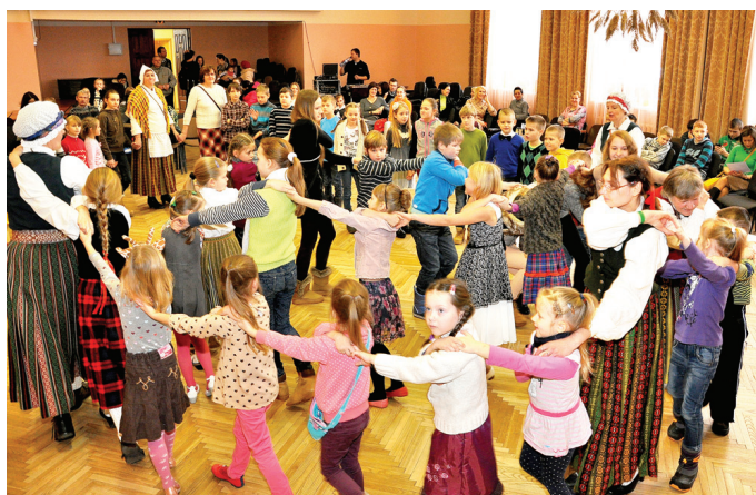
Bērnu rīta dalībniekus rotaļā ved Bārbeles folkloras kopas pārstāvji.