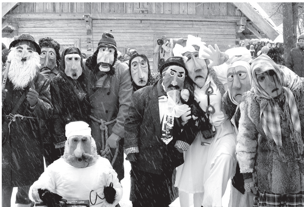
Kupišķu folkloras kopa «Kupkemis» (Lietuva).

Festivālā piedalīsies kupls pulks grupu no Latvijas novadiem: Tārgales līvu folkloras kopa «Kāndla» (masku tradīcija – Sāmsalas ķekatnieki), Rīgas folkloras kopa «Grodī» un draugi (Budēļi, Ķekatas), Olaines folkloras kopa «Dzedzieda» (Budēļi), Vidrižu folkloras kopa «Delve» (Vecīši),