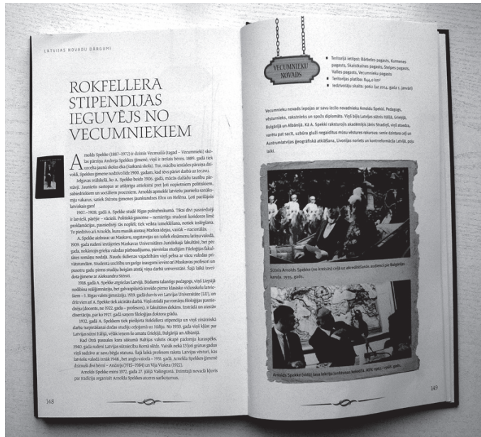
Grāmata «Latvijas novadu dārgumi» glabā stāstu par vienu no Vecumnieku novada vērtībām.

«Cik daudz pašciens un cik dziļa mīlestība plūst no katras lapaspuses! Arī šādā veidā, gabaliņu pa gabaliņam vien, var uzbūvēt mūsu vienīgo, neatkārtojamo Latviju. Pa-