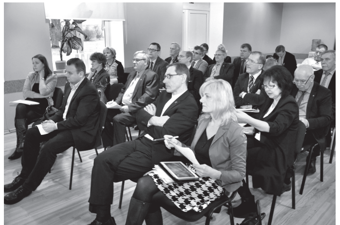
Attīstības padomes sēdes ik mēnesi notiek kādā no pilsētām vai novadiem. Šo praksi atzinīgi vērtē visi Zemgales plānošanas reģiona pašvaldību vadītāji.