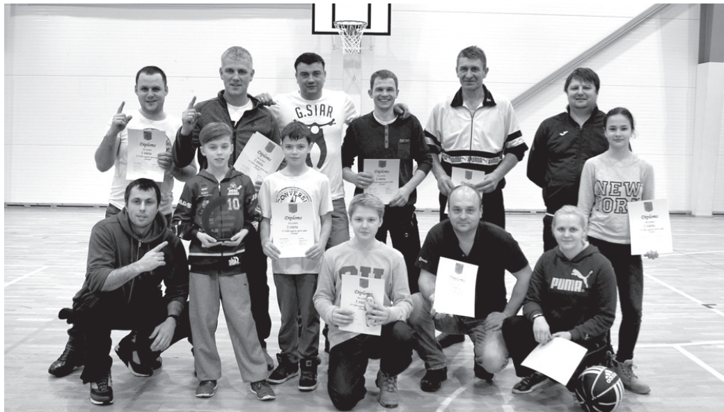
Turnīrā «Trīscīņā» par uzvarētājiem kļuva komandas «Taurkalne» pārstāvji.