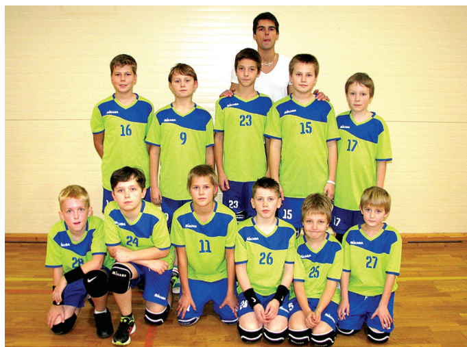
D2 zēnu komanda LVF rīkotajā Jaunatnes kausa izcīņā volejbolā fināla sešinieka ieguva 6. vietu.