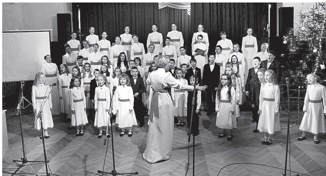
Jauniešu koris «Via Stella» ar mākslinieciski augstvērtīgu koncertprogrammu atzīmēja kolektīva 18. dzimšanas dienu.