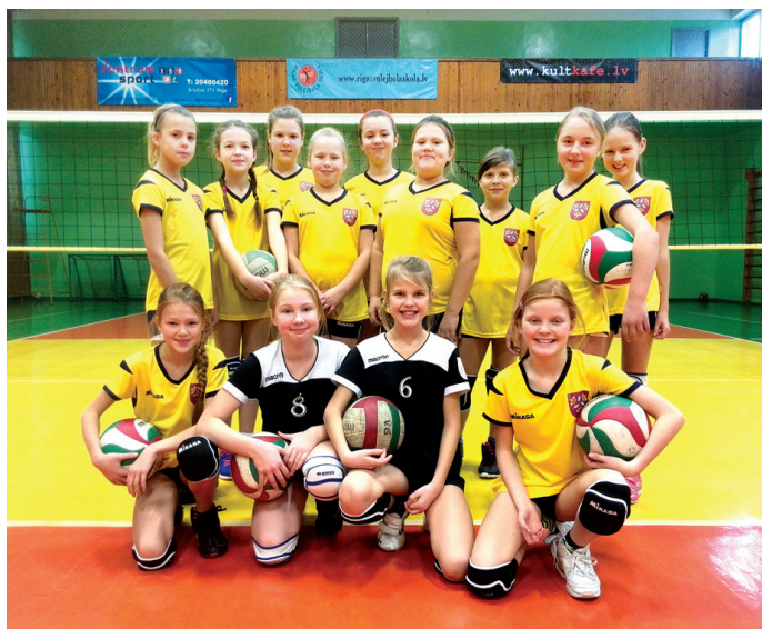
D2 meiteņu komanda LVF rīkotajā Jaunatnes kausa izcīņā volejbolā fināla sešinieka izcīnīja 5. vietu.