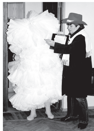
Tā kā laukā sniega nebija, klātesošajiem tika piedāvāts iegādāties «sniega kaudzi».