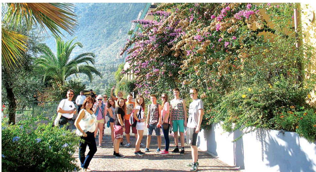
Simfoniskā orķestra «Draugi» dalībnieki un pedagogi steidz baudīt apkārtnes jaukus Limone sul Gardā.

punkts tiks sasniegts tikai ap pulksten diviem naktī. Cauri tumsai var redzēt gaismiņas māju logos, tad ceļš sašaurinās un parādās mazi kalnu tuneļi. Brīžiem sametas bail, cik tie ir šauri un zemi. Dažos pat divas mašīnas nevar samainīties, kur nu vēl autobusi!