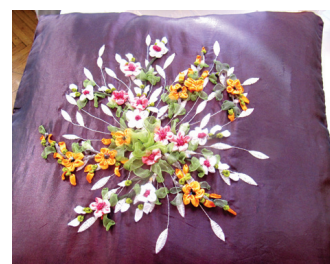
Lentīštehnika izšūts spilvens.

arī radoša nozīme. Tās bija svarīgas visa ciema dzīvē. Viņaspāt, šie sirsnīgie svētki apliecināja, ka mēs kopā mākam gan priecāties, gan pateikties, sadarboties un dalīties.