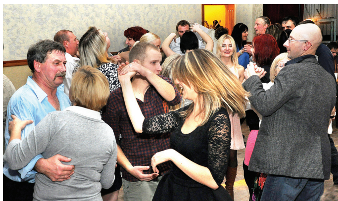
Pašdarbnieku balle bija jautra un kupli apmeklēta.