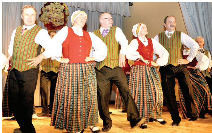
Senioru deju kolektīvs «senValle» izrāda priekšnesumu «Es kādreiz Talsos aizbraucu».

izrādītājam situācijām, kādās nonāk ģimene, ja fotogrāfs, kuram jāapmeklē daudz bērnu saime, un valsts apmaksāts vīrietis, kuram jāpalīdz dāmai tikt pie mazuļa, sajauc dzīvokļa durvis.