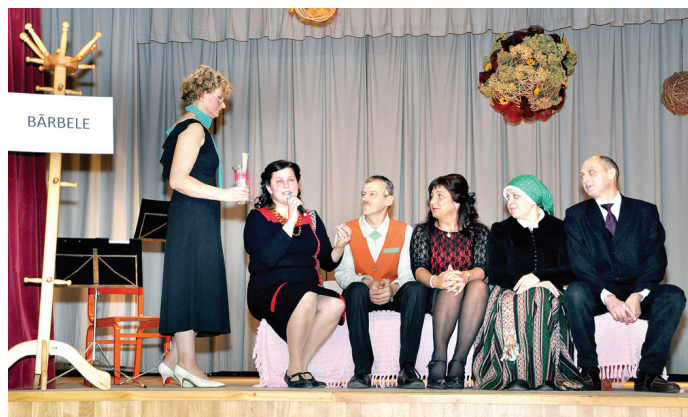
TV raidījumā «Kultūras dīvāns» viesojas Bārbeles tautas nama pārstāvji.