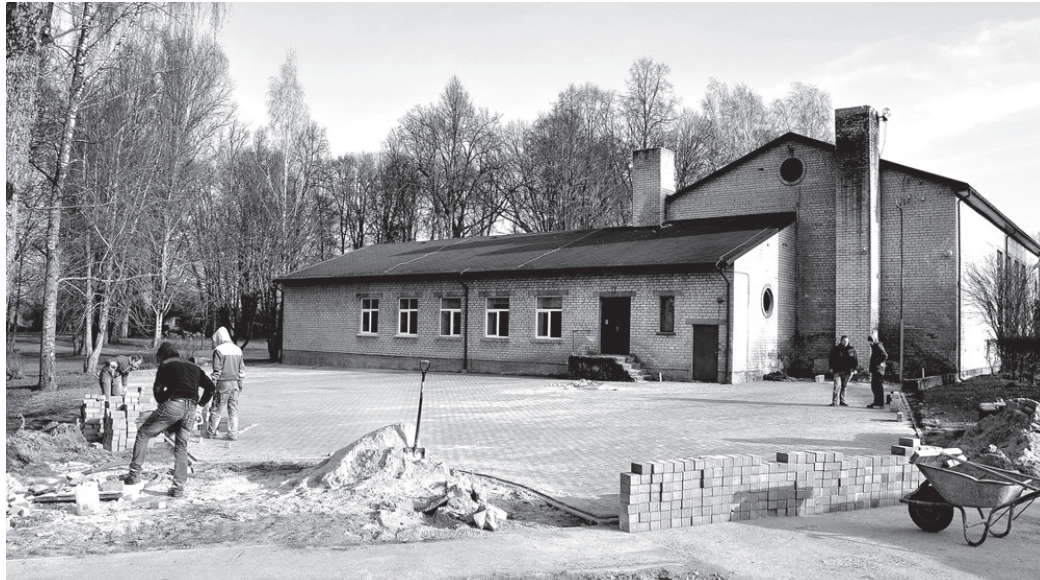
Automašīnu stāvvietu pie Vecumnieku tautas nama izbūvēja SIA «Firma ACER». Bruģa ieklāšanas darbus veica četri uzņēmuma darbinieki.

○ Pašvaldībai rūp sarīkojumu apmeklētāju ērtības