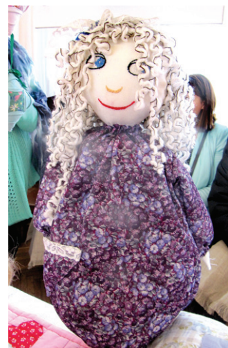
Šis lelles uzdevums ir glabāt iepirkuma maiņiņus.