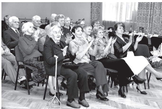
Skatītāji un apsveicēji aktīvi dzīvoja līdzī deju priekšnesumiem.

lējumus būt tikpat kustīgām un lustīgām arī turpmāk.