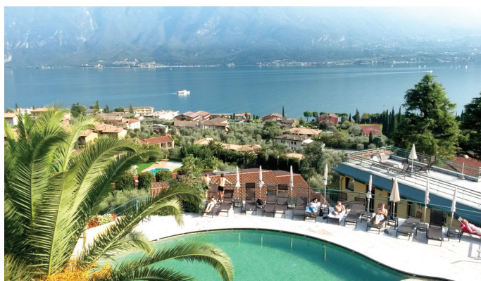
Pa viesnīcas logu paveras brīnišķīga ainava.

Pēc garā brauciena šo dienu pilnībā var veltīt vietas apskatei un ainavu baudīšanai. Vispirms ceļš ved lejā uz Gardas ezeru. Ejojot pa mazajām ieliņām, liekas, ka acis plešas arvien platākas – efeju dzīvzogi, olīvkoki, citronkoki, hurmas, dažādu sugu palmas un ziedi. Nevien mazais zemes stūrītis nav atstāts bez ievēribas. Tie, kuri vēlas, ar kuģi dodas iz-