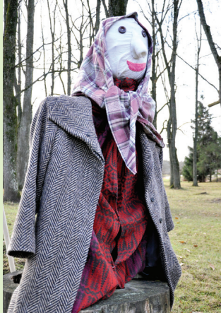
Bārbeliešu Garā sieva.

Ar dziesmām, dejām un rotaļām Bārbeles centrā 9. novembrī tika sagaidīta Mārtiņdiens, kas iezīmē rudens beigas un ziemas sākumu.