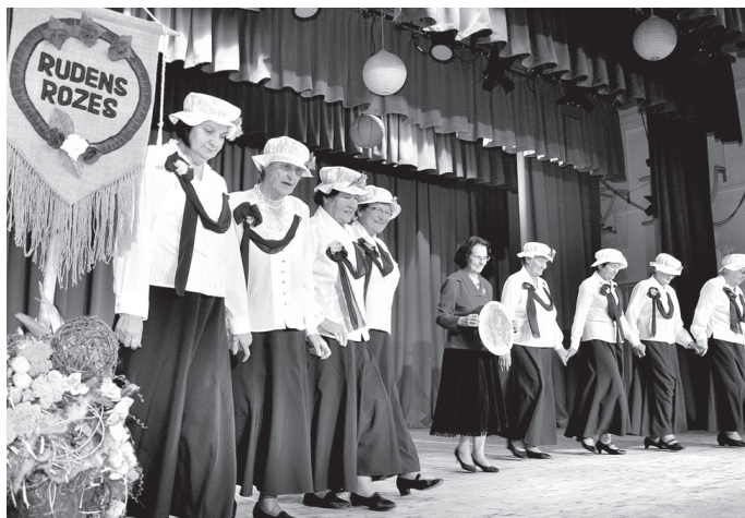
Koncerta «Aizdejoti pieci gadi» noslēgumā «Rudens rozes» izpildīja deju «Paldies latīņam».

Jubilāres saņēma apsveikumus, ziedus, dāvanas un vē-