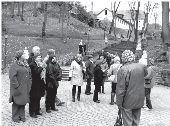
Ceļotāji apskatīja Cēsu pils apkārtni.