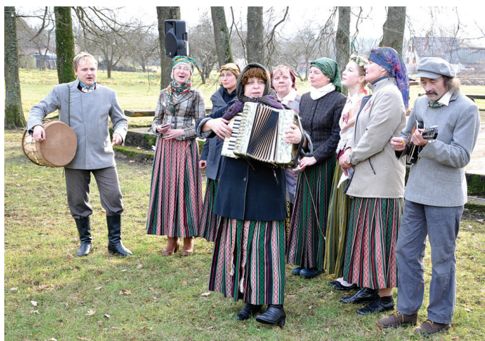
Mārtiņdienu iespēlēja un iedziedāja Bārbeles folkloras kopas dalībnieki.