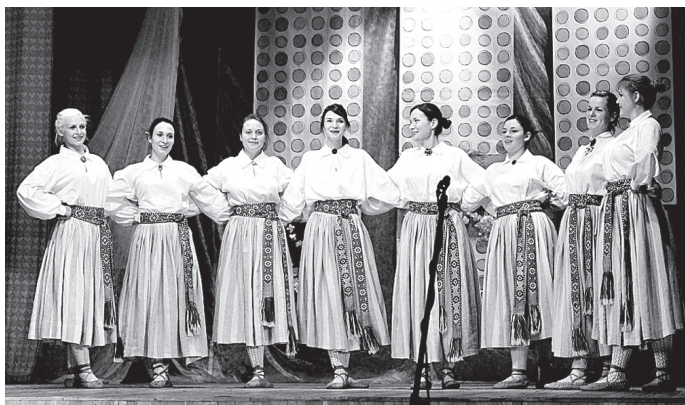
2012. gada absolventes izpildīja deju «Auga, auga Rūžeņa».

Jubilejas svinības izskanēja ar Misas vidusskolas skolotāju izpildīto J. Lūsēna un M. Zālītes dziesmu «Nē, manis nav». Pēc tam svētki turpi-