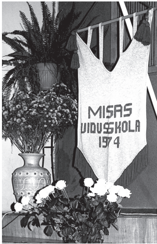
Svētkos goda vietā bija Misas skolas karogs.

Misas vidusskolas absolventi, esošie un bijušie skolotāji un viesi jubilejas salidojumā pulcējās Misas tautas namā 11. oktobra vakarā.