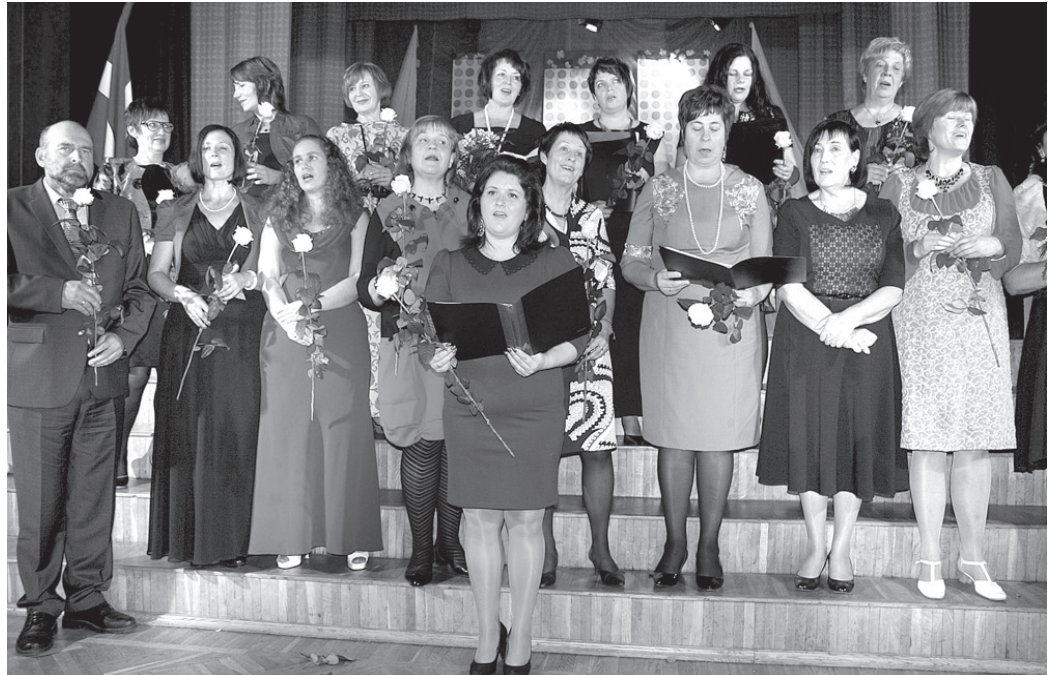
Sarīkojuma noslēgumā pedagogu koris izsaka cerību par nākamo sirsnīgo tikšanos.

«1974. gadā Misas skola vēra durvis skolēniem un skolotājiem. Līdz tam bērni mācījās