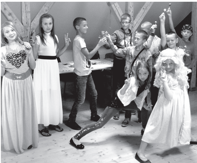
«Zvaigžņu konkursa» dalībnieki un žūrija.