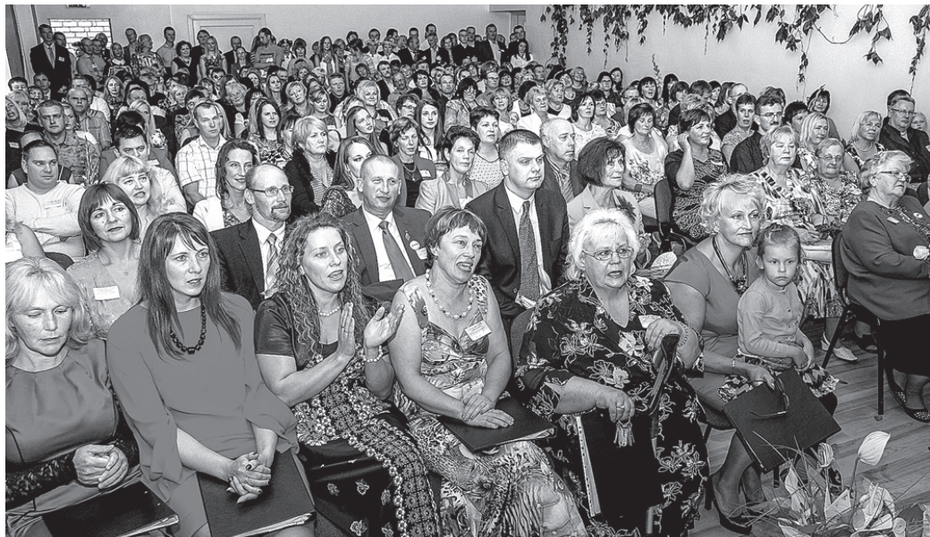
Valles skolas 50 gadu jubilejas svinības bija kupli apmeklētas.

Valles skolas 50 gadu jubilejas svinībās 23. augustā satikās absolventi, izglītības iestādes bijušie un pašreizējie darbinieki.