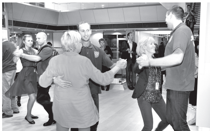
Pūtēju orķestra «Skaistkalne» puīši, nolikuši malā mūzikas instrumentus, aicina Gaismas pils darbinieces iemēģināt jaunās ēkas grīdu.