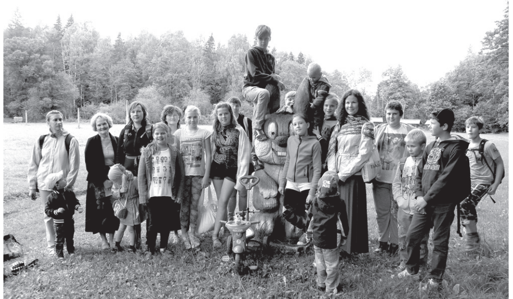
Pavisam ceļojumā devās 32 ekskursanti, lielākā daļa no viņiem – Misas bibliotēkas čaklākie lasītāji.

Muižas staļļa telpās izveidots Zvanu muzejs pārsteidz ar bagātīgo kolekciju. Valda Jākobsona īpašumā ir ap 1000 dažādas izcelsmes, vēstures,