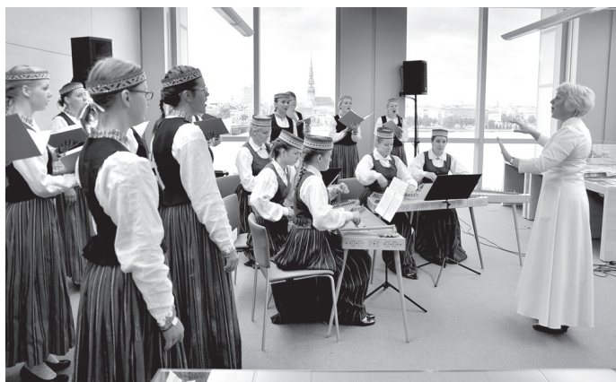
Stendera lasītavu pieskandina jauniešu kora «Via Stella» dziedājums.

○ Novada dienā lepojas ar kultūras tradīcijām