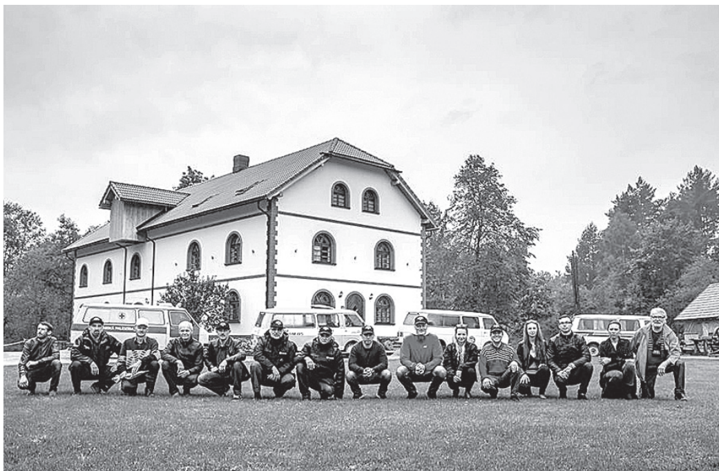
Ekspedīcijas «Ar «Latvijām» pa Latviju» dalībnieki apmeklēja brīvdabas muzeju «Ausekļu dzirnavas» Bārbeles pagastā.