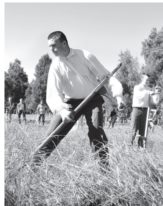
Pļaujas svētkos vīri asina izkaptis un dodas labības laukā.

Amatnieki no Latvijas reģioniem, kā allaž, demonstrēs prasmes un interesentiem pašiem ļaus izmēģināt dažādus arodus. Visi, kas interesējas par zedeņu jeb klūgu žogu pīšanu, to varēs apgūt pieredzējušu meistarību. M. Mediņš at-