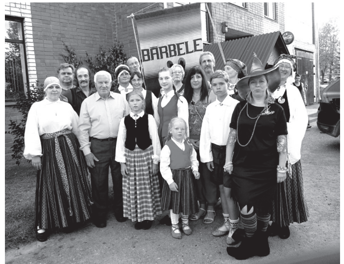
Bārbeles folkloras kopa «ēdamo» pagastu saietā piedalījās pirmoreiz.

Ik gadu sarīkojuma organizatori liek kopā prātus, izdomu un visas prasmes, lai tikšanās būtu saistoša un lai ciemiņi aiz-