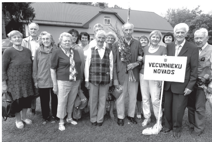
Daļa Vecumnieku novada pārstāvju pirms došanās uz estrādi.

Svētku koncertu sniedz Latvijas Nacionālās operas solisti,