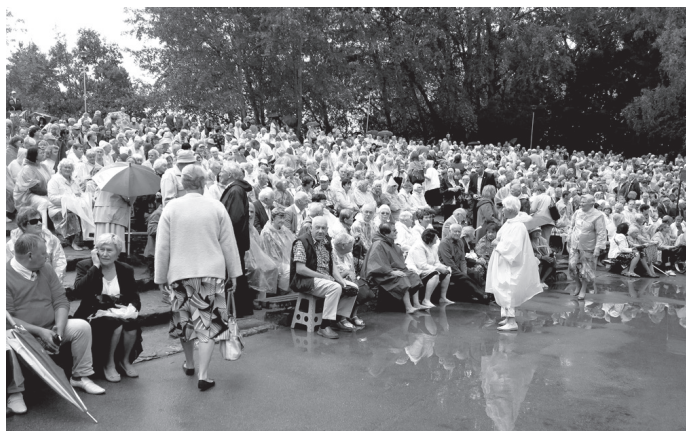
Ikšķiles estrādē sapulcējušos ļaudis lietus nespēja aizbiedēt.

Gaisā jūtama smaga un karsta tveice, kad 16. augusta pusdienlaikā iebraucam Ikšķilē, kur jau 16. gadu pulcējas politiski represētie, viņu radi, draugi un simtiem ļaužu no visiem Latvijas novadiem.