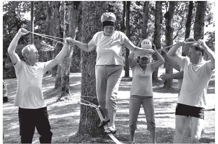
Dejotāji labprāt iesaistījās sportiskās aktivitātēs.