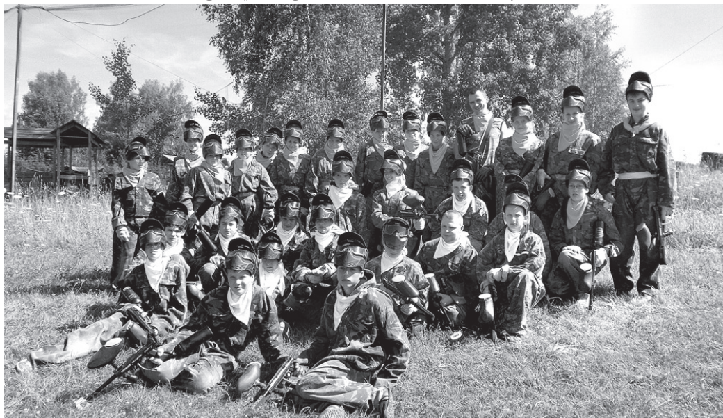
Nometnes dalībnieki sagatavojušies peintbola spēlei.

○ Daudzveidīga programma, saliedējošas aktivitātes