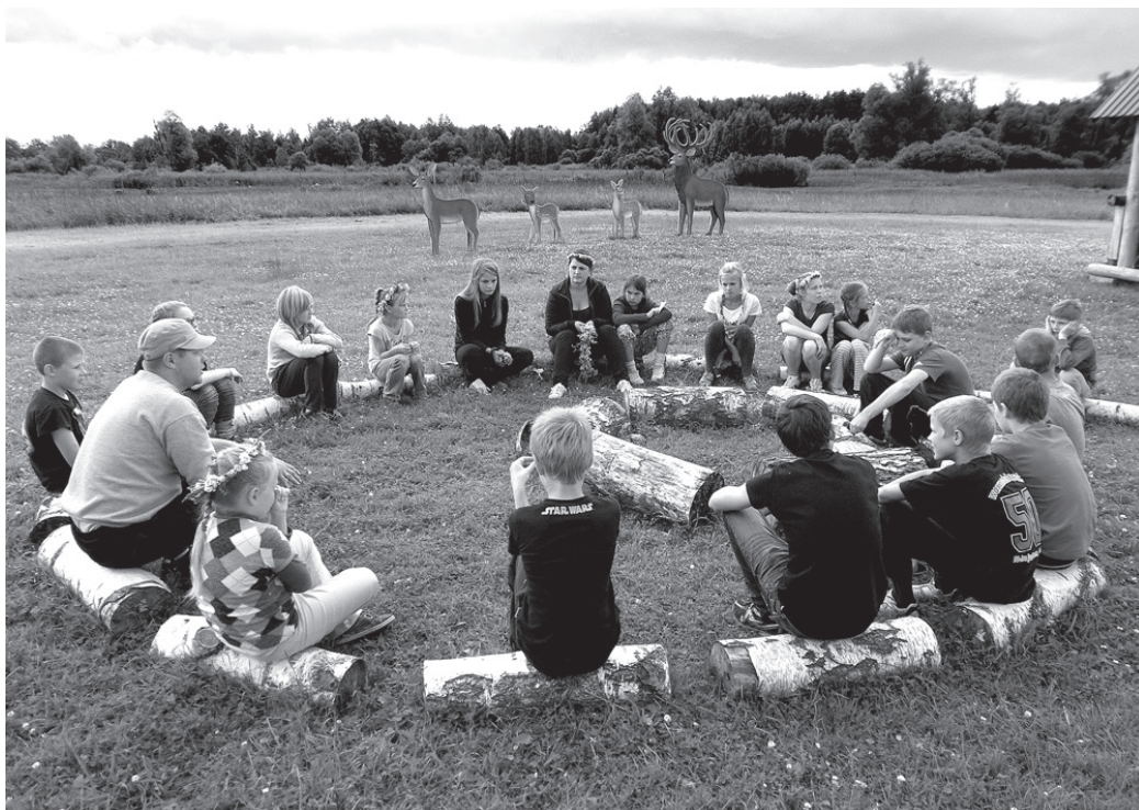
Aktuālu jautājumu pārspriešana «Mammas Dagmāras parka» briežu dārzā.

saistoties nodarbībās, kas attīsta radošo domāšanu. Nometnes dalībnieki veidoja no 50 iepriekš nosauktām lietām savu komandu karogus. Vakars noslēdzās pie Stelpes karjeru ūdenskrātuves, kur nometnes pēdējā dienā norisinājās aktivitātes ar šķēršļu joslām un