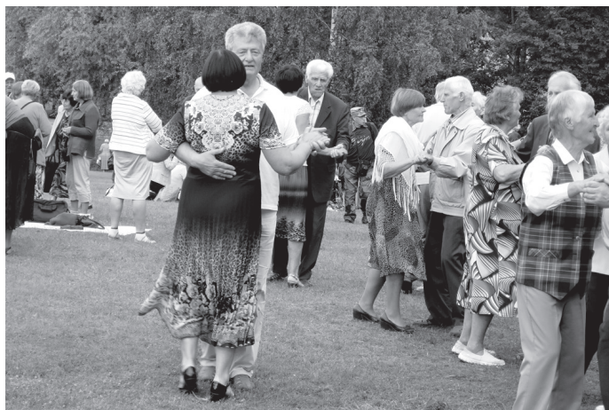
Salidojuma dalībnieki dejoja zaļumballē gluži kā savās jaunības dienās.