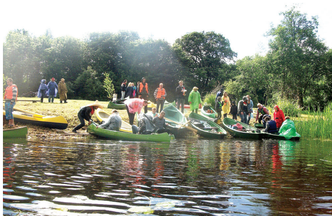
Laivošanā iesaistījās arī Manguļu ģimene un jaunie mūziķi.