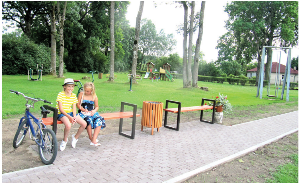
Labiekārtotos gājēju celiņus Skaistkalnes centra skvērā atzinīgi vērtē pagasta dažādu paudžu ļaudis.

Darbus veica SIA «Kvintets M». Iedzīvotāji ievēroja, ka uzņēmuma vīri strādāja rūpīgi, ātri, bez liekām «pīppauzēm», tādēļ savstarpējās sarunās viņu attieksmi pret uzticē-