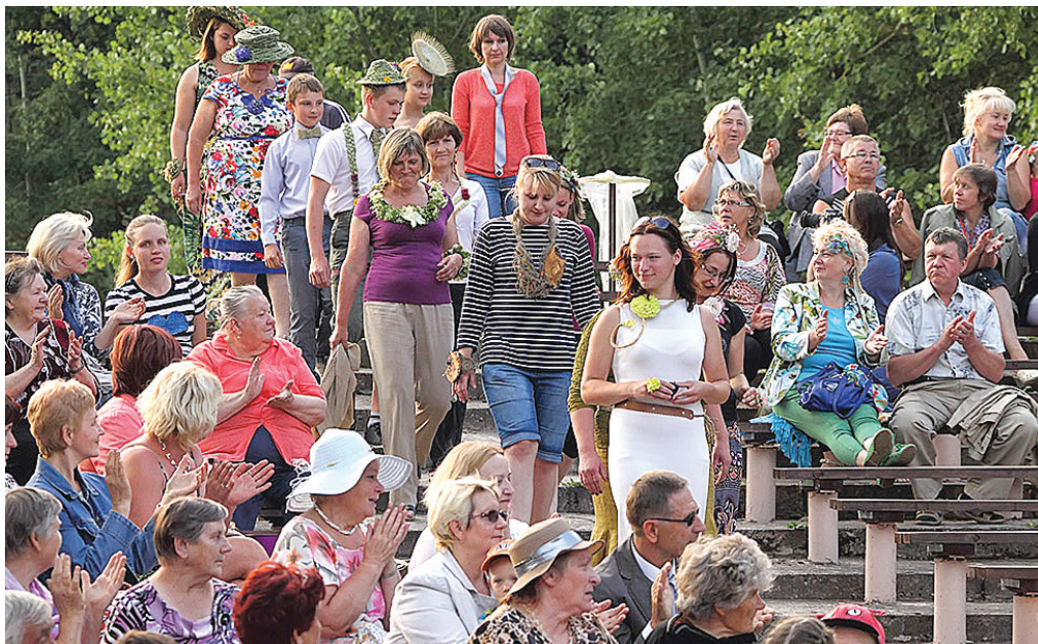
Pirms apbalvošanas ceremonijas floristi izrādīja dienā darinātos rotu komplektus.

Dalībnieki rītu uzsāka, pie tautas nama izvietojot mājas darbu – interjera objektu «Sauls lokā – gaismas lokā». Šī gada darbus raksturoja gaišums un saulainums, kā arī labs tehniskais risinājums. Dienas gaitā floristi skatītāju un žūrijas klātbūtnē veidoja florālu rotu komplektu «Greznākās rotas krāšņākie stāsti». Darinājumi bija koši un skaisti, turklāt profesio-