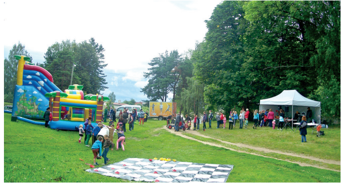
Vecāki kopā ar bērniem 20. jūnijā labprāt apmeklēja draudzes rīkoto atpūtas pēcpusdienu plāvē pie Vecumnieku baznīcas.

Šī gada nodarbību tēma bija «Jēzus mīlestība», tāpēc arī mēs savā starpā izrādījām mīlestību viens otram, kā arī dāvājām to citiem, sniedzot koncertu bēr-