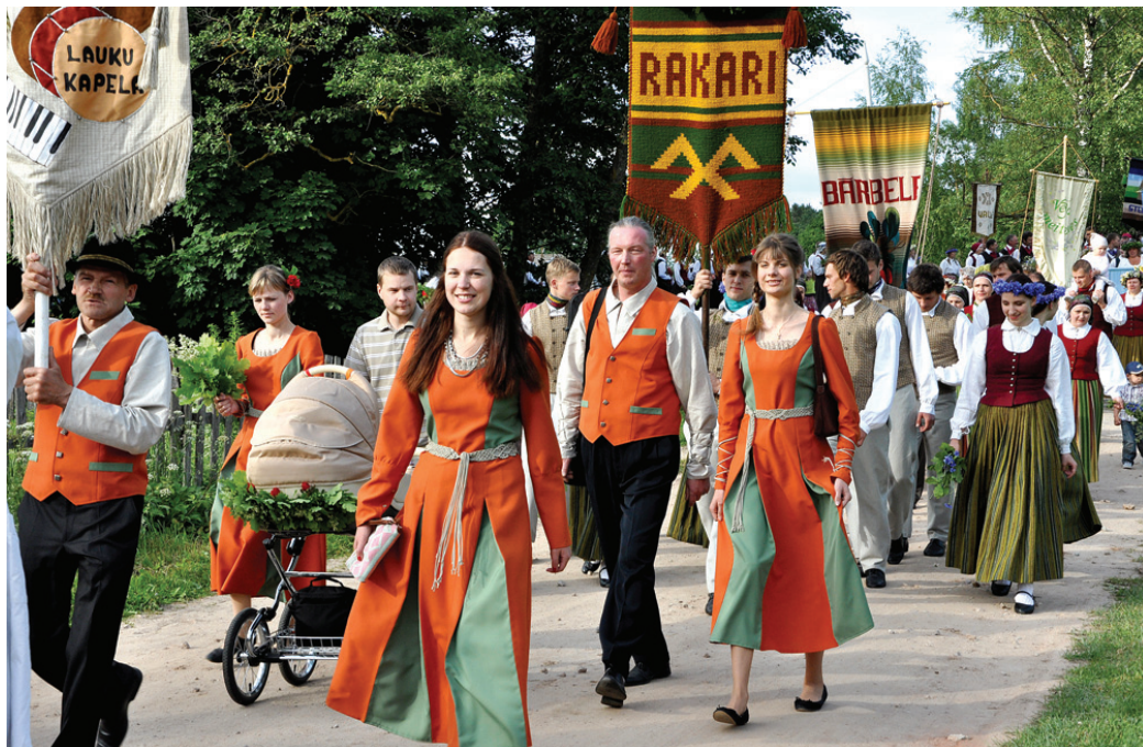
Gājienā Bārbeles tautas namu pārstāvēja lauku kapela «Savējie», deju kolektīvi «Rakari» un «Bārbele».

V. Vaina pirms svētkiem bažījās ne tik ļoti par dejojā