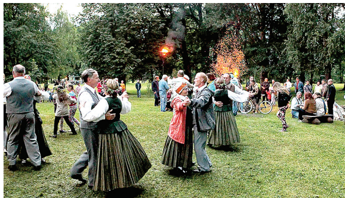
Dejotāji sniedza priekšnesumus un palīdzēja apgūt rotaļdejas.

Šo svētku galvenie simboli – uguns, zāļu rota un rotaļdejas. Uguns ir svēta, jo tā savieno redzamo un neredzamo pasauli, debesis un zemi, cilvēku un kosmosu, dabu. Caur ziedojumu ugunij tiek godāti neredzamie spēki. Uguns ir jāgodā. Ja vēli sev un citiem veiksmi, izdošanos, tad sagaidi saules lēktu, kad gaisma svin uzvaru pār tumsu!