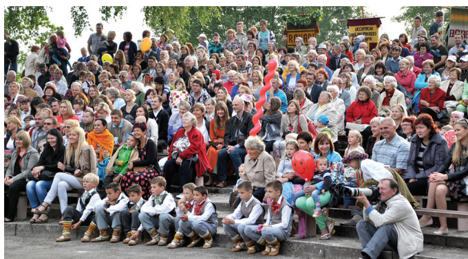
Svētki vieno lielus un mazus!