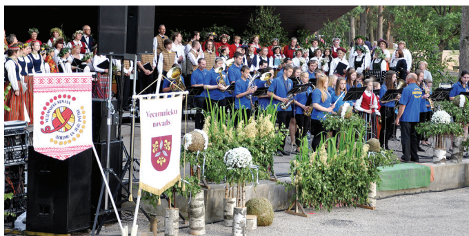
Par skaņīgumu gādāja arī pūtēju orķestris «Skaistkalne», vokālo ansambļu un kora dziedātāji.