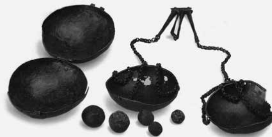
Mežotnes bronzas svariņi un atsvariņi, 11. gs.

Monētu kaltuve pastāvēja no 1575. līdz 1780. gadam Jelgavā.