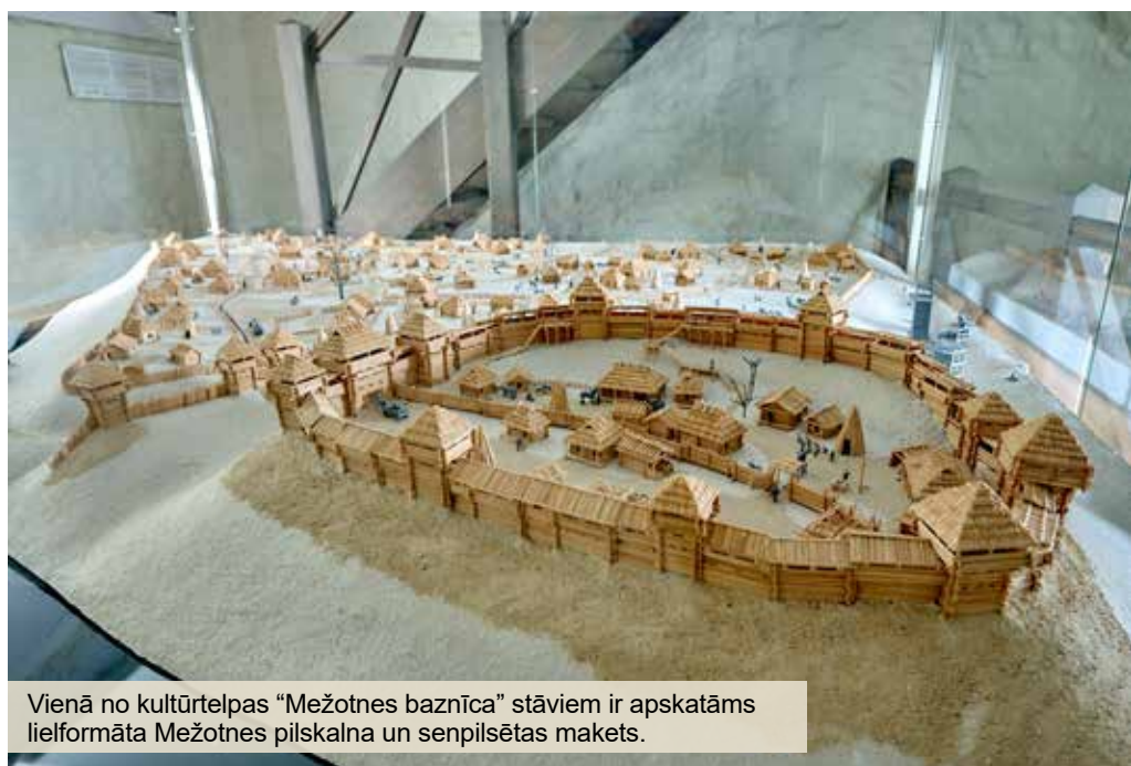
Vienā no kultūrtelpas "Mežotnes baznīca" stāviem ir apskatāms lielformāta Mežotnes pilskalna un senpilsētas makets.