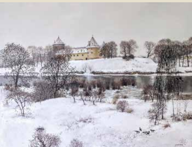
T. Paļčuk. "Bauskas pils", 2024. Bauskas pils muzejam dāvētā glezna.

Iesaku izbaudīt kamerstila koncertus Mežotnes mazajā pilī un mūziķa Igo "Ceplī". Arī Bauskas pils regulāri priecē ar senās un kamermūzikas koncertiem. Savukārt Bauskas muzejs ar teicamu ekspozīciju un pastāvīgi mainīgām mākslas izstādēm, kā arī Rundāles pils interjeri un skaistais parks ir vietas, kuras iesaku iekļaut ceļojuma plānos.