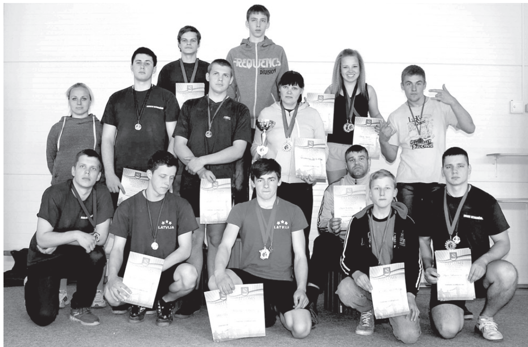
Latvijas kausa izcīņas otrā posma sacensībās Vecumnieku novada pārstāvji kopvērtējumā izcīnīja 2. vietu.

Pieaugušo konkurencē svara kategorijā līdz 95 kg kārtējo reizi «duelis» norisinājās starp