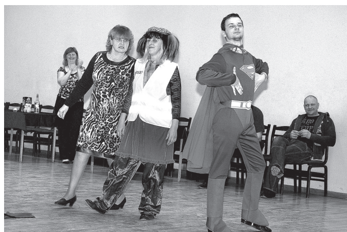
Amatierteātra «Kurmene» dalībnieki izspēlēja Supermena «varoņdarbus».