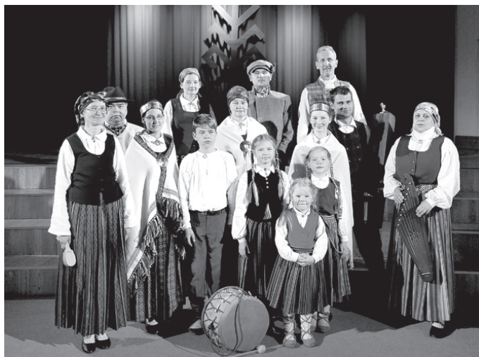
Bārbeles folkloras kopas dalībnieki pēc skates Dobelē.