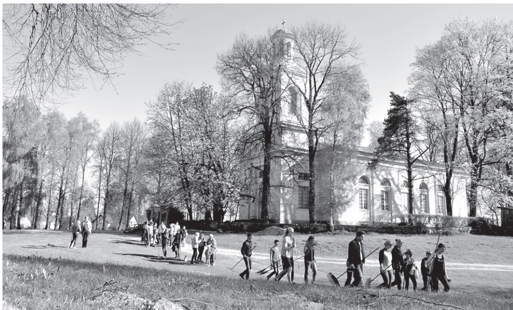
Lielās talkas dienā, 26. aprīlī, Vecumnieku baznīcas apkārtnē tika veikti vēl pēdējie sakopšanas darbi pirms lielkoncerta.