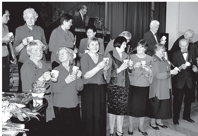
Kora dalībnieki priecājas par skaisto dāvanu – krūzēm.