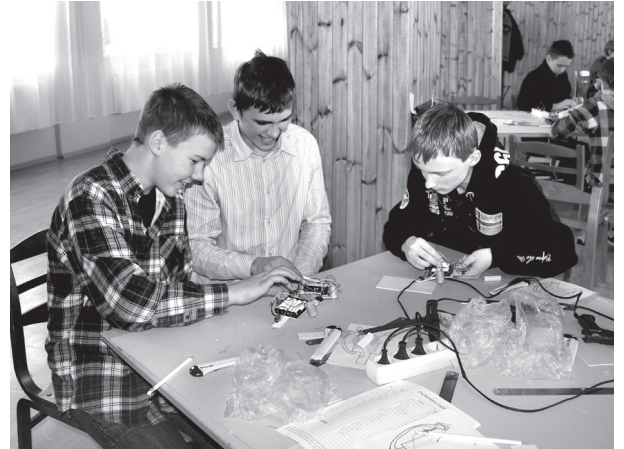
Ar interesi darbojas Skaistkalnes vidusskolas zēni.