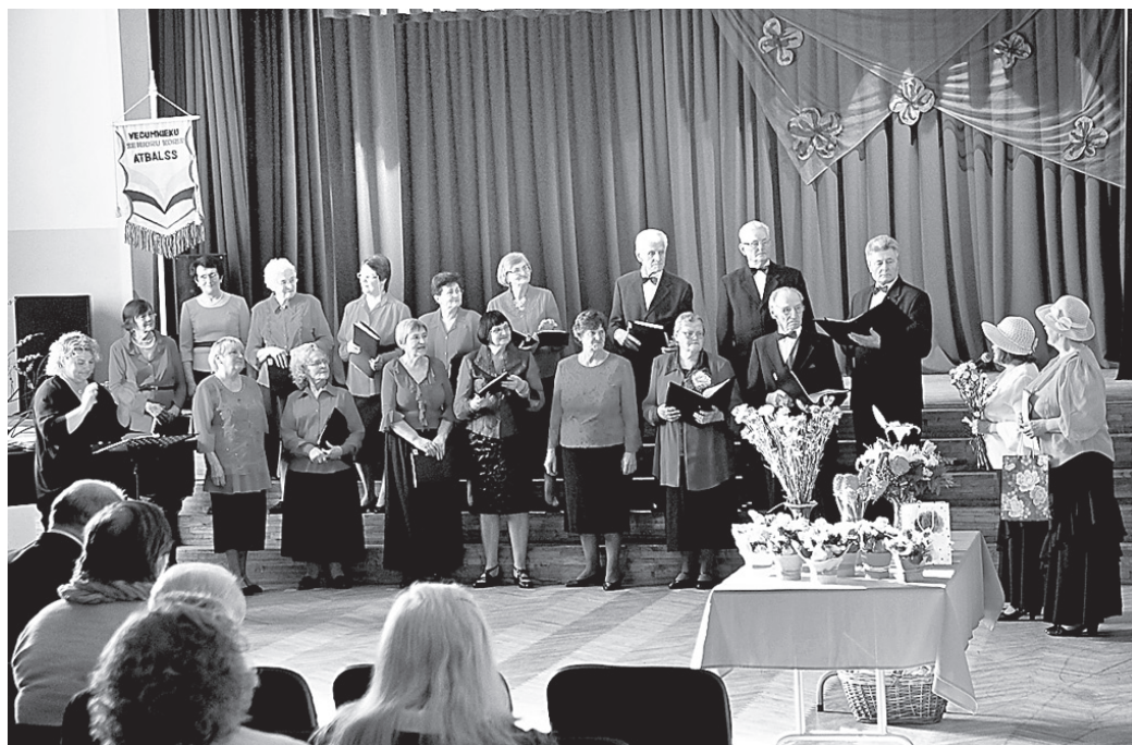
Piecu gadu jubilejas sarīkojumā Vecumnieku tautas nama senioru koris «Atbalss» gan dziedāja, gan saņēma apsveikumus.

M. Lagzdiņa daudziem teica lielu paldies, jo kolektīva