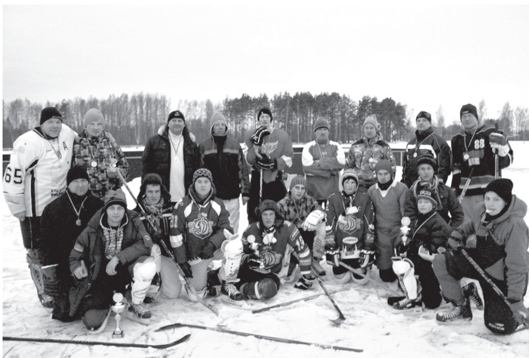
Novada atklātā čempionāta hokejā pirmā posma sacensībās godalgotas vietas ieguva komandas «Kurmene», «Vecumnieku karaļi» un «Rēdlihs».