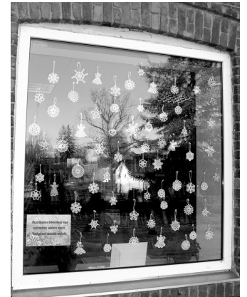
Kopš Sveču dienas bibliotēkas logus rotā senioru kopas «Saulgriezes» darinātie rokdarbi – sniegpārslīņas un eņģeļi, kas ienes gaišumu un siltumu bibliotēkas apmeklētāju sirsniņās.

Skaistkalnes pagasta bibliotēka ir vieta, kur ikviens allaž ir gaidīts. Te valda ro-