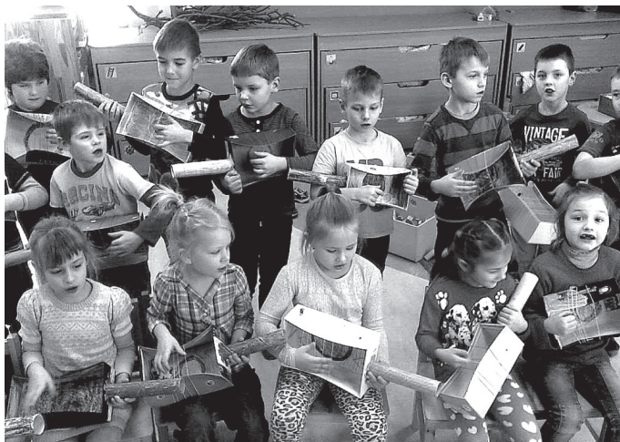
4. grupas bērni ar pašgatavotām ģitārām.

Paši lielākie bērni 4. grupā, skolotāju D. Landorfā un