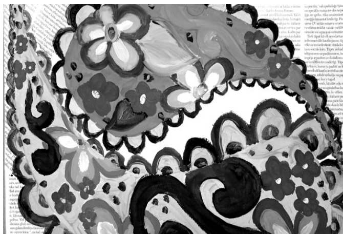
Vecumnieku vidusskolas 9.b klases audzēknes Zanes Urbānes darbs.

piādē Vecumnieku vidusskolā no 5. līdz 9. klasei piedalījās 31 audzēknis. Prieks, ka talantīgu un radošu bērnu ir tik daudz.