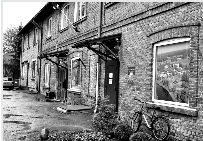
Bibliotēkas logi vakaros tiek aizklāti ar žalūzijām, ko rotā skats uz Skaistkalni no augšas.