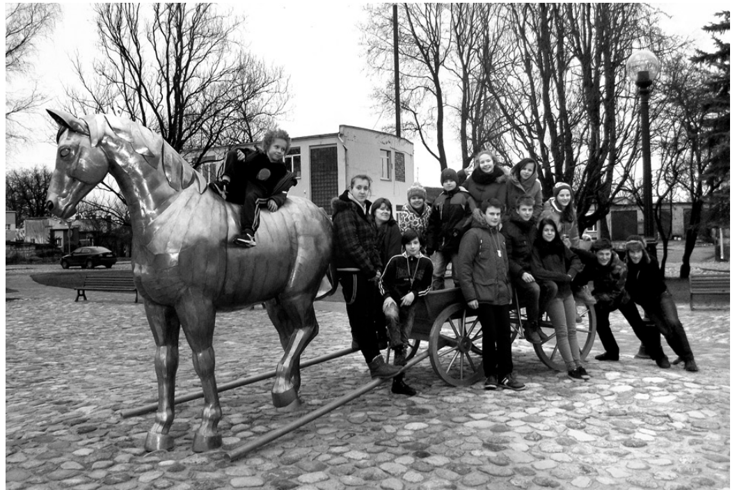
Pulciņa dalībnieki Jēkabpils centrā Zirga gada sākumā.

Jūnija sākumā misenieki uzņēma viesus vasaras sporta tūrisma spartakiādē Kurmenē. Šajās sacensībās tika iedibināta jauna veida distance – individuālais tūrisma rallijs, kas ir orientēšanās pa vienam un vēl dažādu tehnisku uzdevumu veikšana. Distancē noteicošais – padarīt pēc iespējas vairāk, nepārsniedzot kontrol-laiku. Šo sacensību organizēšanā un norisē piedalījās ap 30 Misas vidusskolas audzēkņu un pedagogi, kā arī biedrības «Jaunatne smaidam» dalībnieki. Viesiem patika klusā un