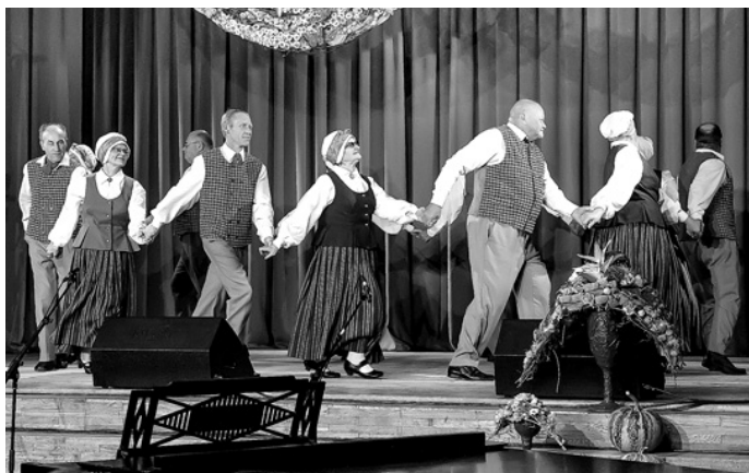
Senioru deju kopa «Ozols» apliecināja savu profesionalitāti, turpinot priekšnesumu arī tad, kad tehniskas ķibeles dēļ pārstaļa skanēt mūzika.