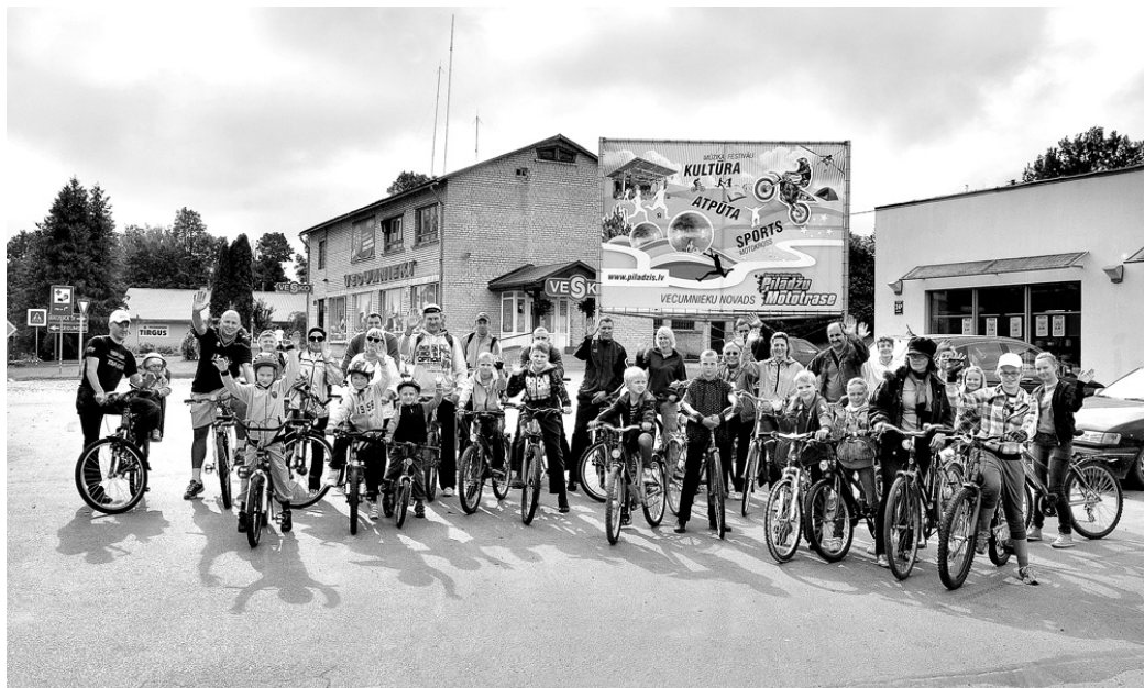
Ap 40 velosipēdistu – gan bērni, gan pieaugušie – septembra vidū devās pretī rudenim, cerot to sastapt Vecumnieku pagasta Zvirgzdes pusē.

Liels paldies tiem, kuri šo pasākumu padarīja patīkamāku un drošāku. Visa ceļa garumā par braucējiem rūpējās novada domes Sabiedriskās kārtības nodaļas vadītājs Edgars Polis. Velobrauciena dalībnieces Katrīnas tētis Imants Lav-