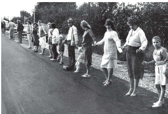
Bārbelieši akcijā «Baltijas ceļš».