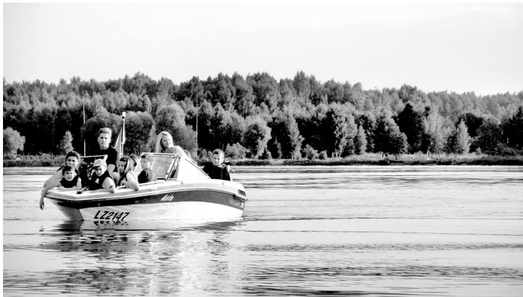
Misas bibliotēkas lasītāji šovasar devās jaukā ekskursijā un izmantoja iespēju kuģot pa Daugavu.

Vecāku žūrijas dalībniekiem piedāvātas šādas grāmatas: K. Krauzere «Ezera Annija»,