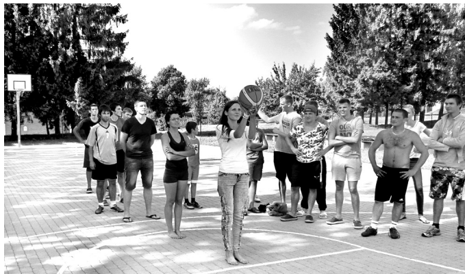
Krietns pulks dalībnieku iemēģināja roku basketbola soda metienos.