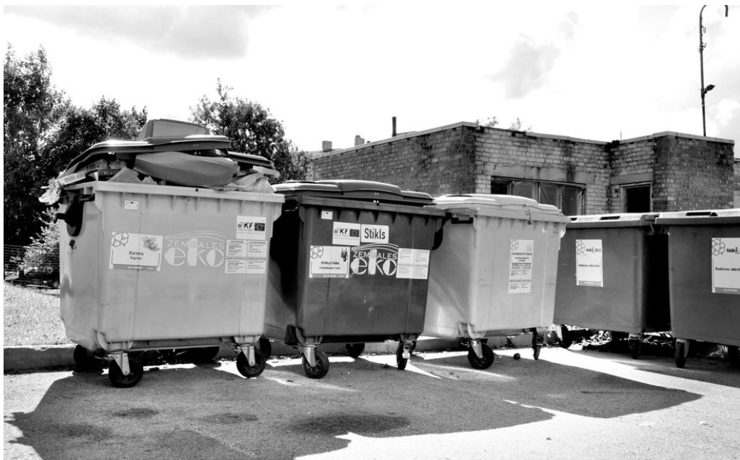
Konteineru punktos esošās šķīrotu atkritumu tvertnes papīram, plastmasai un stiklam tiek aicināti izmantot visi novada iedzīvotāji.

Tvertni bojā ne tikai neatbilstīgi atkritumi, bet arī to mērķtiecīga blīvēšana. Piemēram, konteineru nedrīkst pārkraut, lai nepieļautu tā apgāša-