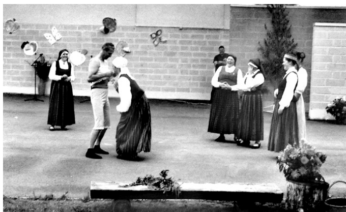
Rotaļas dalībniecēm jāpasniedz ūdens pudele izslāpušajam baronam, neizmantojot rokas.

L. SKĀBULIŅA, deju kolektīva «Stelpe» vadītāja