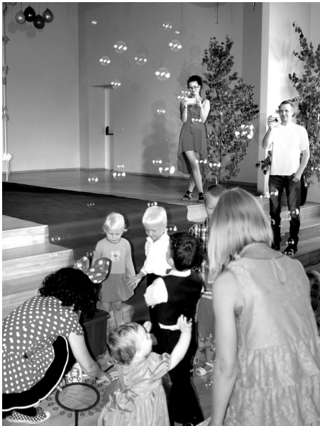
Ar prieku bērni piedalījās pelītes Minnijas organizētajās izklaidēs.