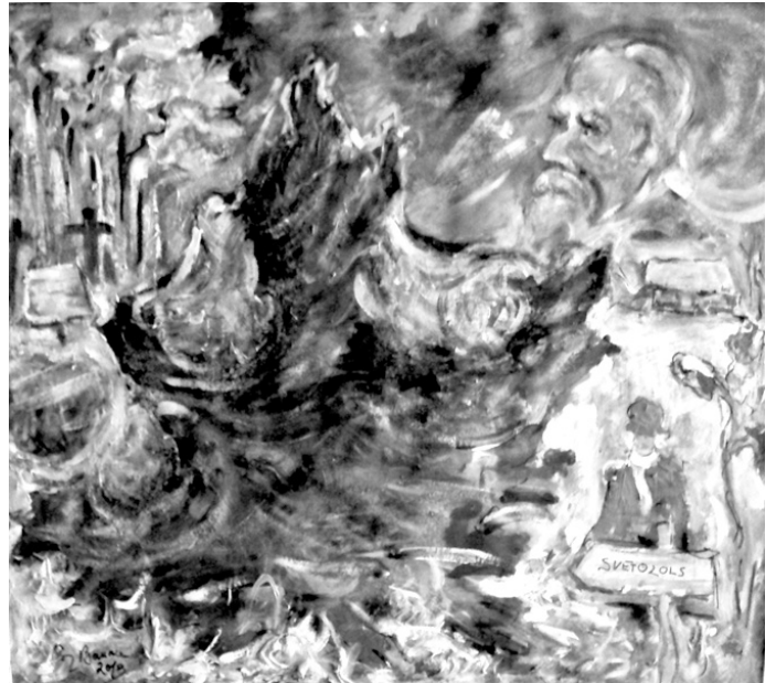
Senatmiņuņēmējas, mākslinieces Dzirde Baumas glezna «Kuņķu mistērija». Tajā attēlota Inta Groskaufmane pie tēvutēvu svētozola.