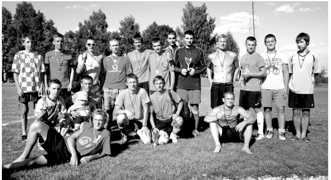
Futbolā sacentās sešas komandas, bet par laureātiem kļuva tikai trīs: «Iecava», «Bārbele» un «Vecumnieki».