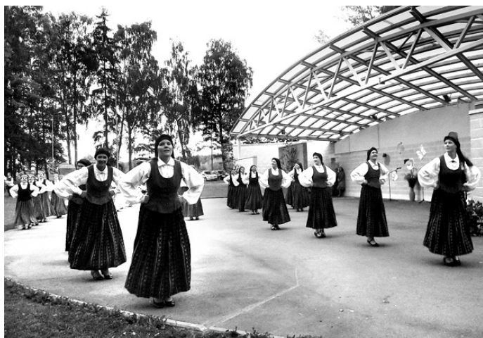
Visu kolektīvu dāmas vienotās dejā «Kreiburgas polka».