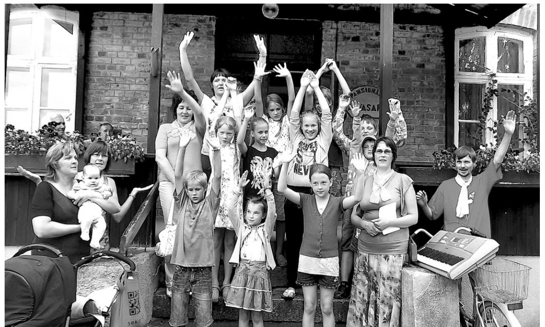
Vecumnieku evaņģēliski luteriskās draudzes organizētās vasaras nometnes dalībnieki apmeklēja veco ļaužu un invalīdu pansionātu «Atvasara».

nā gan lielajiem, gan mazajiem dalībniekiem, jo tā bija pirmā iespēja pabūt visiem tik cieši kopā, turklāt šķita – Dievs visus nes uz rokām, jo, iespējams, tie bija eņģeļi, kas atsūtīja dažādus palīgus šo nodarbību organizēšanā.