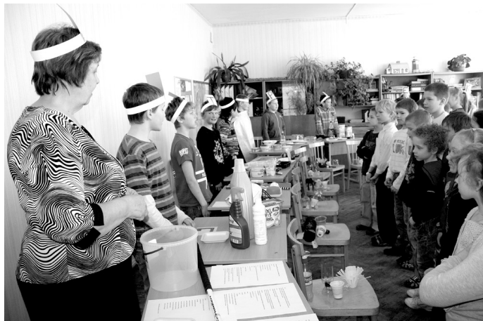
4. klases audzēkņu sagatavotā prezentācija «Plastmasas ražošanas cikls».

Jau divus gadus Misas vidusskola ir ceļā uz ekoskolas statusa iegūšanu. Lai sasniegtu šo mērķi, vienoti ir visi – gan ekopadome, kas plāno darbu, gan visu klašu kolektīvi, kuri ieceres ar lielu interesi realizē.