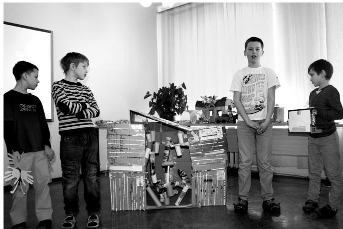
3. klases skolēnu darinātā māja no kartona kastēm.

Nedēļas garumā darbojās divas radošās grupas: 7. un 8. klašu zēni skolotāja R. Zandava vadībā, izmantojot izlietotās skārdenes, radīja solāro dehidratoru (ierīce, kas žāvēšanai izmanto saules siltuma enerģiju), bet 6. klases meitenes no «padziņojušiem» materiāliem