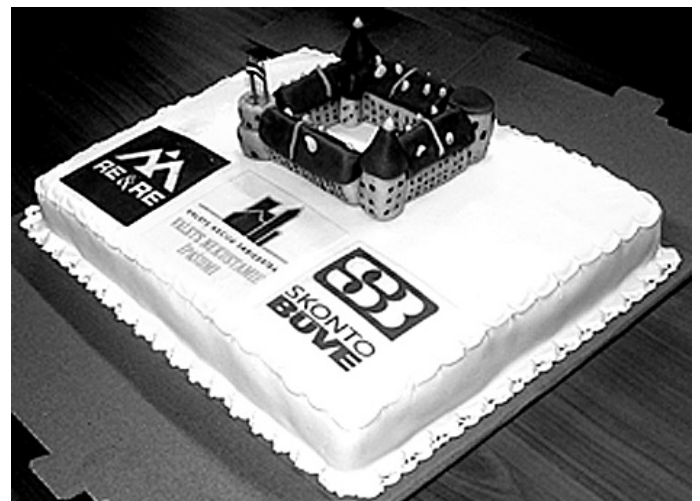
Pārsteigumu sagādāja torte, ko rotāja miniatūra Rīgas pils, kas veidota no marcipāna.

Pēcpusdienas noslēgumā bērni tika ievesti vagoniņā, kurā strādā un apspriežas arhi-