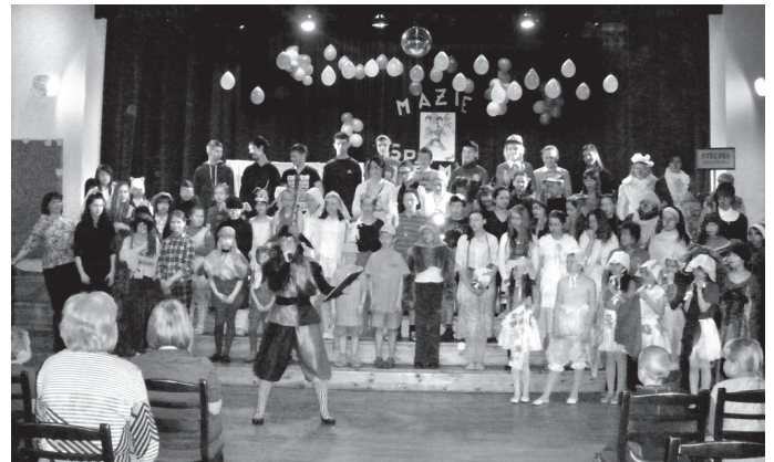
Festivāla «Mazie spēlmaņi» dalībnieki Kurmenes tautas namā izrādīja astoņas lugas.