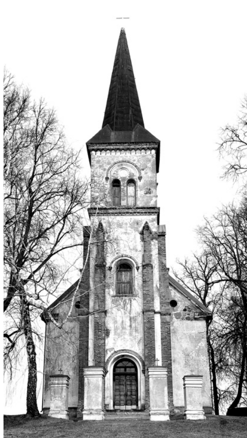
Gan Valles (attēls pa kreisi), gan Vecumnieku baznīcai nepieciešams veikt torņa un fasādes remontu.

Mēs esam pārdzīvojuši ļoti interesantu laiku, daudz kas pēdējās dažās desmitgadēs ir mainījies, un tagad mēs «šūpojāmies» – starp latu un eiro, starp nabadzību un iztikšanu, starp dažādiem politiskajiem spēkiem, nezinot, kuram no tiem uzticēties. Šīs pārdomas nav jāuztver saistībā ar pašvaldību vēlēšanām mūsu novadā (savējos mēs tomēr pazīstam un, izdarot izvēli, ļaudis balsos par cilvēkiem), bet gan ar lielākiem politiskajiem