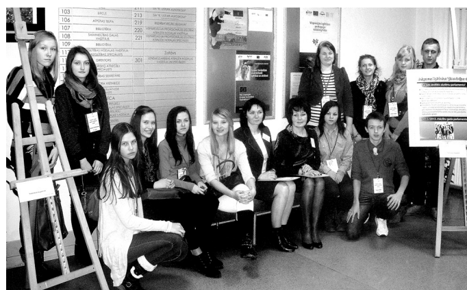
Zemgales reģiona Skolēnu pašpārvalžu forumā piedalījās arī jaunieši no Vecumnieku novada.

Daudz vērtīga foruma dalībnieki ieguva, strādājot radošajās darbnīcās «Domājam kopīgi», kur tika diskutēts par vairākiem būtiskiem jautājumiem: skolēnu pašpārvaldes misija un tās loma izglītības iestādes ārējā tēla veidošanā; pašpārvaldes sadarbības