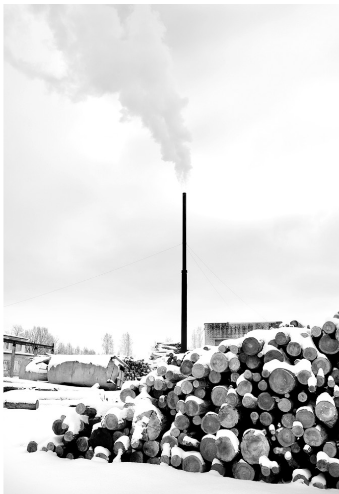
Katlumājā Rīgas ielā 43 Vecumniekos saražotā siltumenerģija savu laiku nokalpojušo cauruļu dēļ tikai daļēji nonāk pie patērētāja.

Pašlaik siltumenerģijas ražotājs un piegādātājs daudzdzīvokļu mājām un administratīvajām ēkām Rīgas ielā Vecumniekos ir SIA «JM Tehs». Uzsākot sadarbību ar SIA «Mūsu saimnieks», siltumenerģijas ražotājs un piegādātājs par saviem līdzekļiem uzstādīja siltumskaitītāju, tāpēc samaksa par piegādāto siltumenerģiju notiek pēc faktiski patērētā, nevis pēc aprēķina, kā tas bija iepriekš. Līdz šim iedzīvotāji arī nemaksāja par apkuri kāpņutelpās. Vairākus gadus siltumenerģijas ražošana katlumājā Rīgas ielā 43 SIA «Mūsu saimnieks» nesusi ievērojamus zaudējumus, kas tika seg-