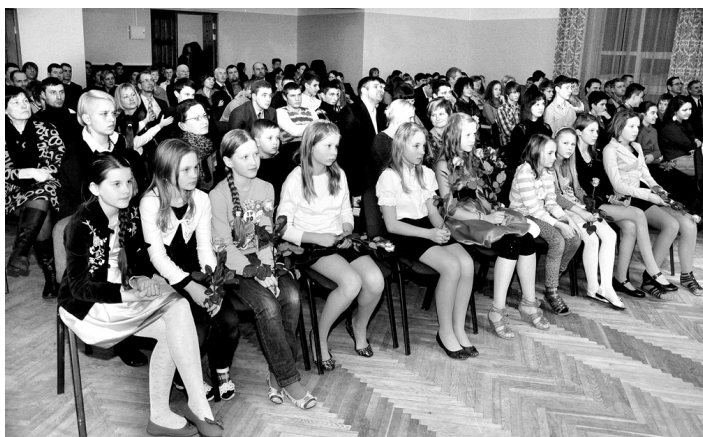
Sarīkojuma dalībnieki atzina, ka sports norūda gan fiziski, gan garīgi.

tājs var bērnus sarāt, «iedot pa pakalu», bet audzēkņi viņu tik un tā ļoti ciena un mīl. «Es nezinu, kur slēpjas tas fenomens. Reizēm varu būt skarbs, bet pēc laika atkal mīļot. Man nav grūti