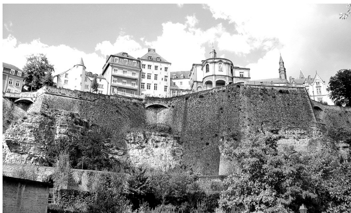
Skats no vecpilsētas uz cietokšņa klintīm ieskauto Luksemburgu.