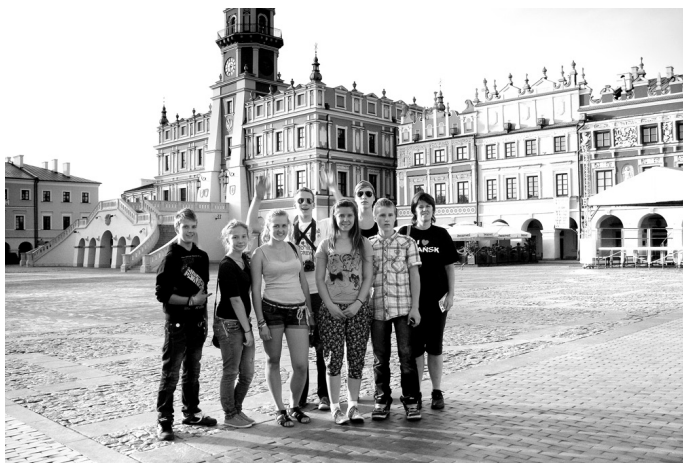
Misas vidusskolas komanda UNESCO pilsētas Zamoščes laukumā.

Dienas no 13. līdz 16. septembrim ritēja ļoti saspringti,