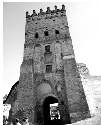
Luckas pils vārti ir nozīmīgs Ukrainas arhitektūras piemineklis, kas attēlots arī uz 200 grivnu papīra naudaszīmes.

Sacensību otrā un trešā disciplīna bija prasme orientēties, darbošanās ar virvēm, laivošana un šķēršļu pārvarēšana ar velosipēdu. Pierādījās, ka tūrisms ir sporta veids, kur daudz jādromā, jāplāno savas darbības, jābūt veiklam, jāseko līdzī laika patēriņam, lai