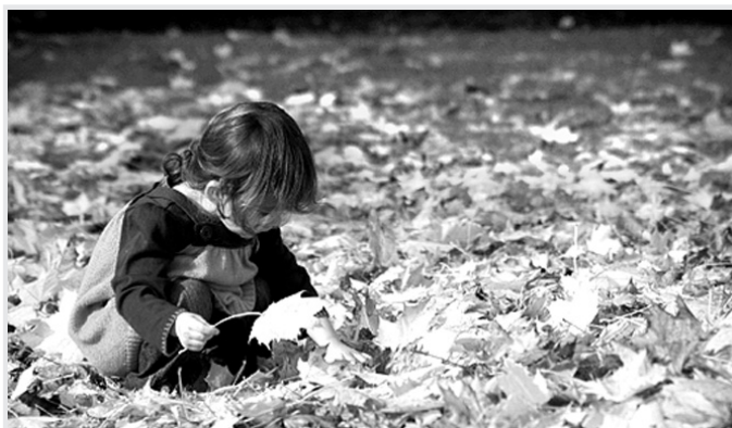
Katram bērnam ir tiesības augt ģimenē un baudīt līdzcilvēku mīlestību.

Bērna labklājība ir katra sabiedrības pārstāvja atbildība un pienākums. Bērnu tiesību aizsardzības likuma 26. pants nosaka – ģimene ir dabiska bērna attīstības un augšanas vide, un katram bērnam ir tiesības uzaugt ģimenē. Ievietojot institūcijās, netiek nodrošinātas viņiem visnozīmīgākās tiesības – augt ģimenē.