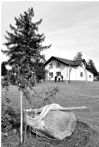
Īpašums «Viesturi» ir 0,75 ha liels, uz tā atrodas divas dzīvojamās ēkas.