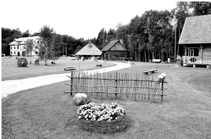
Brīvdabas muzejā «Ausekļu dzirnavas» uzburta īsta zemnieku sētas idille.