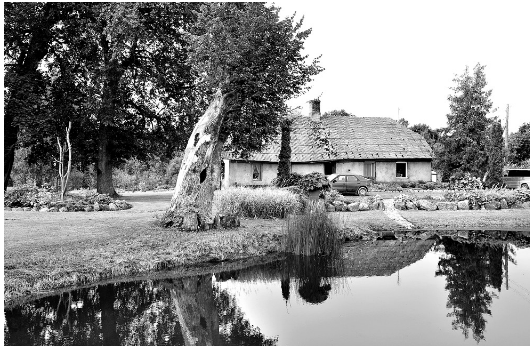
Vecajā, laika zoba skartajā liepā, kas aug diķa malā, lauku sētas «Valteri» suņi «iekārtojuši» sev mājvietu, kur patverties gan no saules svelmes, gan lietus.

Visos laikos pagastā bijusi aktīva kultūras dzīve. Tautas namā darbojas amatierēātris «Bārbelīši», kapela «Savējie», jauniešu un vidējās paaudzes deju