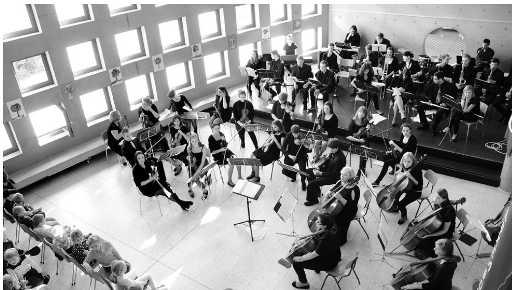
Simfoniskā orķestra «Draugi» dalībnieki Eiropas skolas pamatskolā sniedza divus koncertus.

Pulksten pusdeviņos vakarā ieradāties Luksemburgas priekšpilsētā Bourglinsterā. Mazās ieliņas, laternas un kalni, kas ieskauj pilsētiņu, radīja pa-